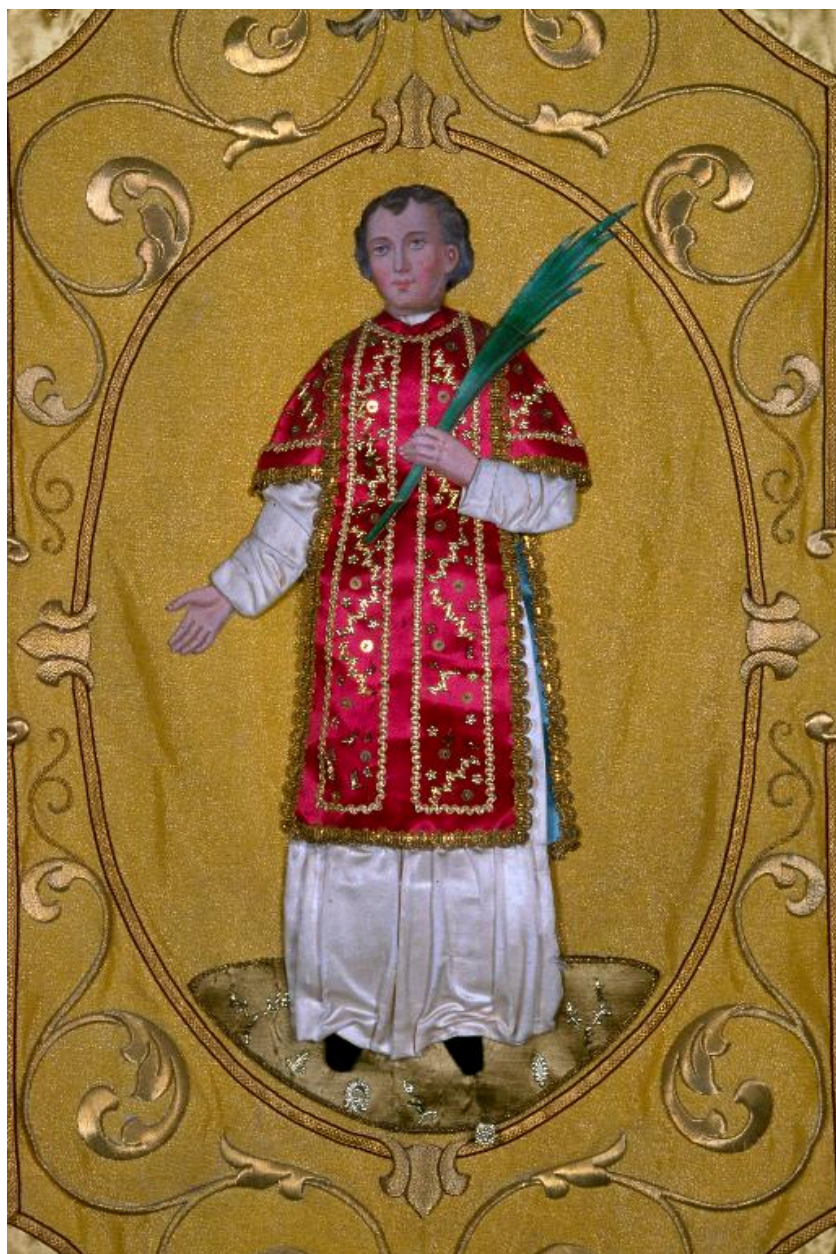
Détail : saint Vincent.