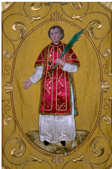
Détail : saint Vincent.