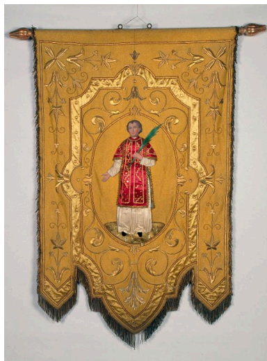
Vue générale. IVR22_20008000139ZA