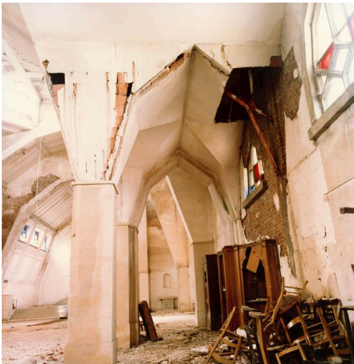
Vue intérieure, le bas côté occidental, avant sa destruction.