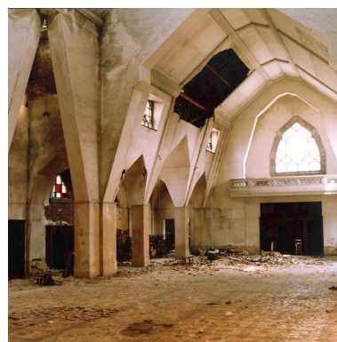
Vue générale intérieure, vers l'entrée, avant sa destruction. Photographie, photographe inconnu, circa 1985-1986. IVR31_20015901548NUC