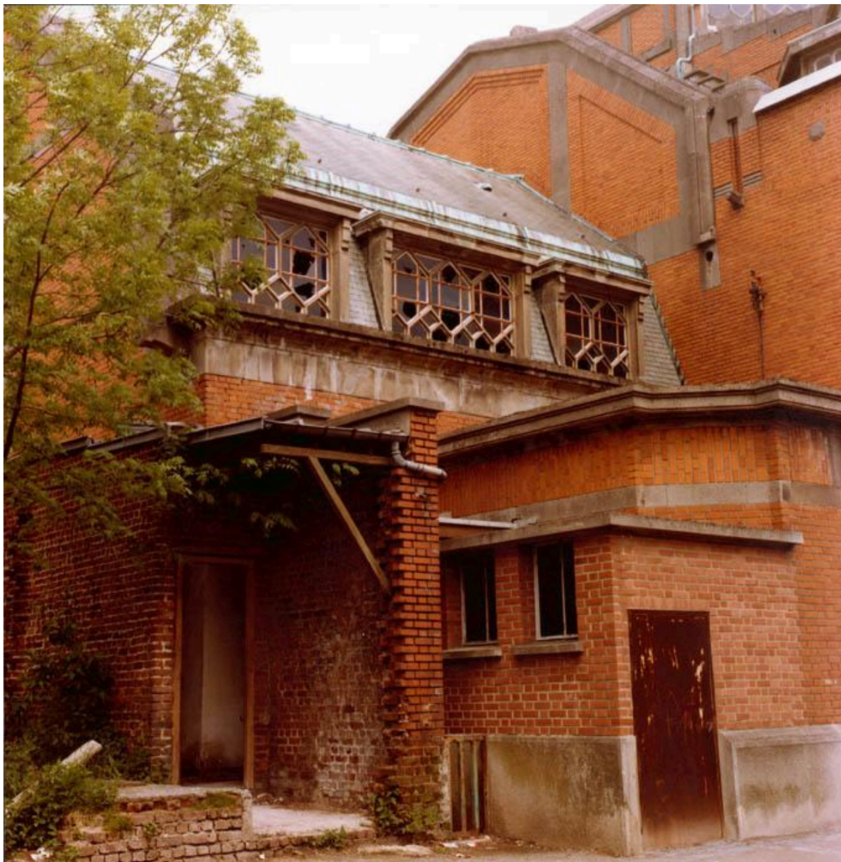
Vue partielle de trois quarts du chevet (?), avant sa destruction.