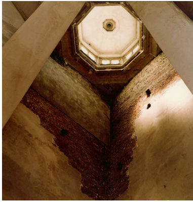
Vue générale de la voûte (coupole polygonale), avant sa destruction. IVR31_20015901552NUC