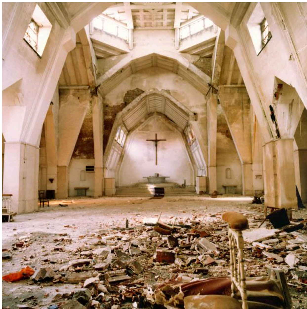
Vue générale intérieure, vers le chœur, avant sa destruction.