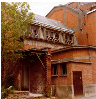
Vue partielle de trois quarts du chevet (?), avant sa destruction. Photographie, photographe inconnu, circa 1985-1986 (AC Aulnoye-Aymeries). IVR31_20015901547NUC