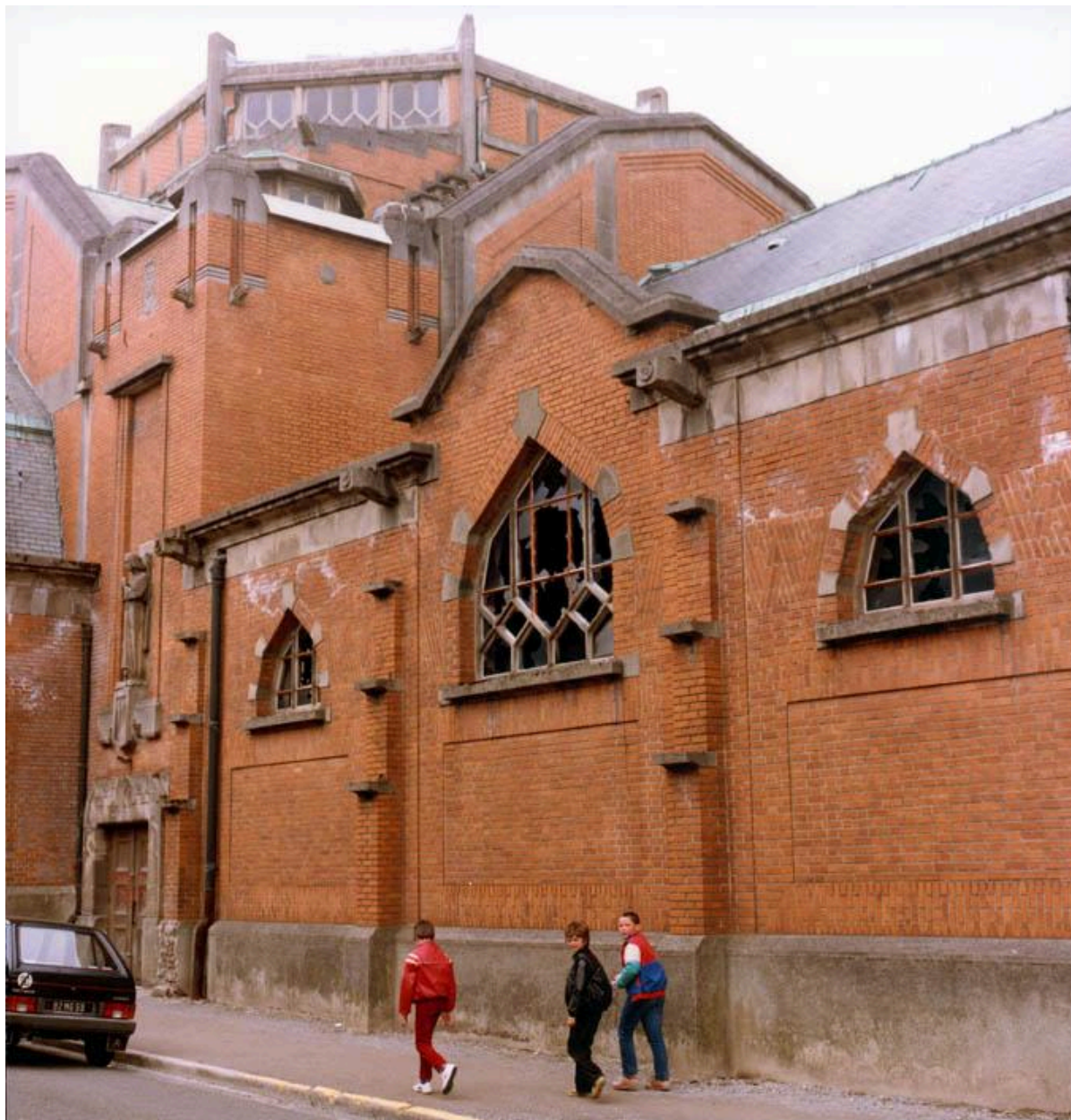
Vue partielle de l'élévation orientale et du transept, avant sa destruction. Photographie, photographe inconnu, circa 1985-1986 (AC Aulnoye-Aymeries).