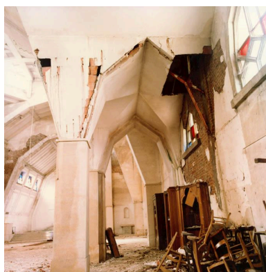
Vue intérieure, le bas côté occidental, avant sa destruction.