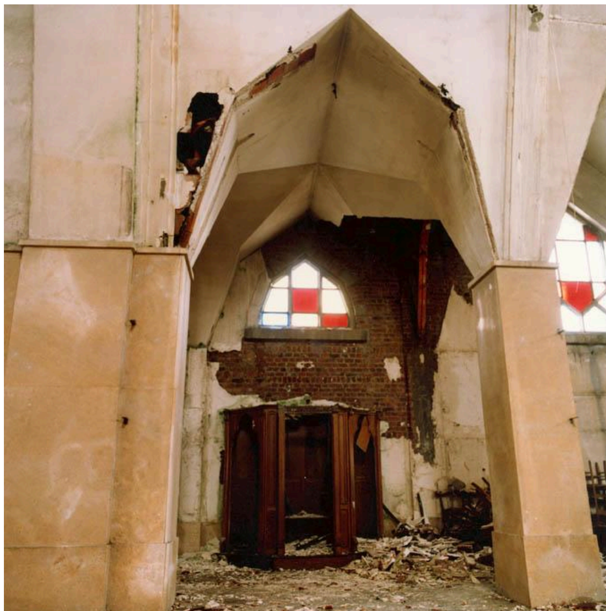
Vue intérieure, état de dégradation de la troisième travée du bas côté occidental, avant sa destruction.