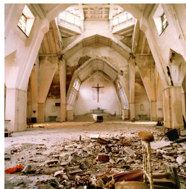
Vue générale intérieure, vers le chœur, avant sa destruction. IVR31_20015901551NUC