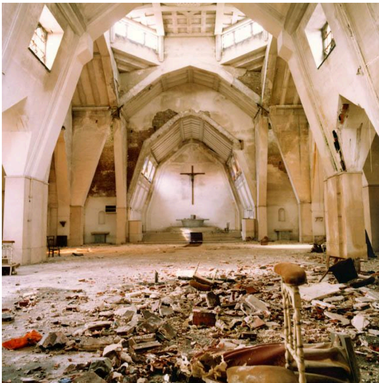
Vue générale intérieure, vers le chœur, avant sa destruction.