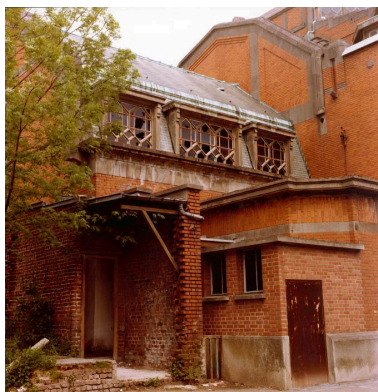
Vue partielle de trois quarts du chevet (?), avant sa destruction. IVR31_20015901547NUC