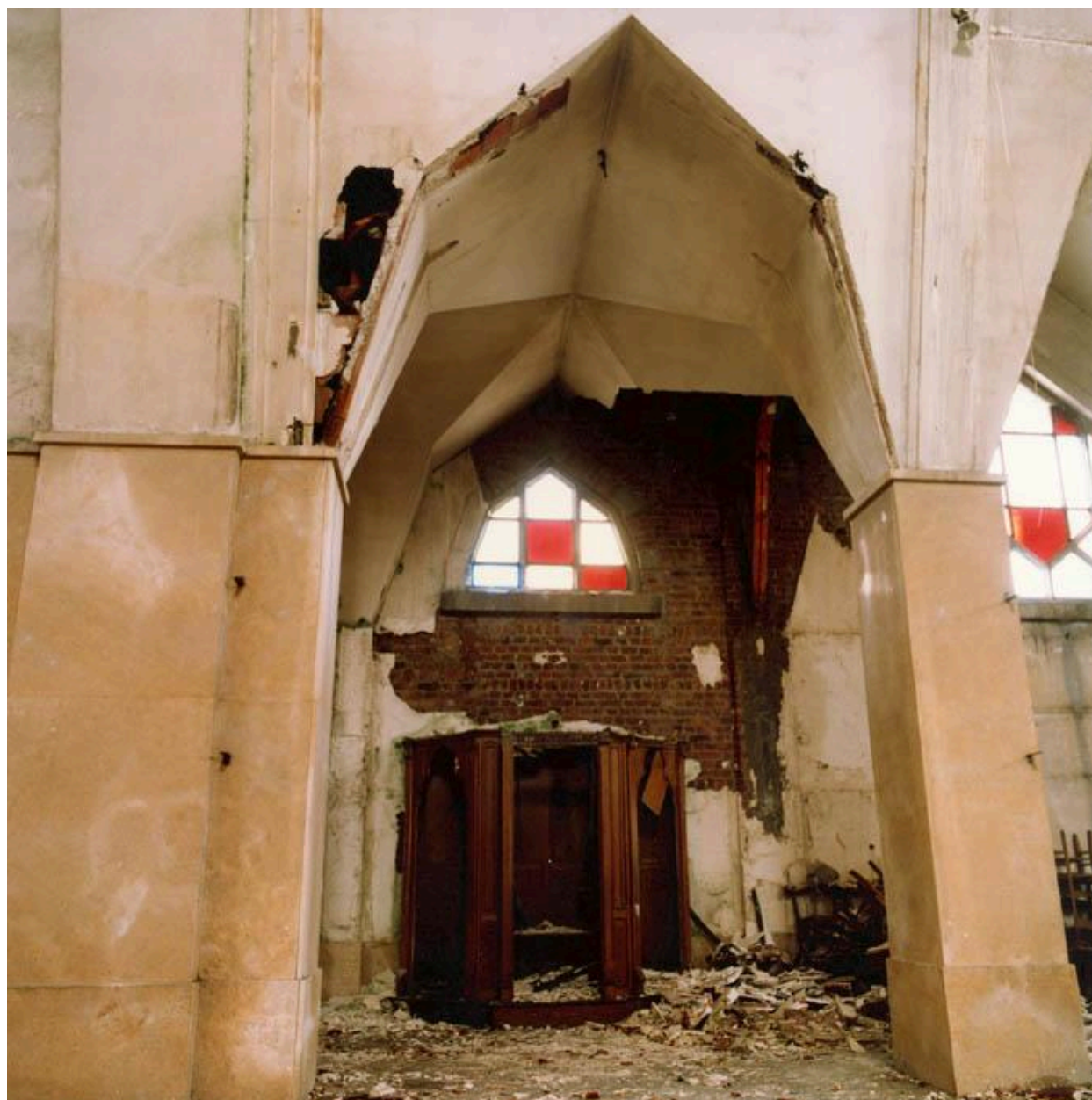
Vue intérieure, état de dégradation de la troisième travée du bas côté occidental, avant sa destruction.