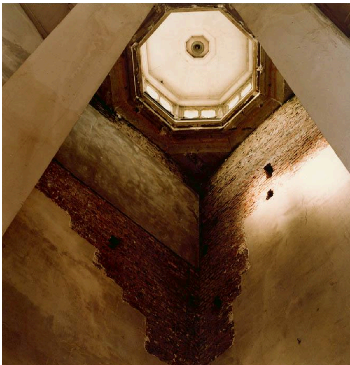
Vue générale de la voûte (coupole polygonale), avant sa destruction.