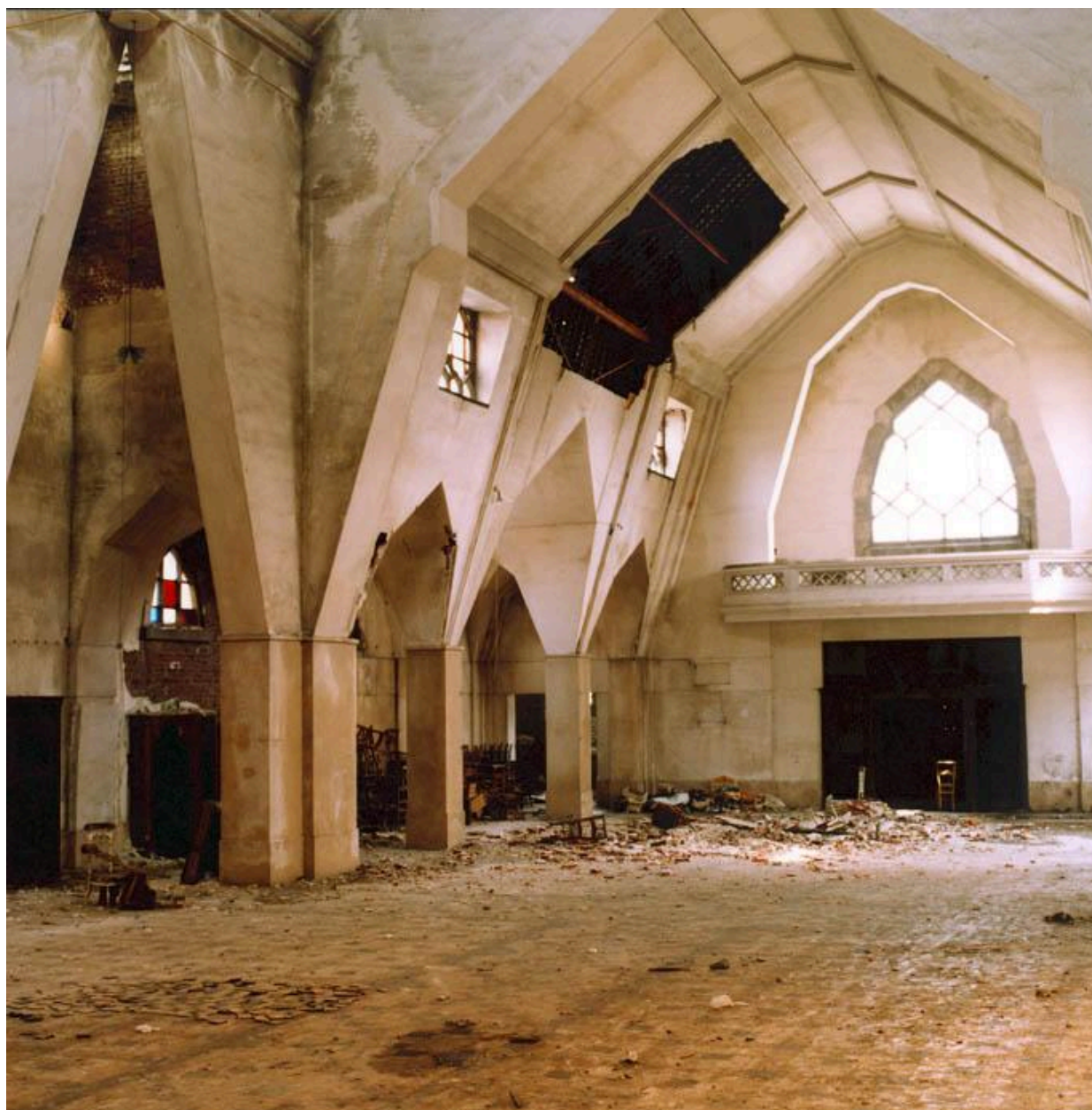
Vue générale intérieure, vers l'entrée, avant sa destruction.