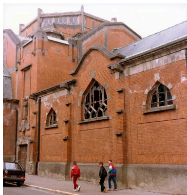
Vue partielle de l'élévation orientale et du transept, avant sa destruction. Photographie, photographe inconnu, circa 1985-1986 (AC Aulnoye-Aymeries). IVR31_20015901546NUC