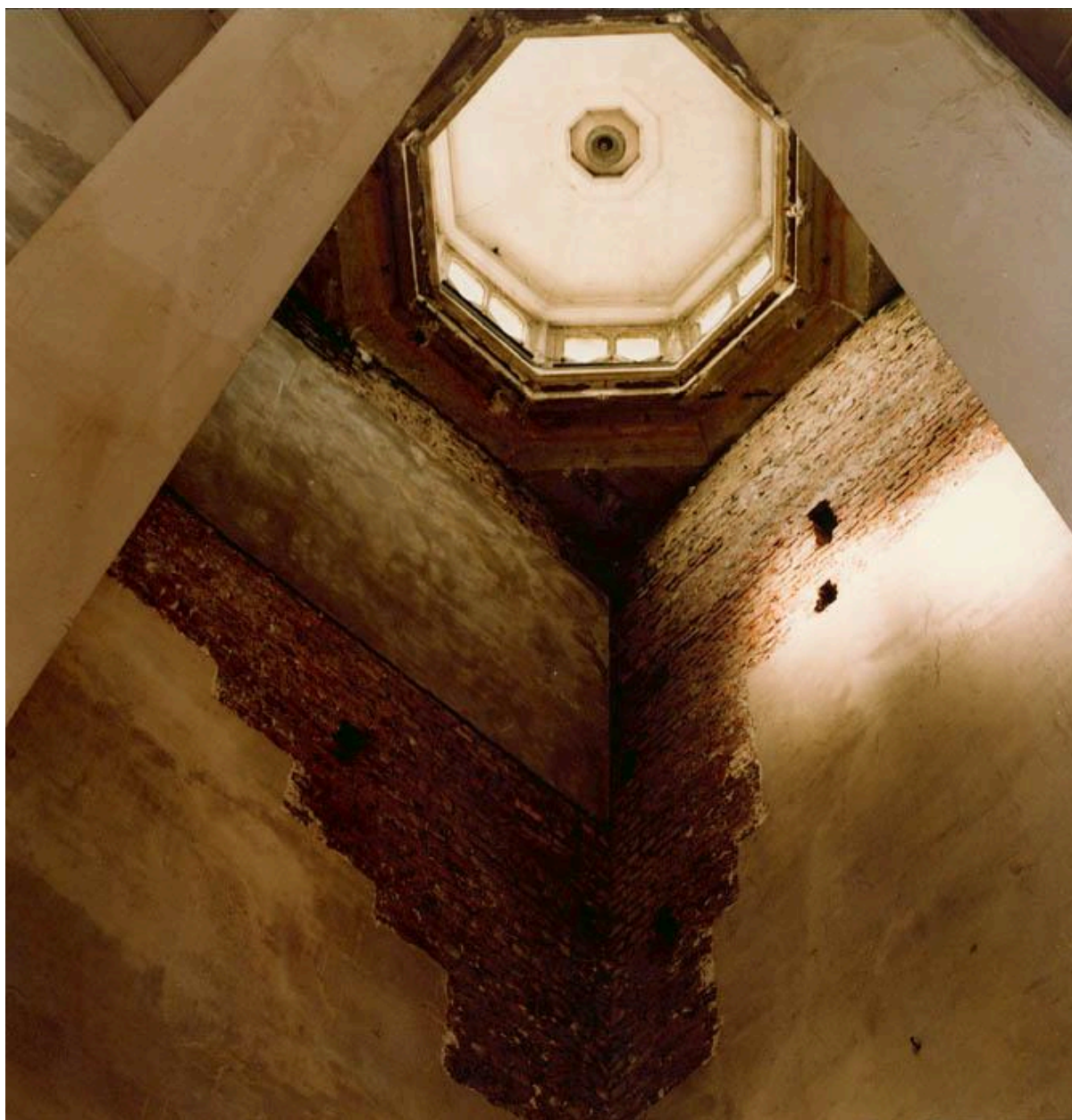
Vue générale de la voûte (coupole polygonale), avant sa destruction.