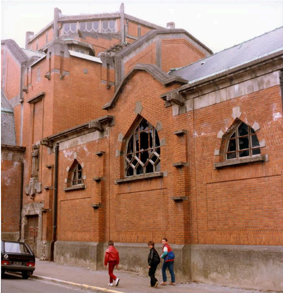
Vue partielle de l'élévation orientale et du transept, avant sa destruction.