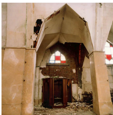
Vue intérieure, état de dégradation de la troisième travée du bas côté occidental, avant sa destruction. Photographie, photographe inconnu, circa 1985-1986. IVR31_20015901549NUC