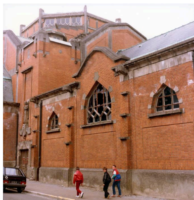
Vue partielle de l'élévation orientale et du transept, avant sa destruction.