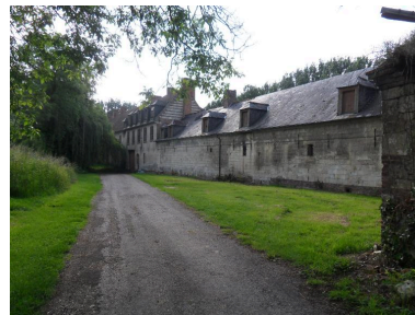
Vue de situation depuis le pont.