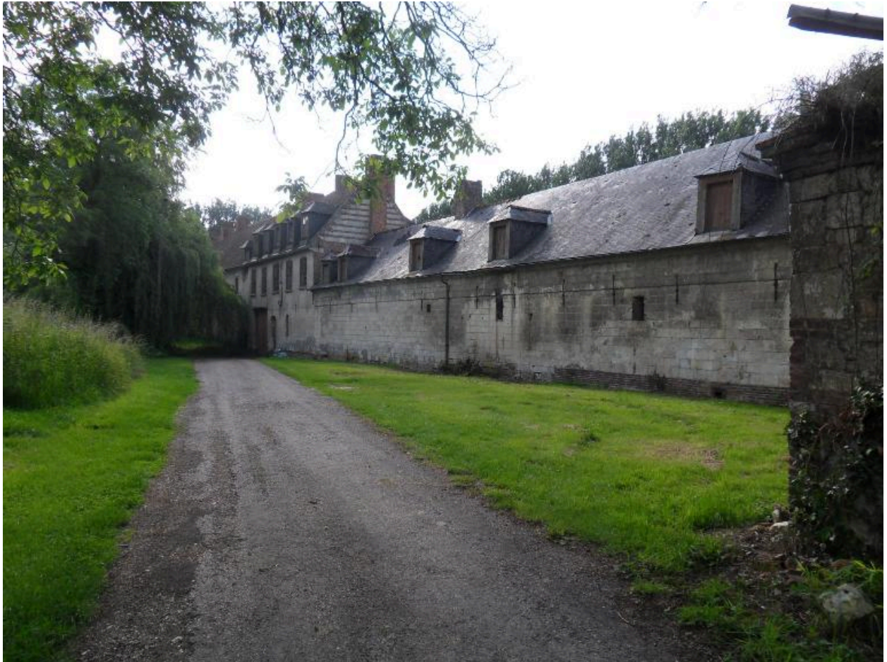
Vue de situation depuis le pont.