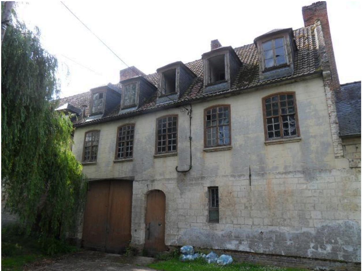
Vue du corps central.