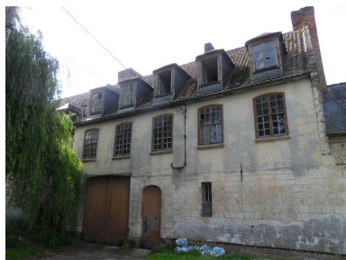
Vue du corps central.