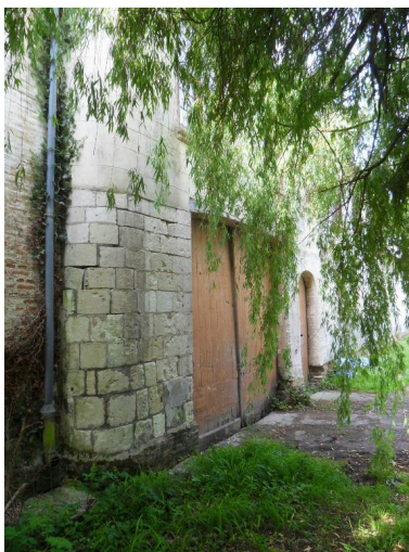
Vue de détail sur le niveau inférieur du corps de passage.