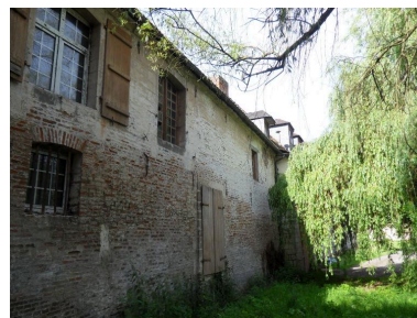
Vue du mur nord de la partie est du logis.