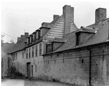
Vue générale, en 1989.