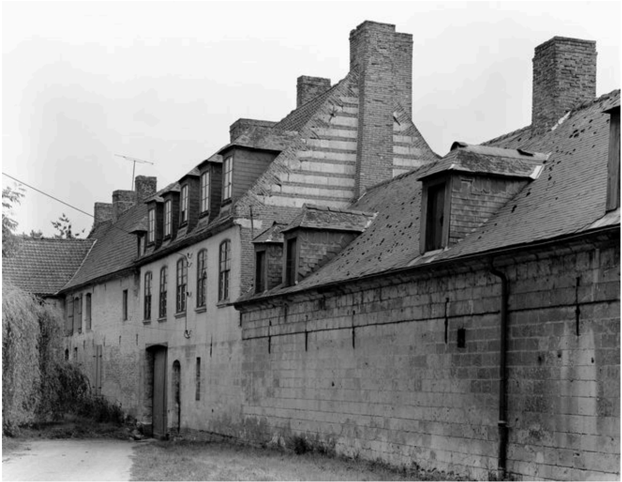
Vue générale, en 1989.