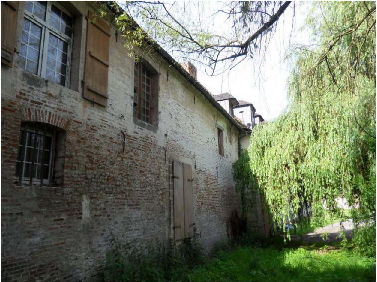
Vue du mur nord de la partie est du logis.