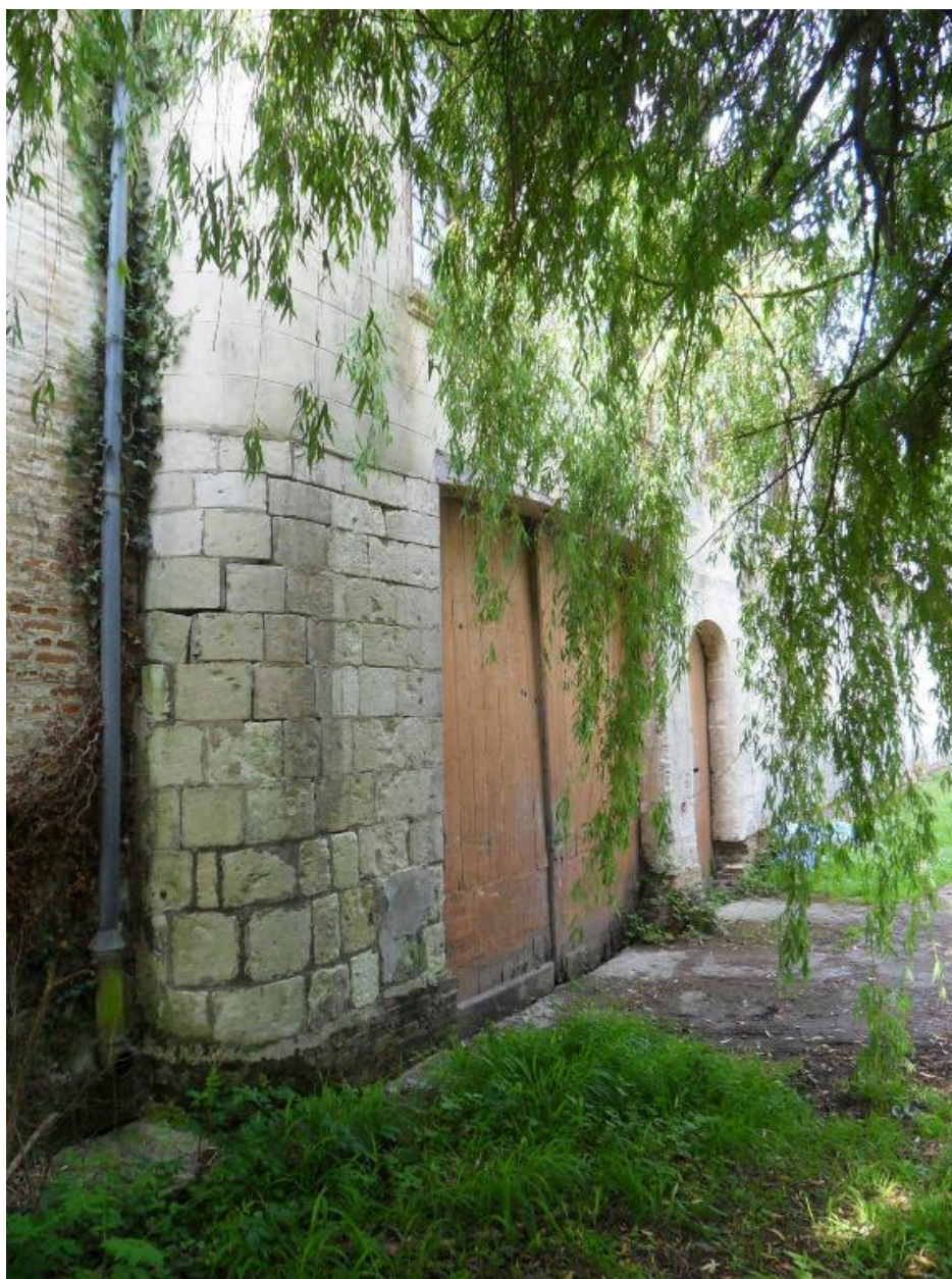
Vue de détail sur le niveau inférieur du corps de passage.