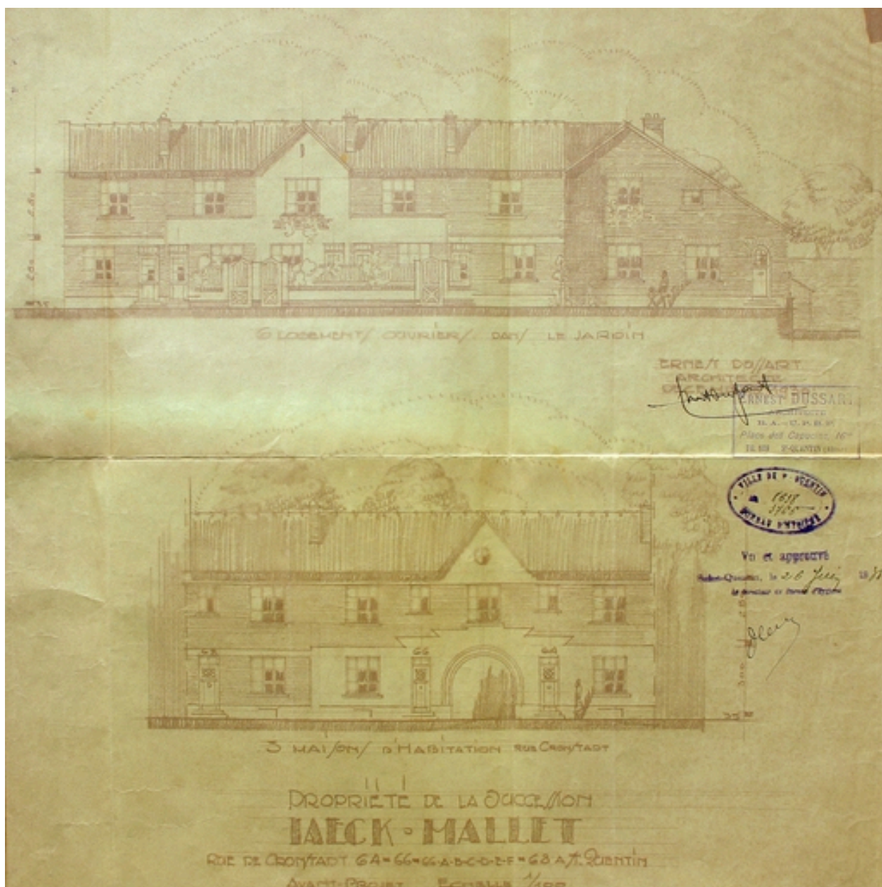
Avant-projet pour les façades antérieures, par E. Dussart, 1930 (AC Saint-Quentin).