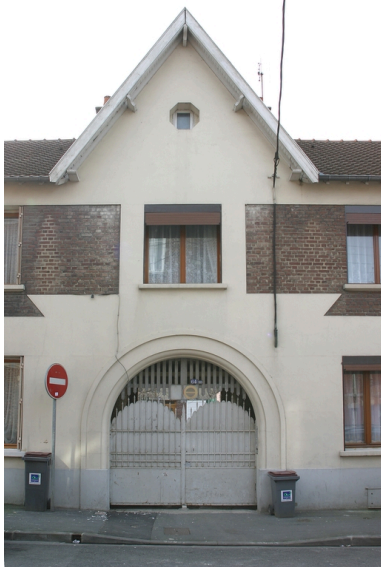
Le portail donnant accès aux logements sur cour. IVR22_20060205106NUCA