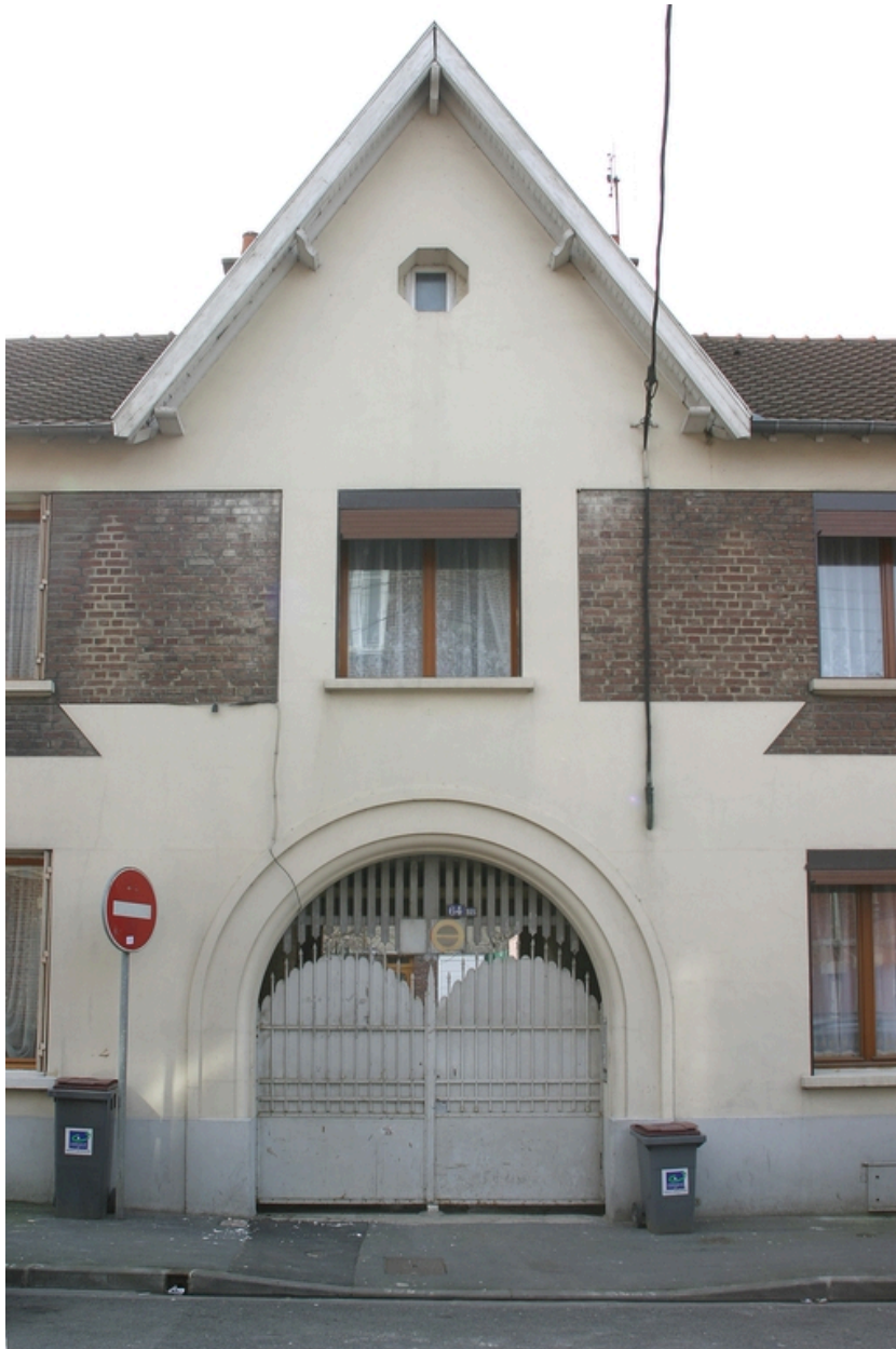
Le portail donnant accès aux logements sur cour.