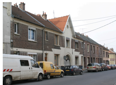
Façade antérieure sur rue.