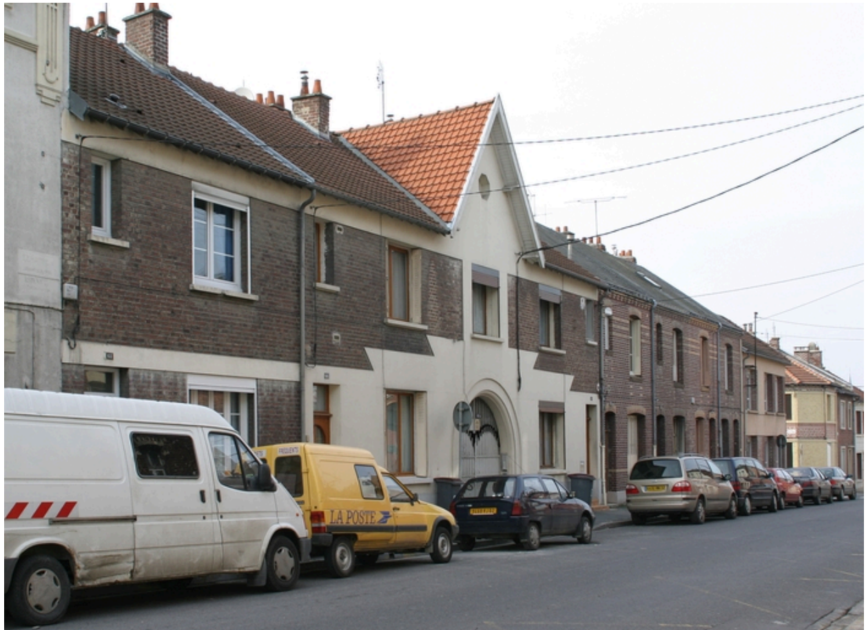
Façade antérieure sur rue.