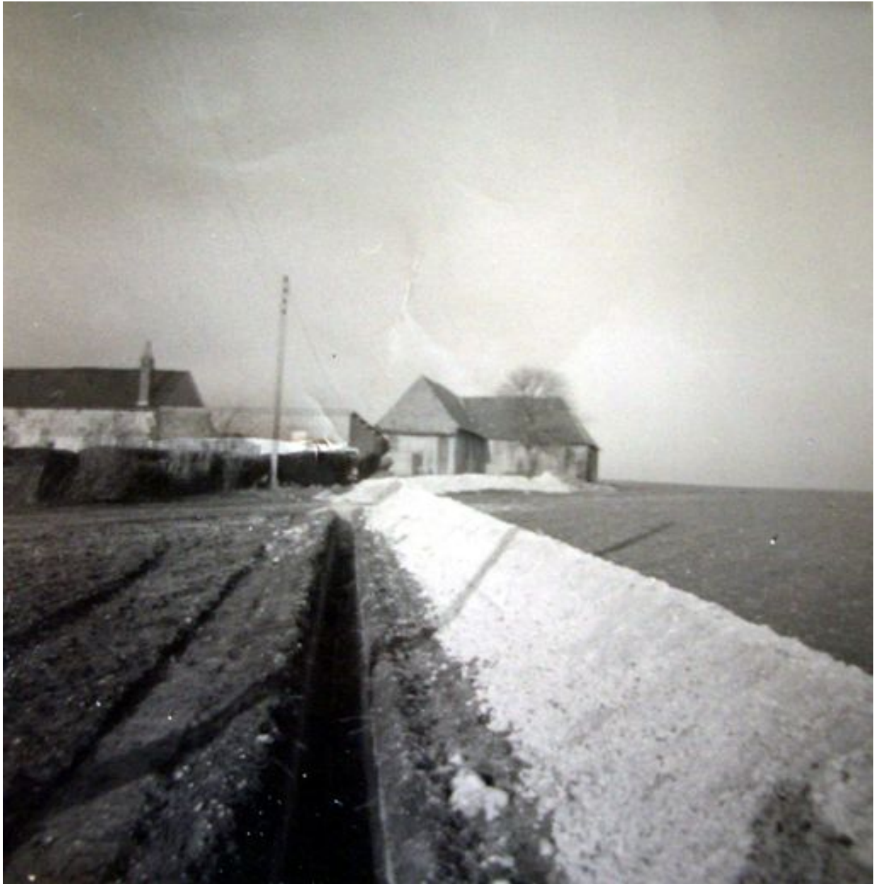
Vue de la propriété depuis la sud, dans les années 1960 : la grange à l'est est encore en place.