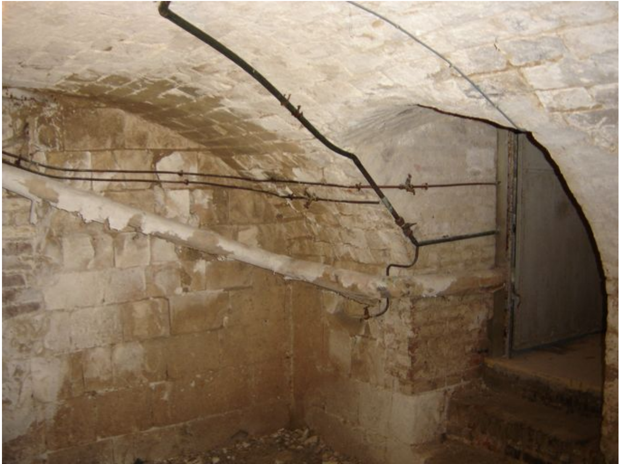
Vue d'une des pièces de la cave.