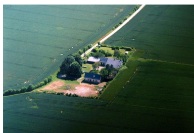
Vue aérienne depuis le nord.