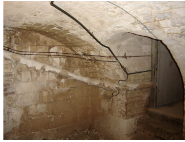
Vue d'une des pièces de la cave.