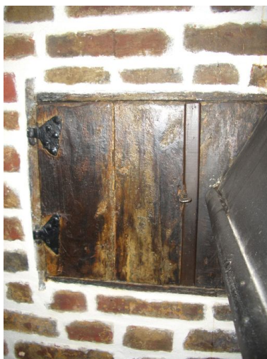
Vue de la niche située près du foyer destinée à la conservation des denrées craignant l'humidité (telles que le sel, les livres, le tabac). IVR22_20068005560NUCA