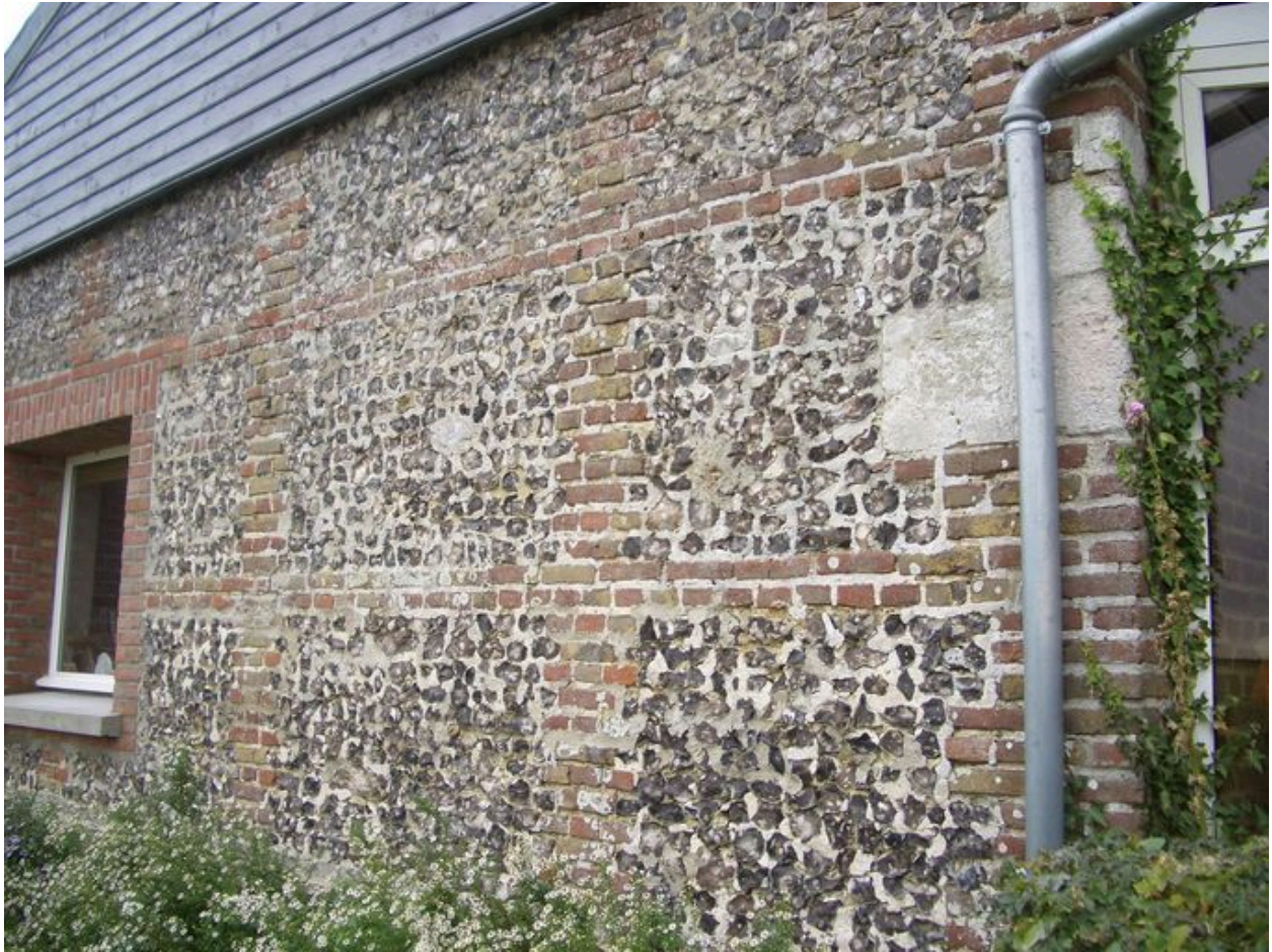
Vue de la maçonnerie des écuries au sud du logis.