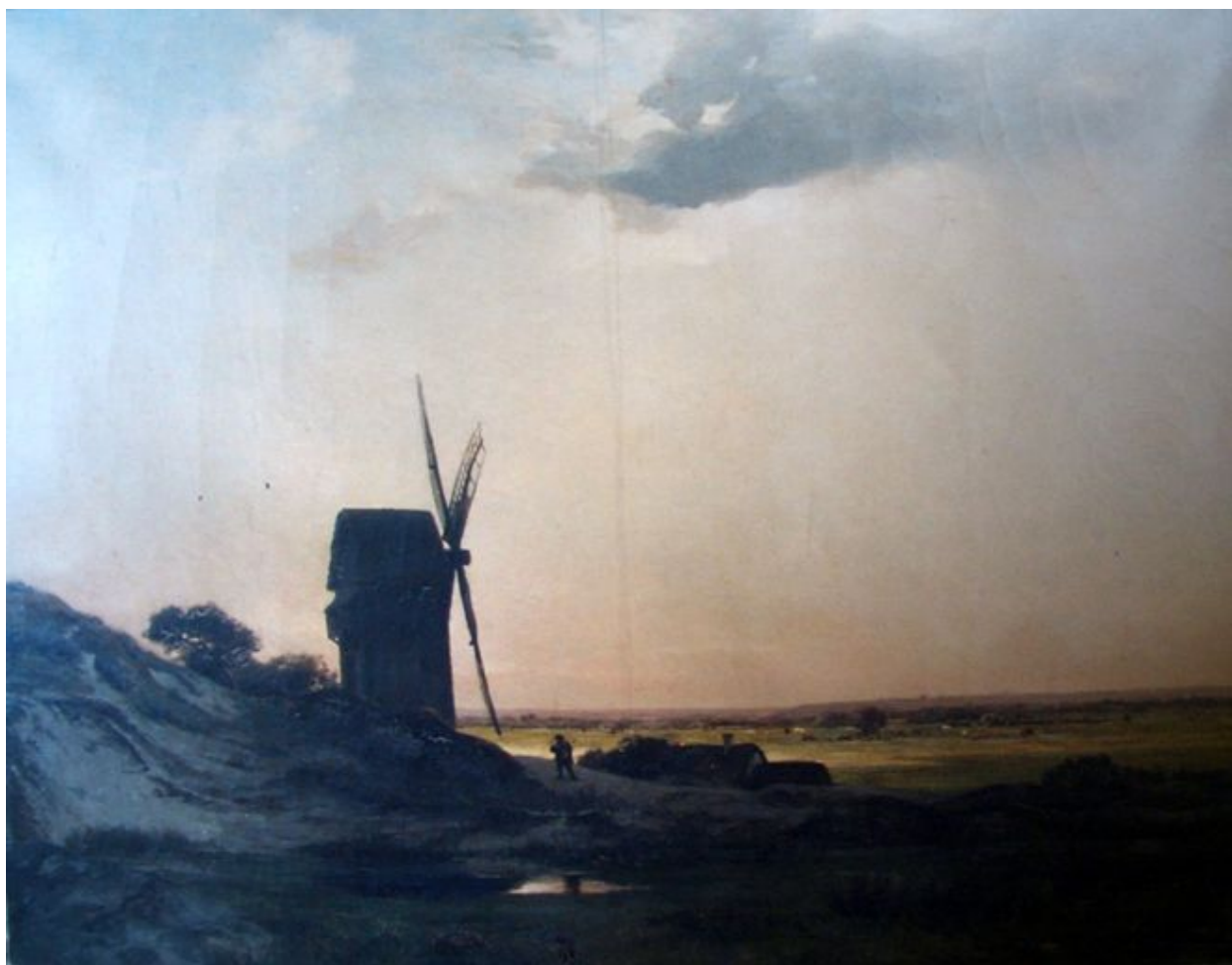
Vue du moulin au 19e siècle.