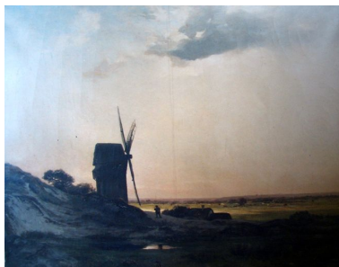
Vue du moulin au 19e siècle. IVR22_20068005550NUCAB