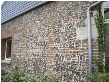
Vue de la maçonnerie des écuries au sud du logis. IVR22_20068005557NUCA