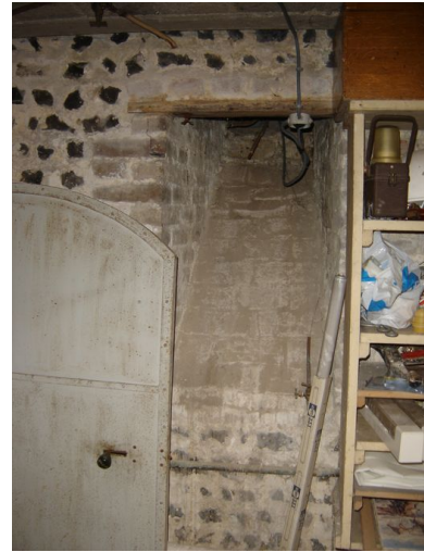
Système d'aération de la cave. IVR22_20068005569NUCA