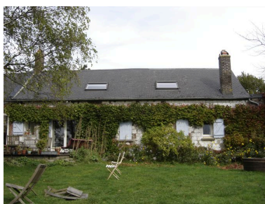
Vue du logis depuis le sud.