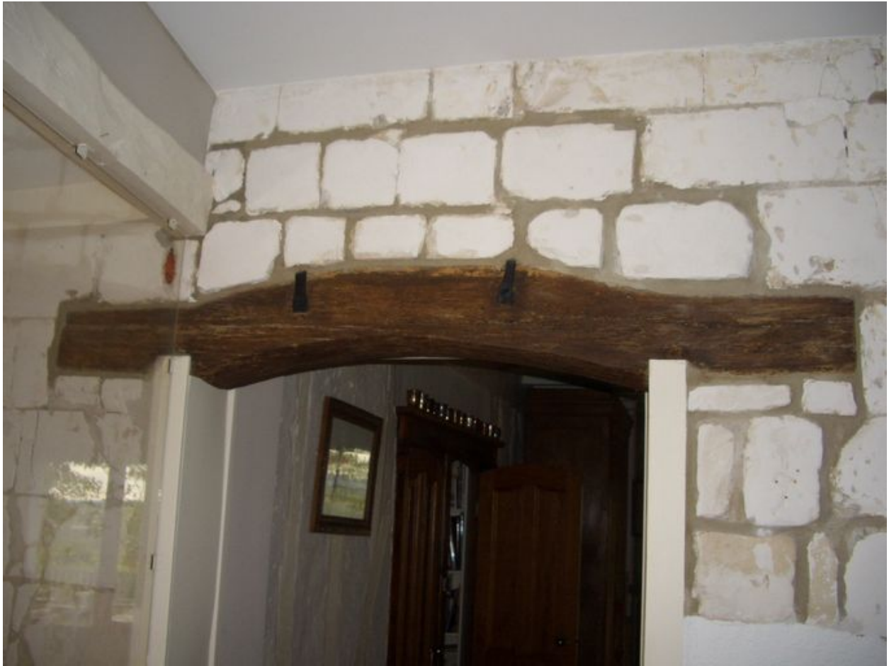
Vue de l'un des linteaux des ouvertures du logis.