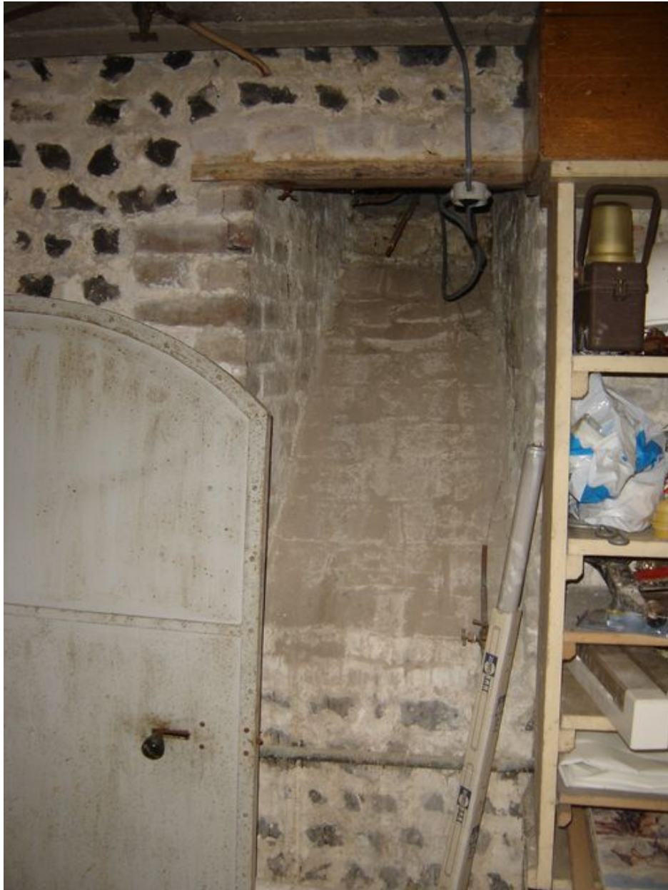
Système d'aération de la cave.