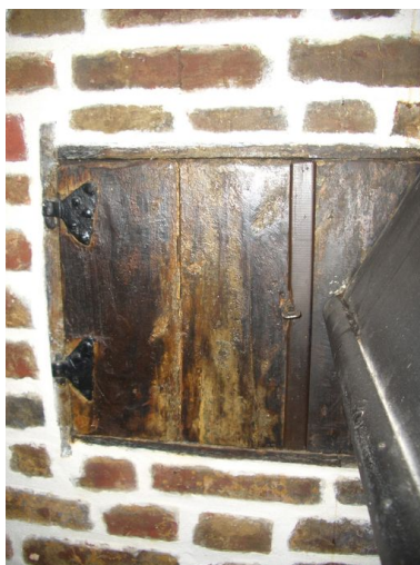
Vue de la niche située près du foyer destinées à la conservation des denrées craignant l'humidité (telles que le sel, les livres, le tabac). IVR22_20068005560NUCA