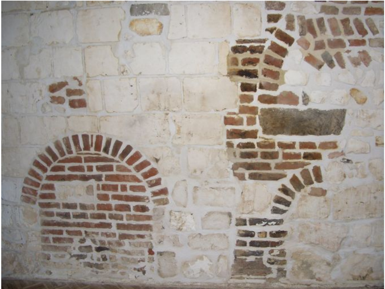
Vue des fours secondaires, aujourd'hui condamnés.