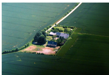
Vue aérienne depuis le nord.