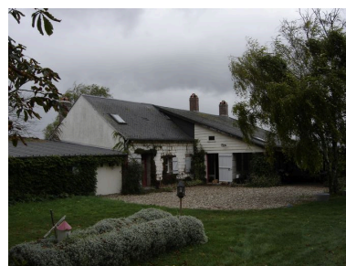
Vue postérieure depuis le nord.