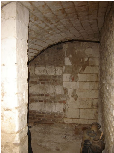
Vue partielle de la cave voûtée en pierre de taille. IVR22_20068005566NUCA