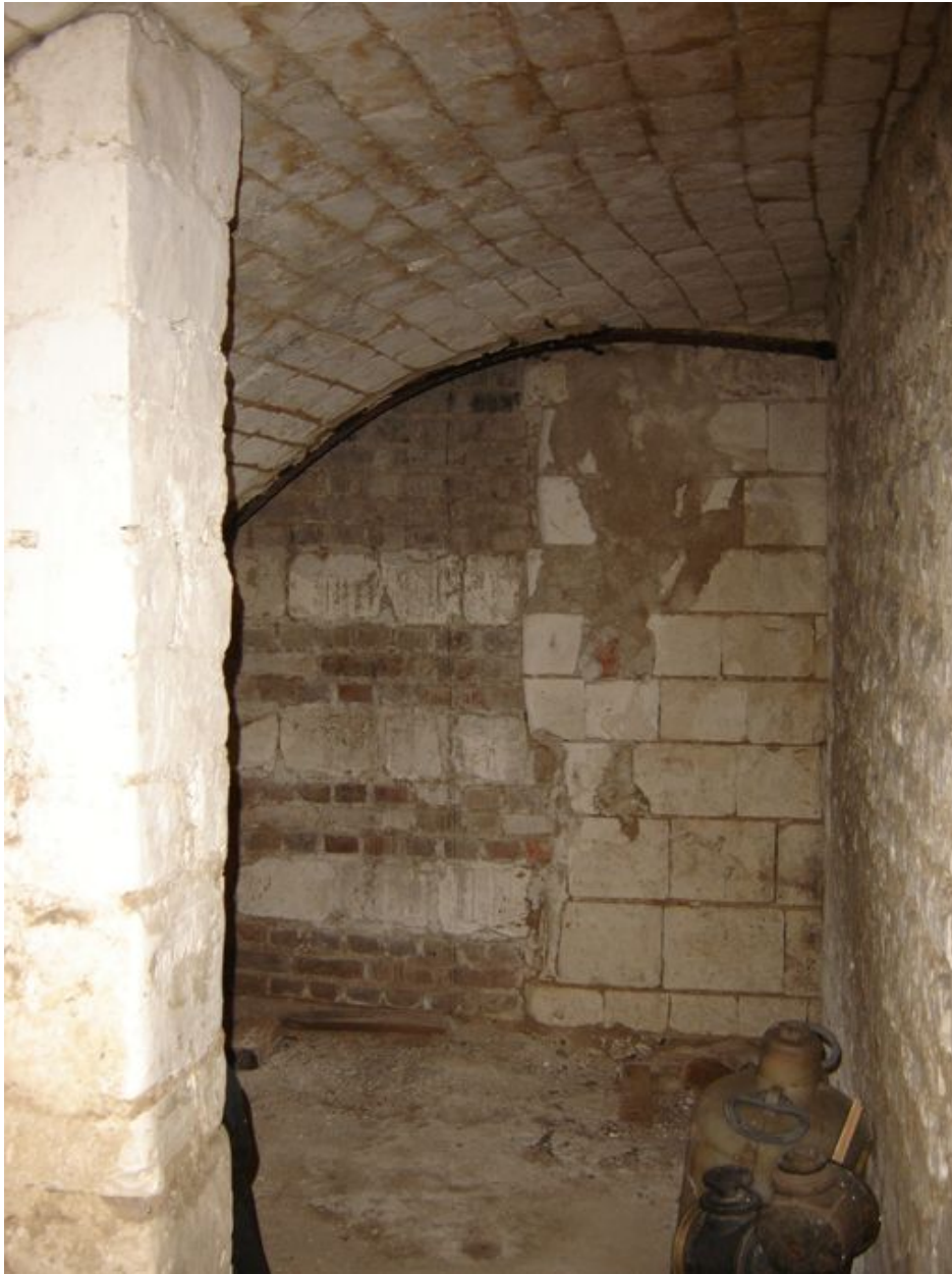
Vue partielle de la cave voûtée en pierre de taille.