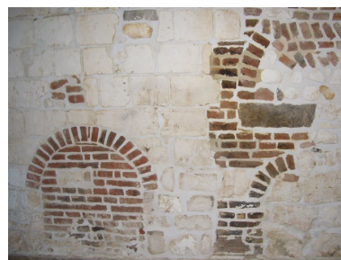
Vue des fours secondaires, aujourd'hui condamnés.