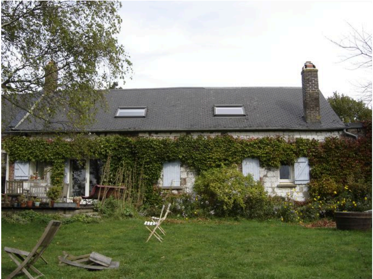
Vue du logis depuis le sud.