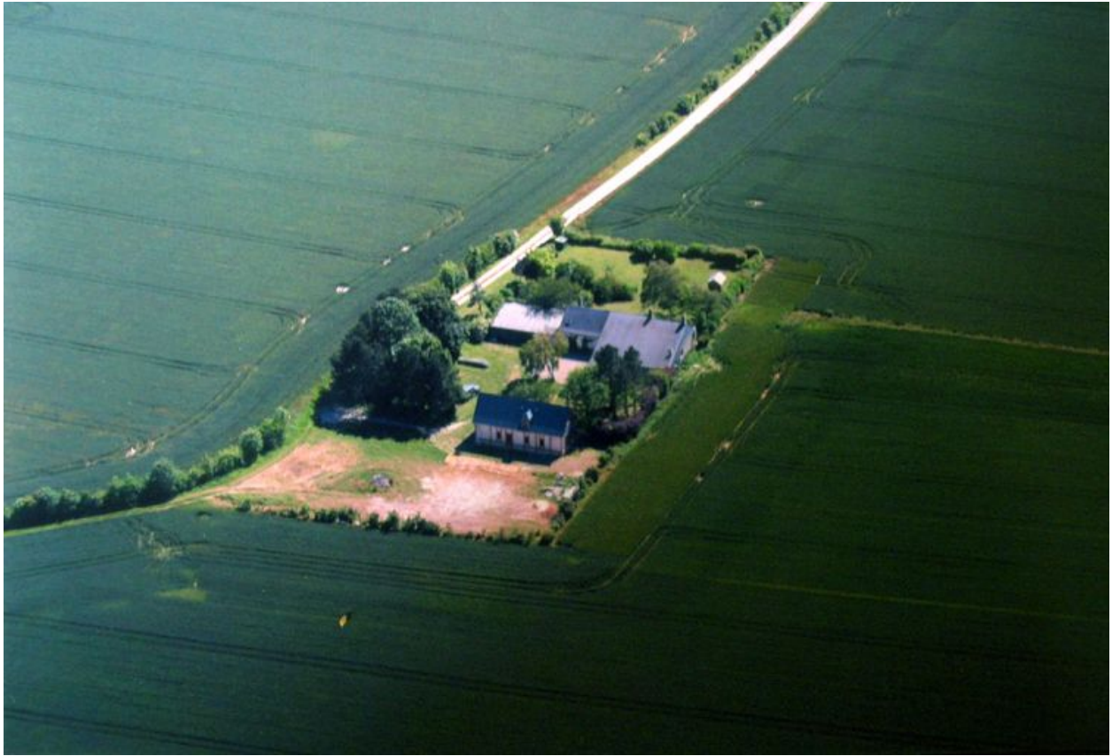
Vue aérienne depuis le nord.