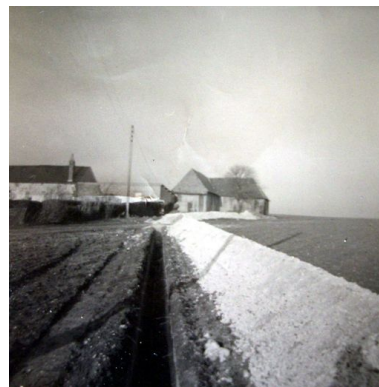
Vue de la propriété depuis la sud, dans les années 1960 : la grange à l'est est encore en place.