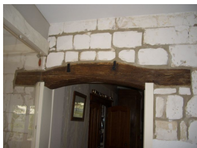
Vue de l'un des linteaux des ouvertures du logis. IVR22_20068005558NUCA