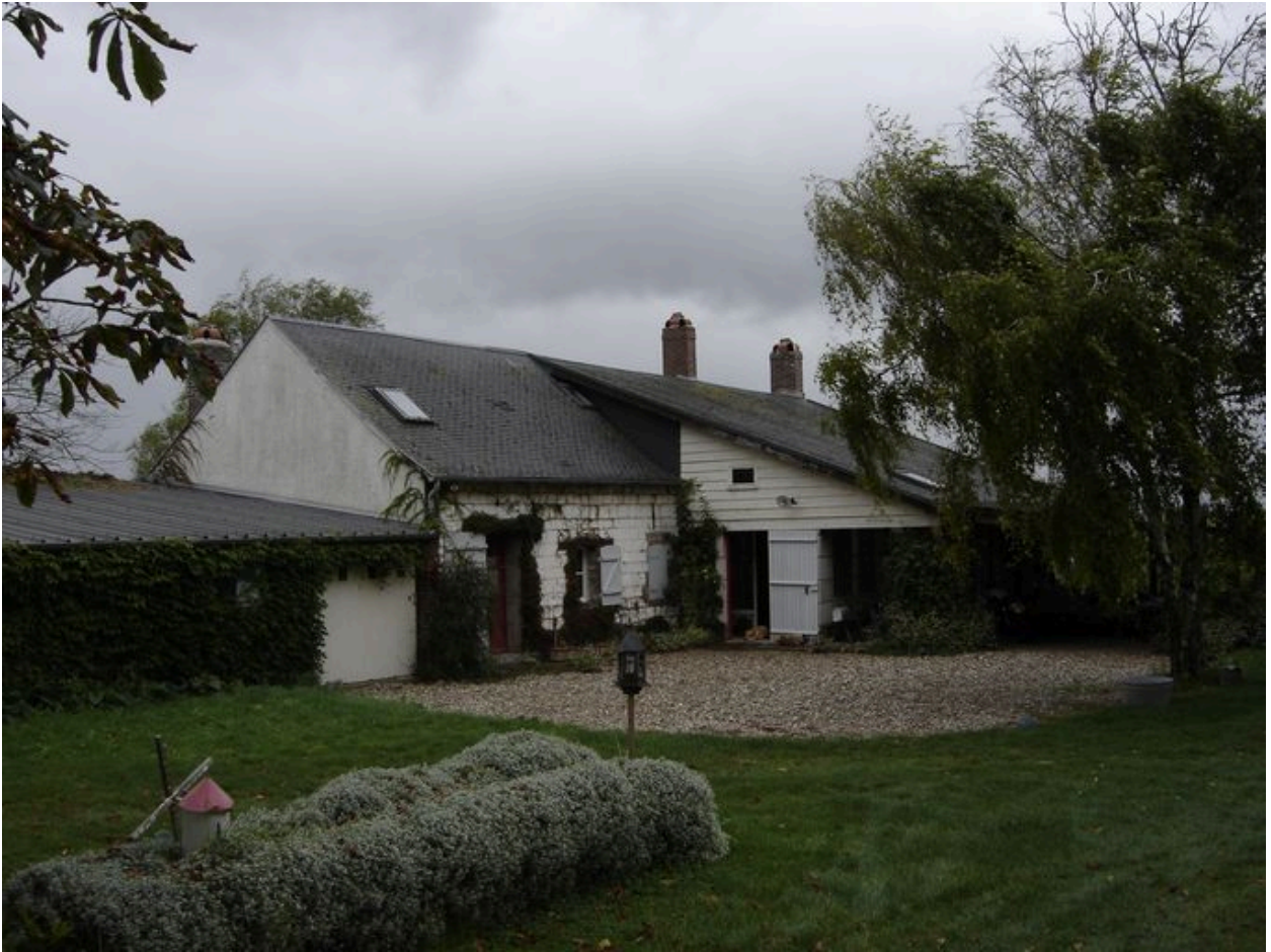
Vue postérieure depuis le nord.