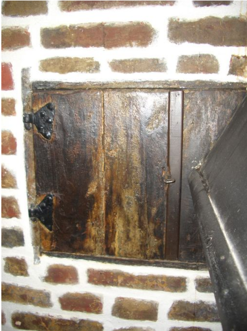
Vue de la niche située près du foyer destinées à la conservation des denrées craignant l'humidité (telles que le sel, les livres, le tabac).