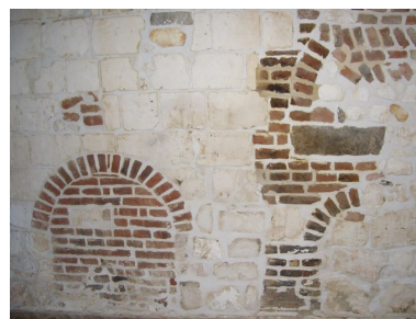
Vue des fours secondaires, aujourd'hui condamnés.