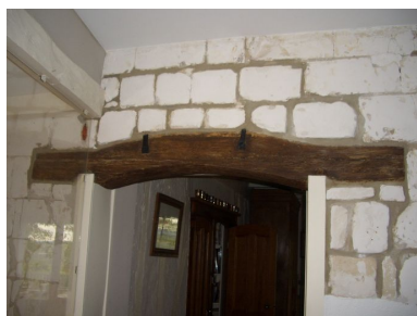
Vue de l'un des linteaux des ouvertures du logis.