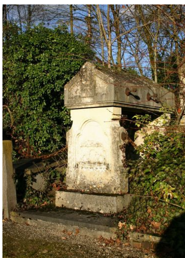
Vue générale. IVR22_20098001570NUCA