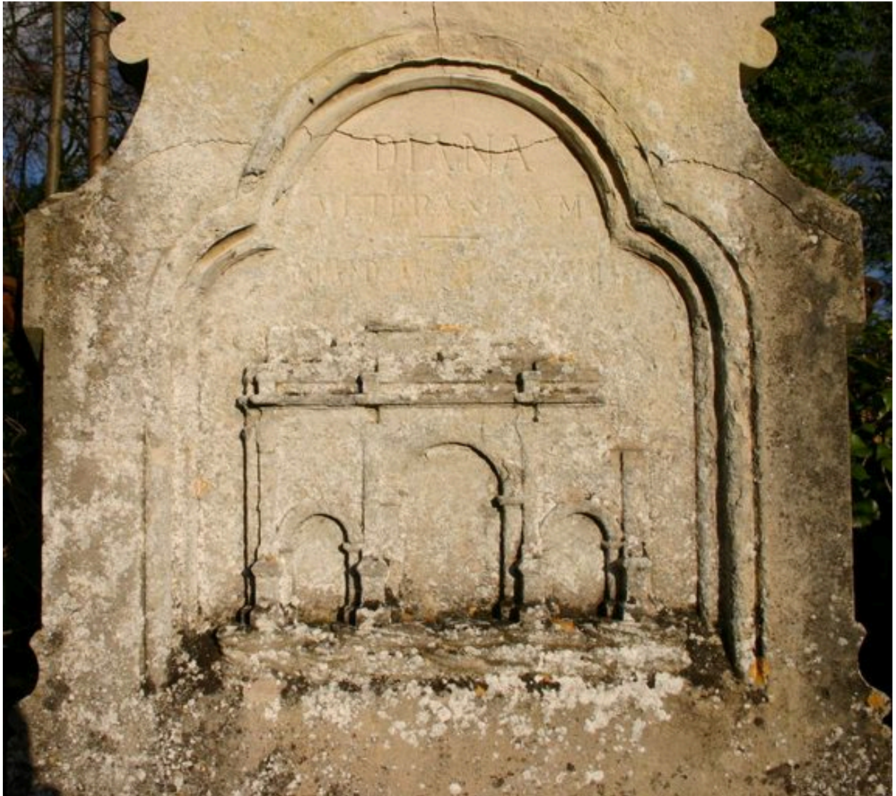
Détail du décor gravé sur la face antérieure du tombeau-monument.