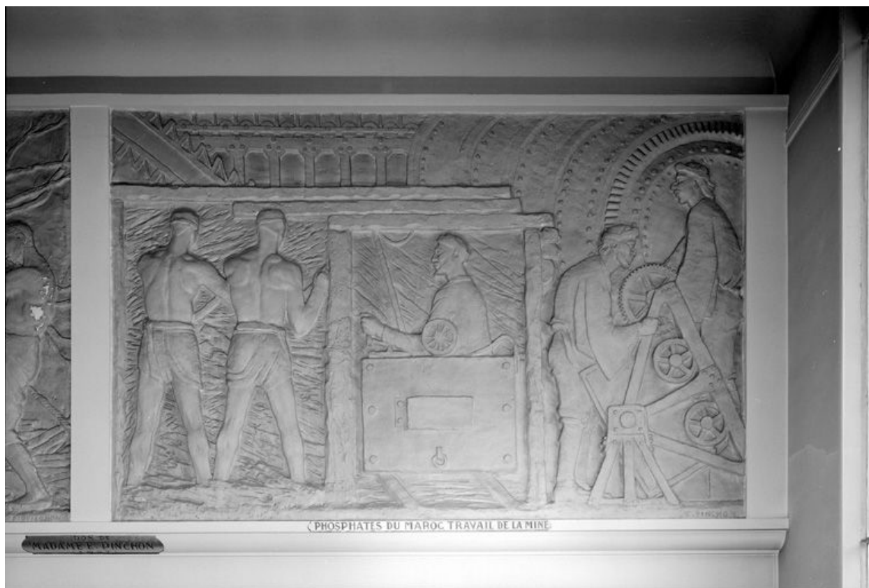
Bas-relief : Phosphates du Maroc, travail de la mine.