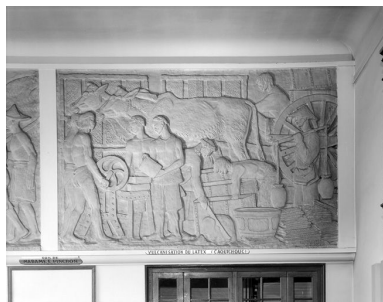
Bas-relief : Vulcanisation du Latex.