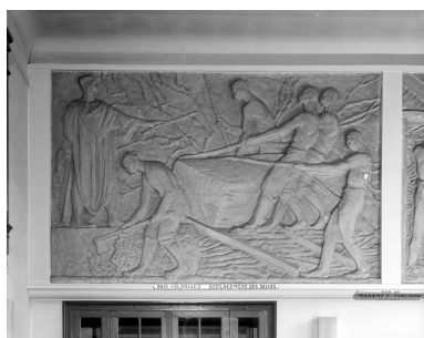
Bas-relief : Déplacement de billes. IVR22_19856001520V