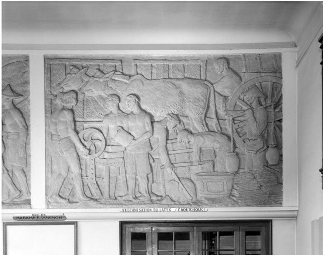
Bas-relief : Vulcanisation du Latex.