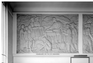
Bas-relief : Décortication du riz en Indochine. IVR22_19856001525X