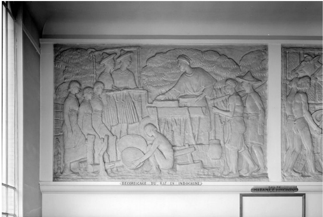
Bas-relief : Décorticage du riz en Indochine.