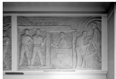
Bas-relief : Phosphates du Maroc, travail de la mine.