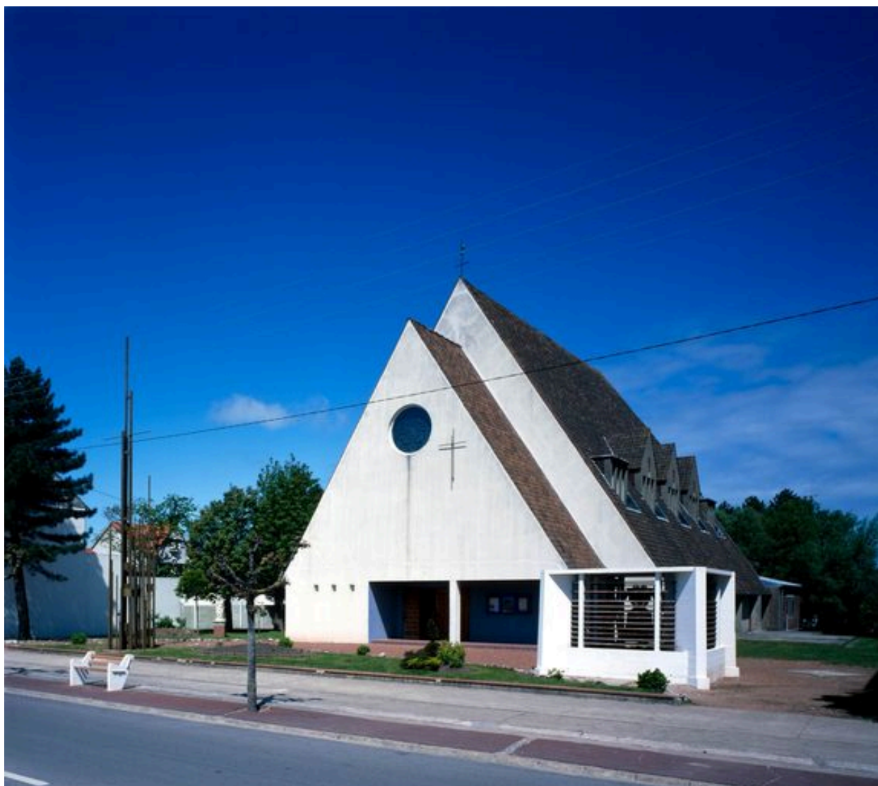
L'église paroissiale de Fort-Mahon-Plage.