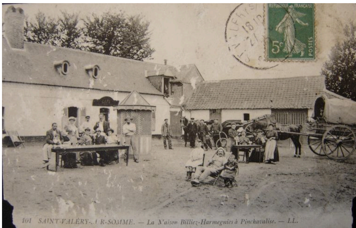
Vue de l'établissement au début du 20e siècle, carte postale, 1er quart 20e siècle (coll. part.).