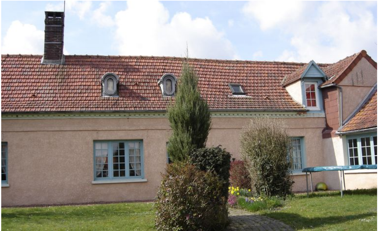
Vue actuelle du logis.