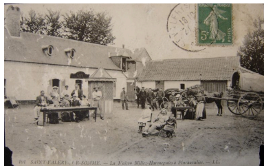
Vue de l'établissement au début du 20e siècle, carte postale, 1er quart 20e siècle (coll. part.).