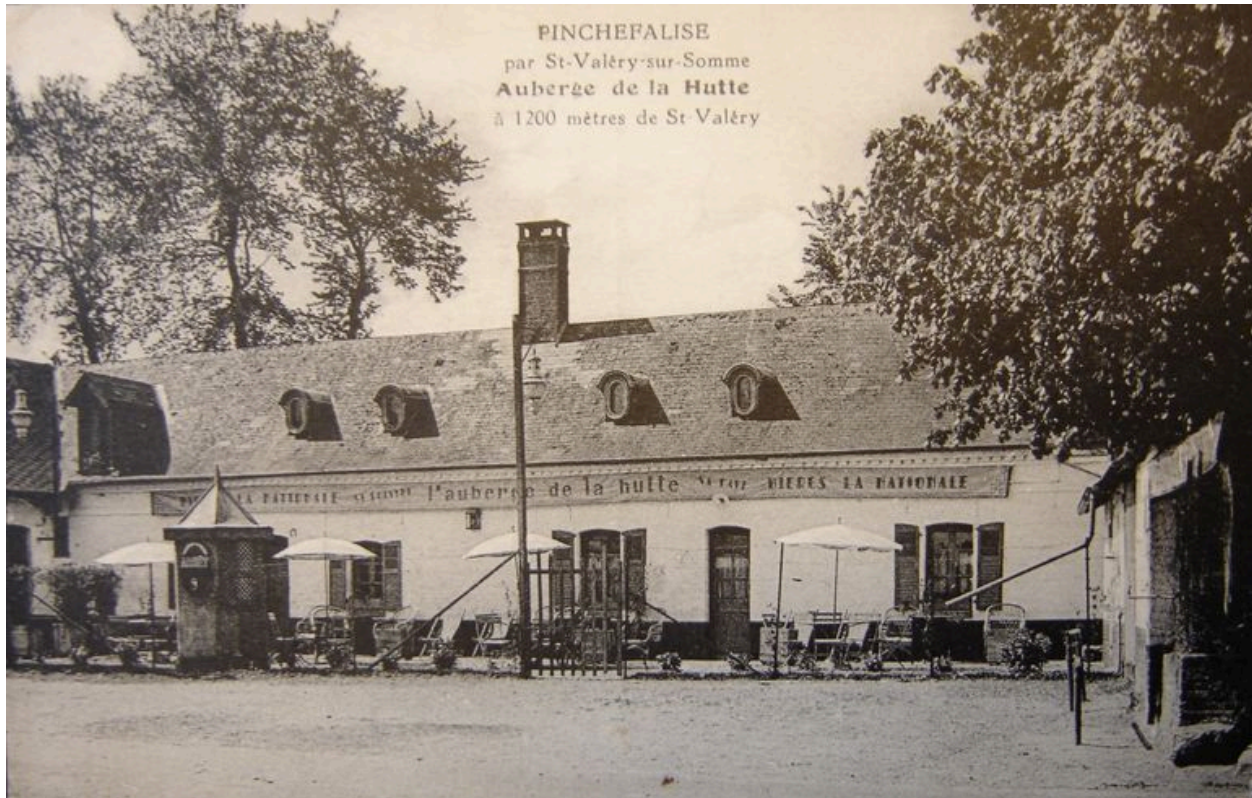
L'auberge de la Hutte, carte postale, 1ère moitié 20e siècle.