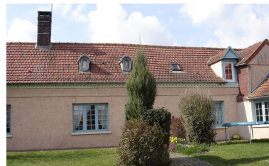
Vue actuelle du logis. IVR22_20058005660NUCA