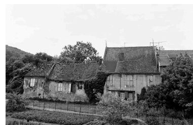
Vue générale, côté nord. IVR22_19946001192X