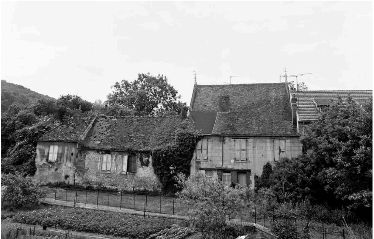
Vue générale, côté nord.