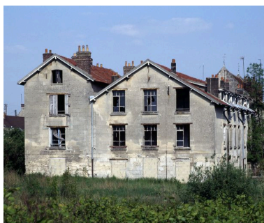
Vue générale, pignon ouest. IVR22_19936000512XA