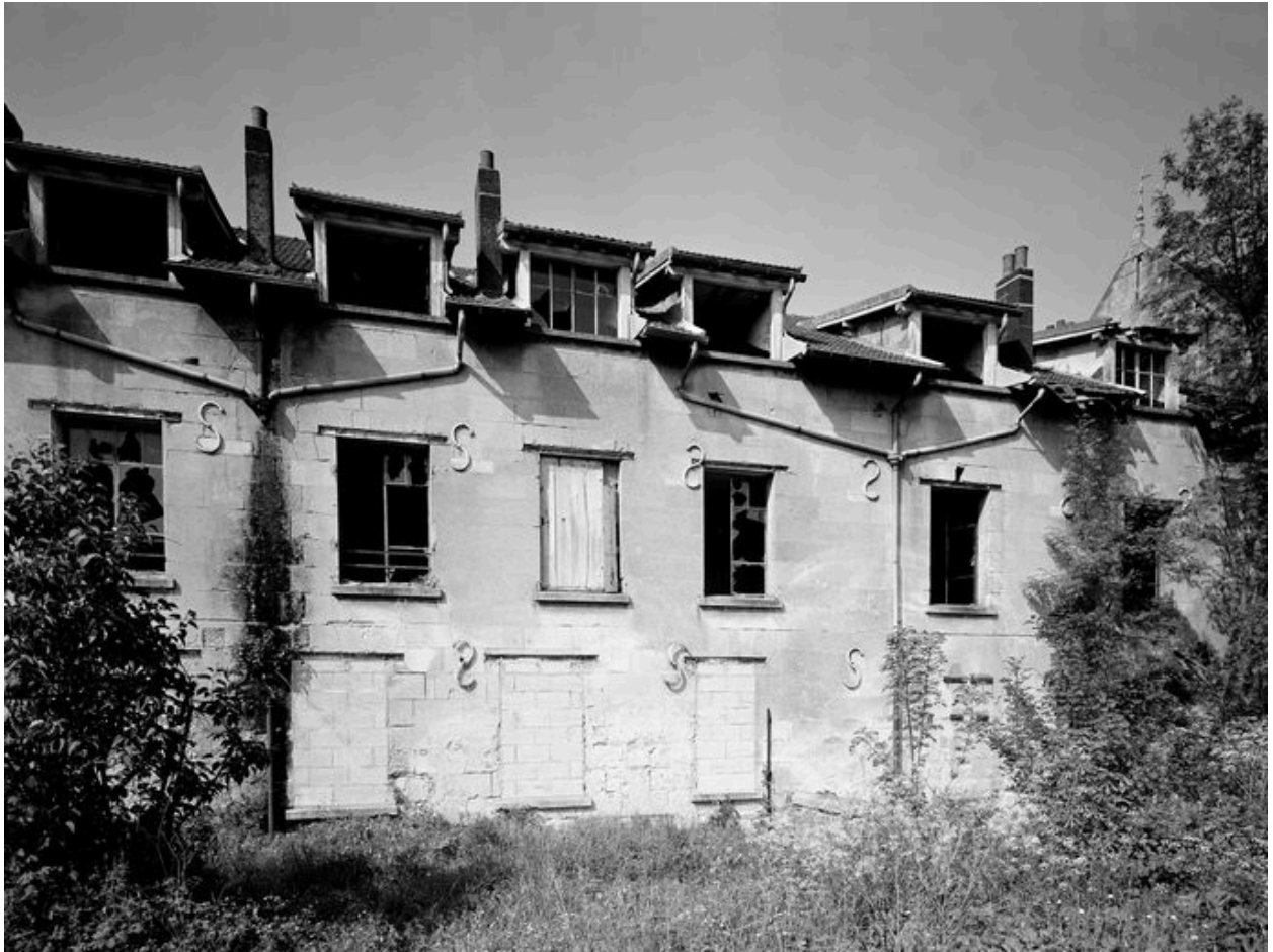
Atelier de fabrication, façade sud.