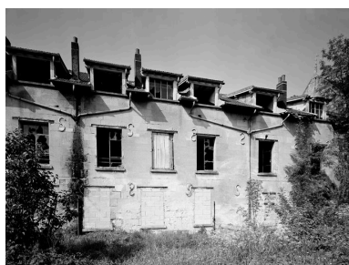
Atelier de fabrication, façade sud. IVR22_19936000708V