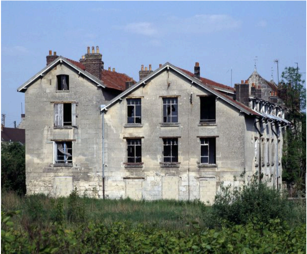
Vue générale, pignon ouest.