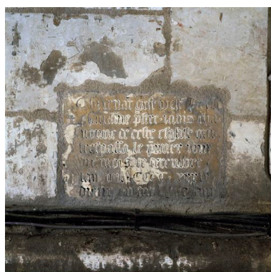
Vue générale. IVR22_20090200386XA