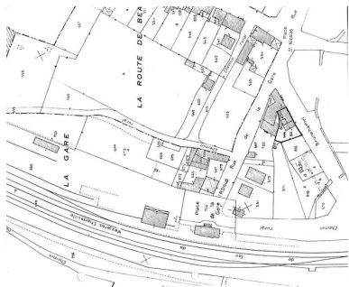
Plan de situation. Extrait du plan cadastral de 1986, section B. IVR22_20080290196NUCA