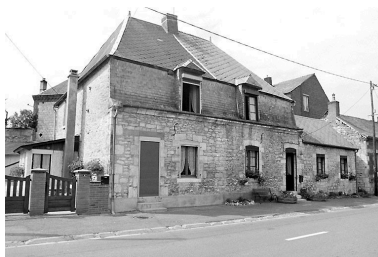
Vue générale. IVR22_19980203189Z