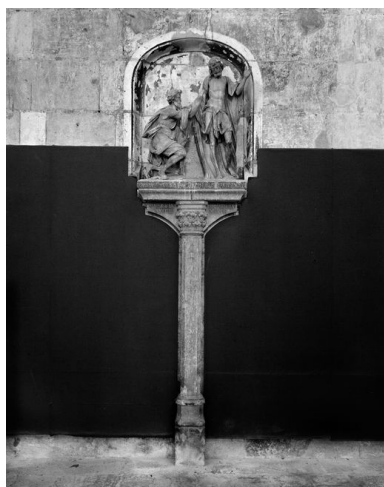
Vue de la présentation actuelle du monument.