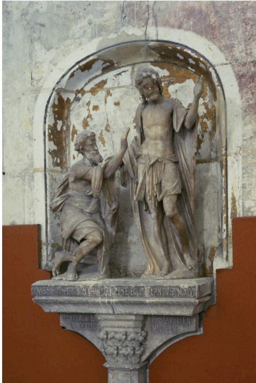
Vue de trois-quarts, depuis la droite.