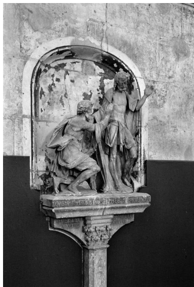
Vue de trois-quarts, depuis la gauche.