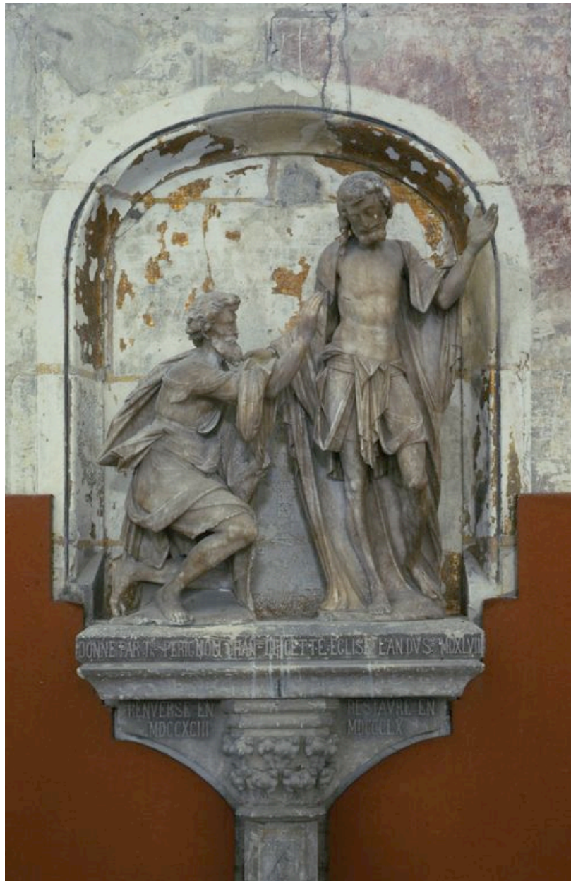
Vue générale de la partie supérieure.