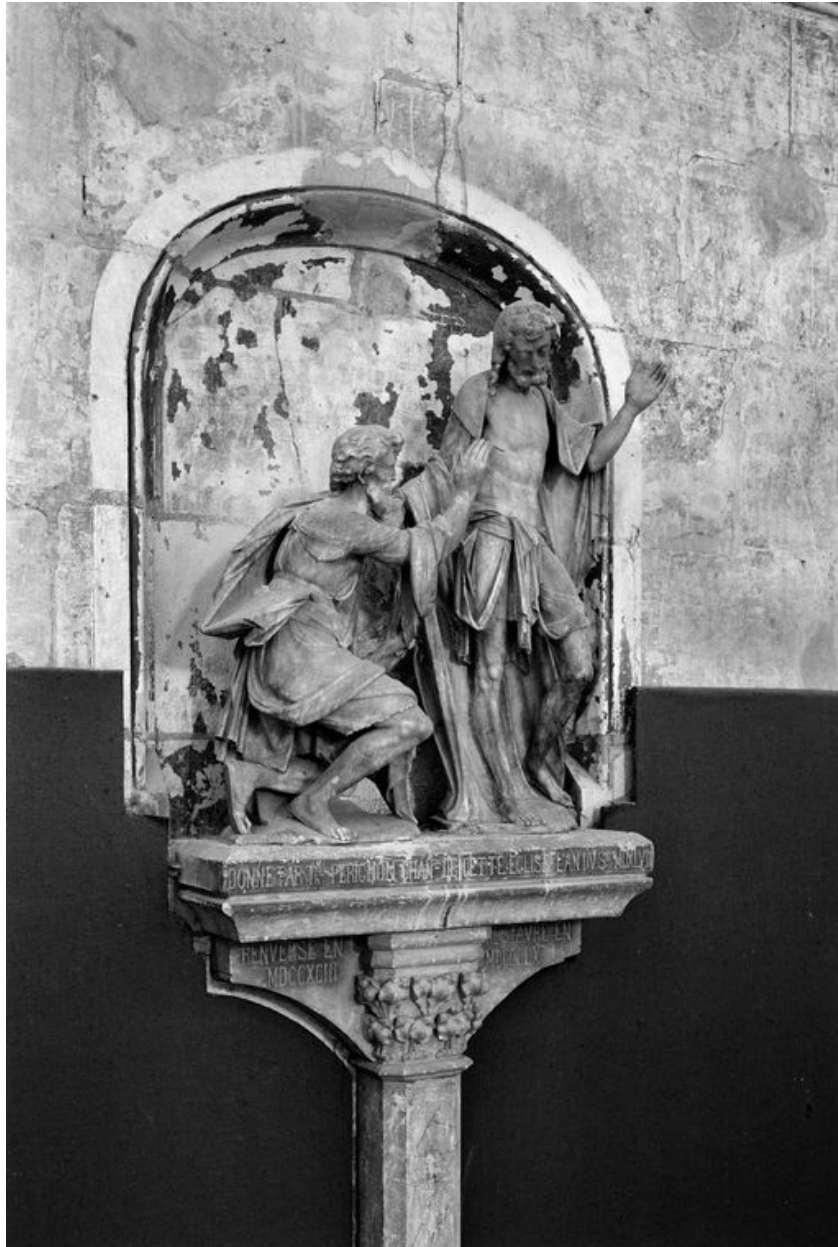
Vue de trois-quarts, depuis la gauche.