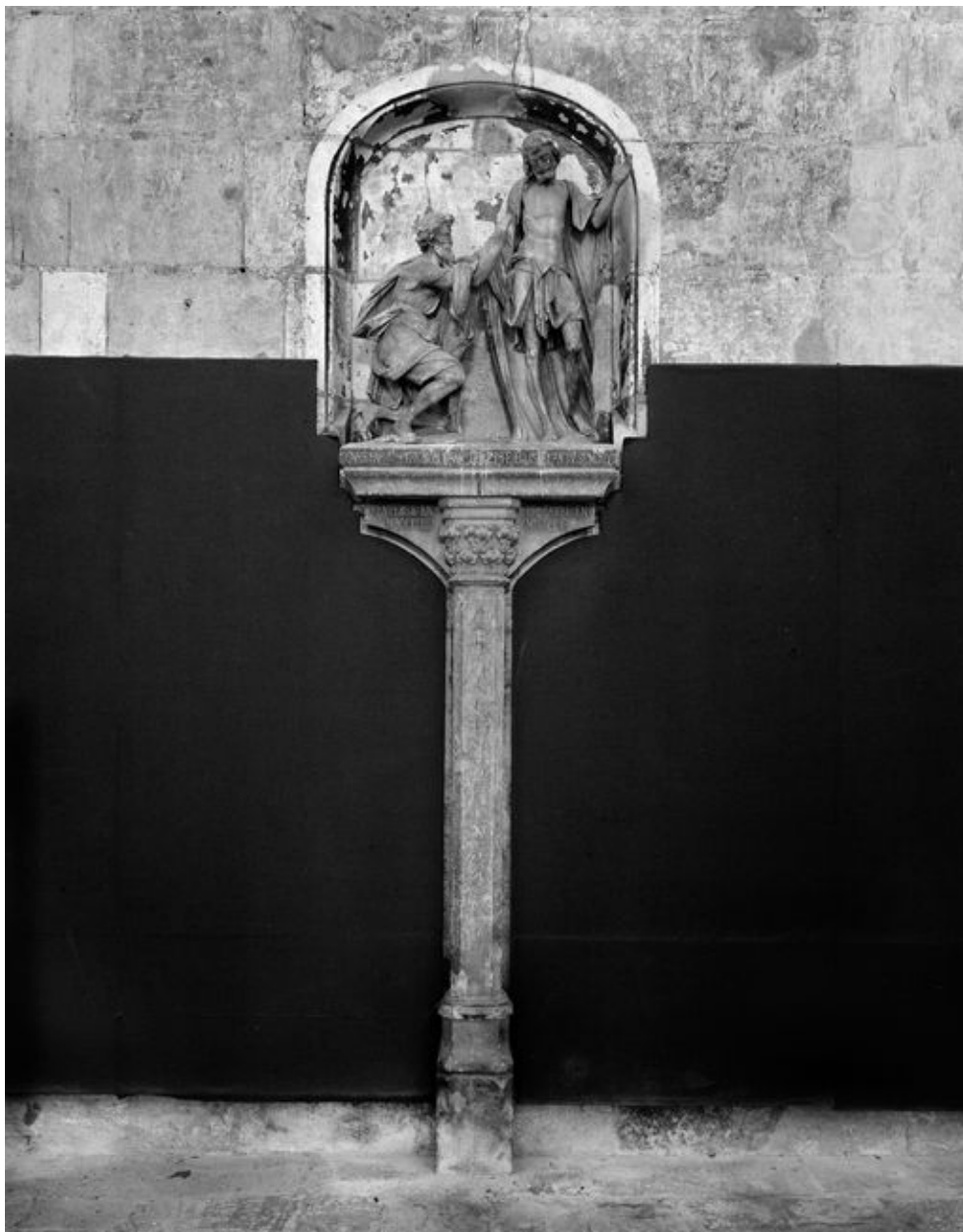
Vue de la présentation actuelle du monument.