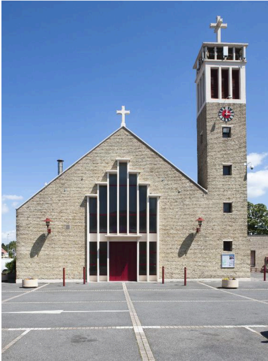
Eglise Notre-Dame-du-fort à Fort-Mardyck (Nord).