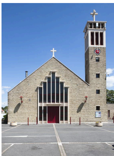
Eglise Notre-Dame-du-fort à Fort-Mardyck (Nord).