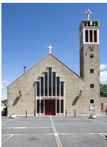
Eglise Notre-Dame-du-fort à Fort-Mardyck (Nord).