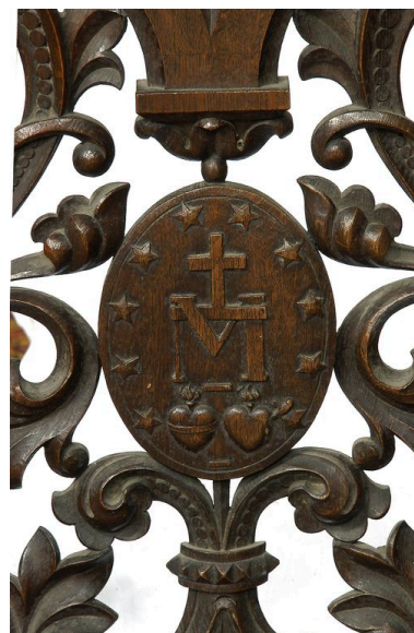
Clôture, vue du portillon. Détail du médaillon.