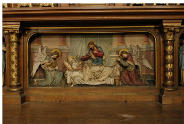
Autel, détail de l'antependium.