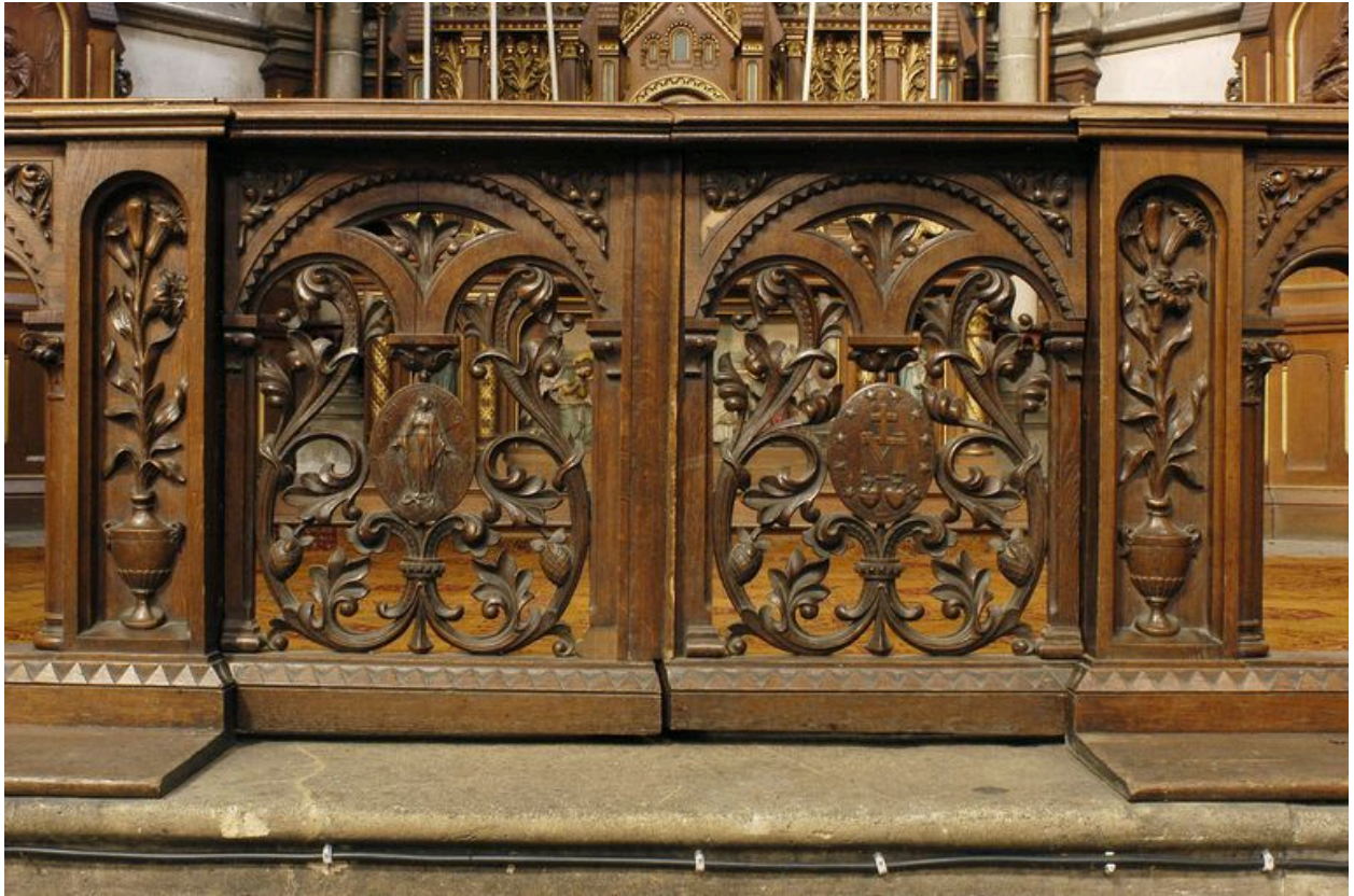
Clôture, vue du portillon.