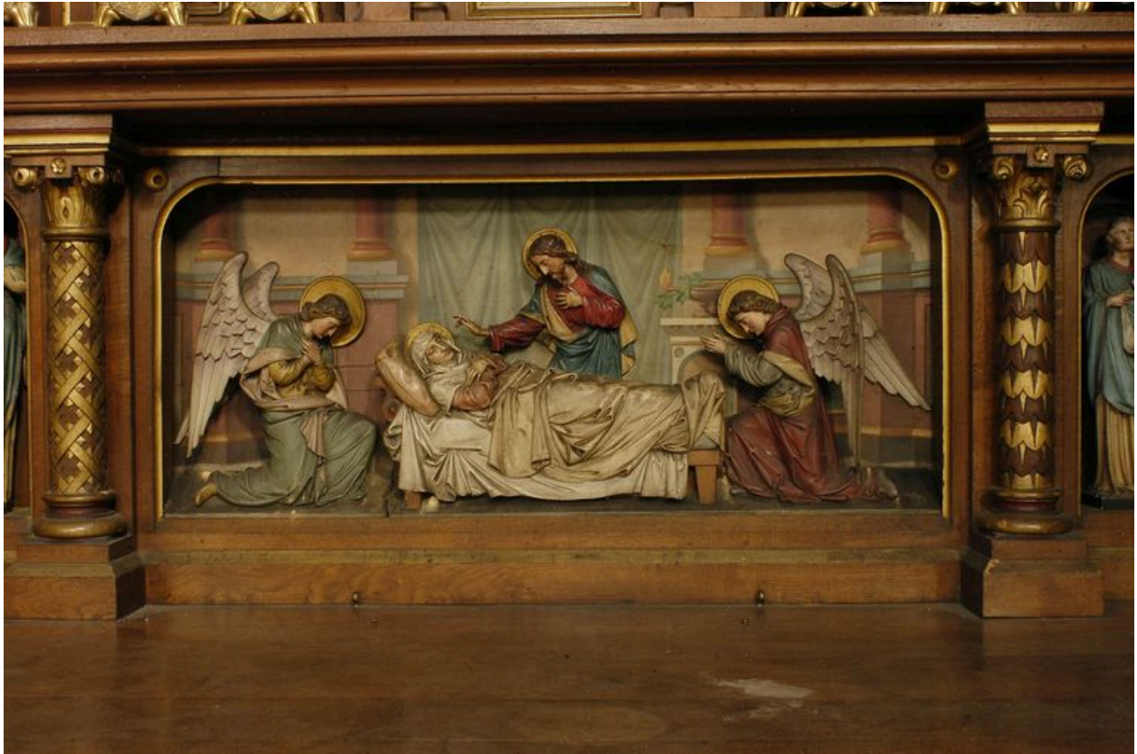
Autel, détail de l'antependium.