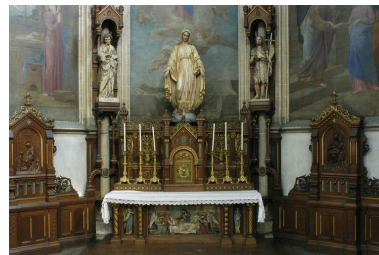
Autel.