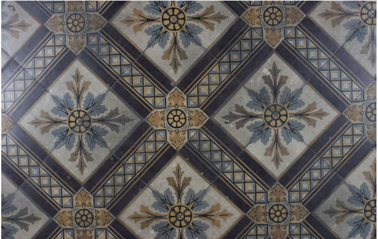
Détail du carrelage de la chapelle.