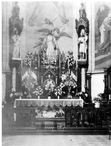
La chapelle de la Vierge au début du 20e siècle.