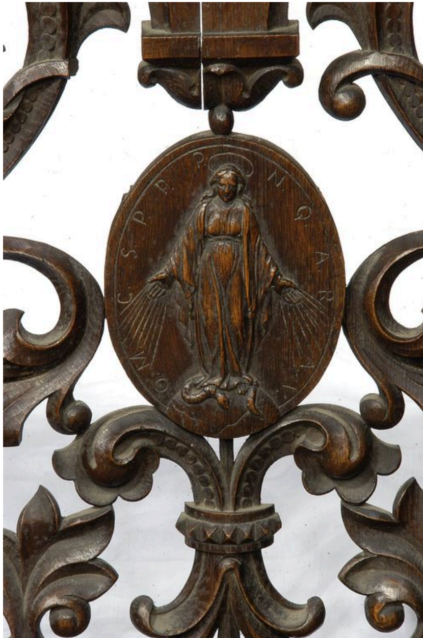
Clôture, vue du portillon. Détail du médaillon.