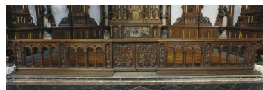
Clôture.