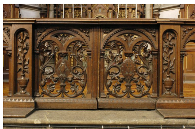
Clôture, vue du portillon.