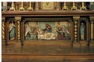
Autel, vue de l'antependium. IVR22_20058001846NUCA