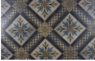
Détail du carrelage de la chapelle.