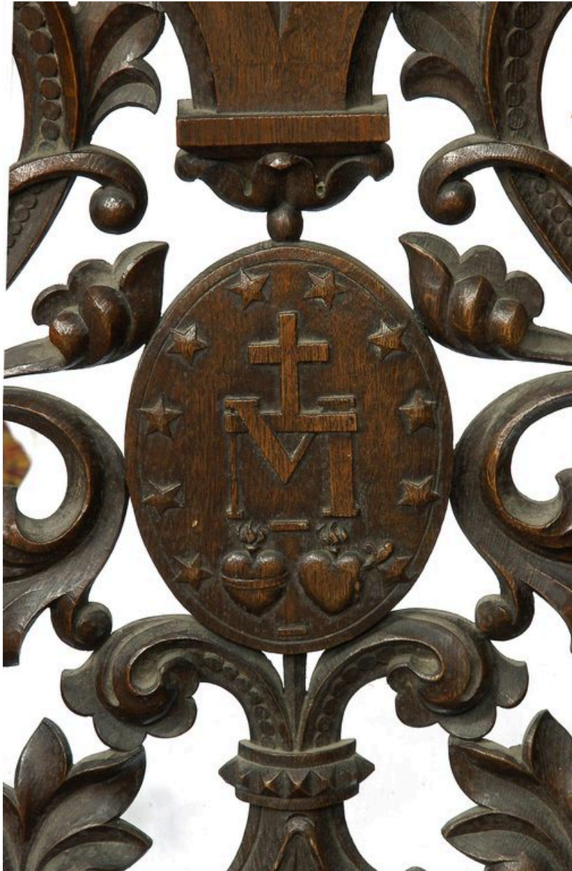
Clôture, vue du portillon. Détail du médaillon.