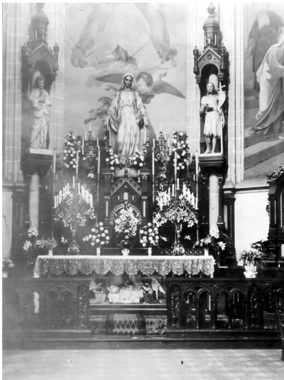
La chapelle de la Vierge au début du 20e siècle (AP Congrégation).