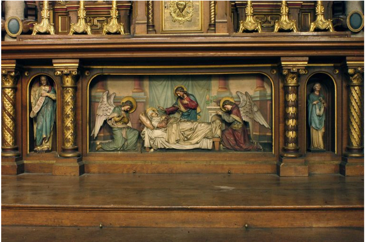
Autel, vue de l'antependium.