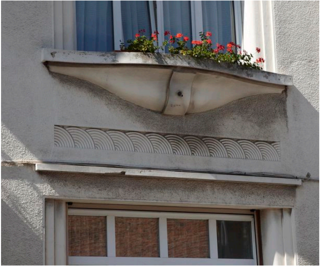
Vue sur l'allège à motifs semi-circulaires et de stries.