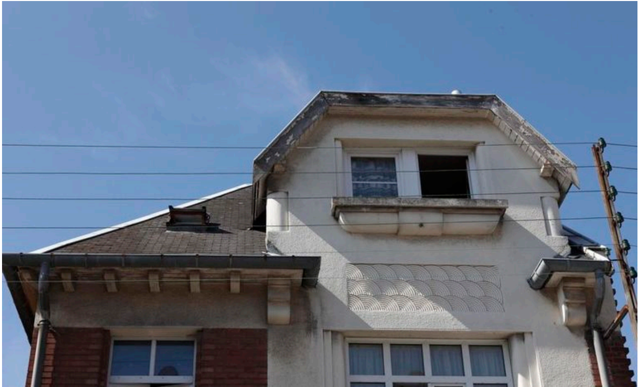
Vue sur la partie haute de la façade.