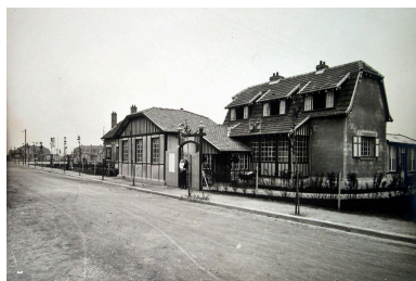
Longueau. Centre d'hygiène infantile, photographie, s. d. (C. A. M. T. 202 AQ 1189). IVR22_20048010751NUCA