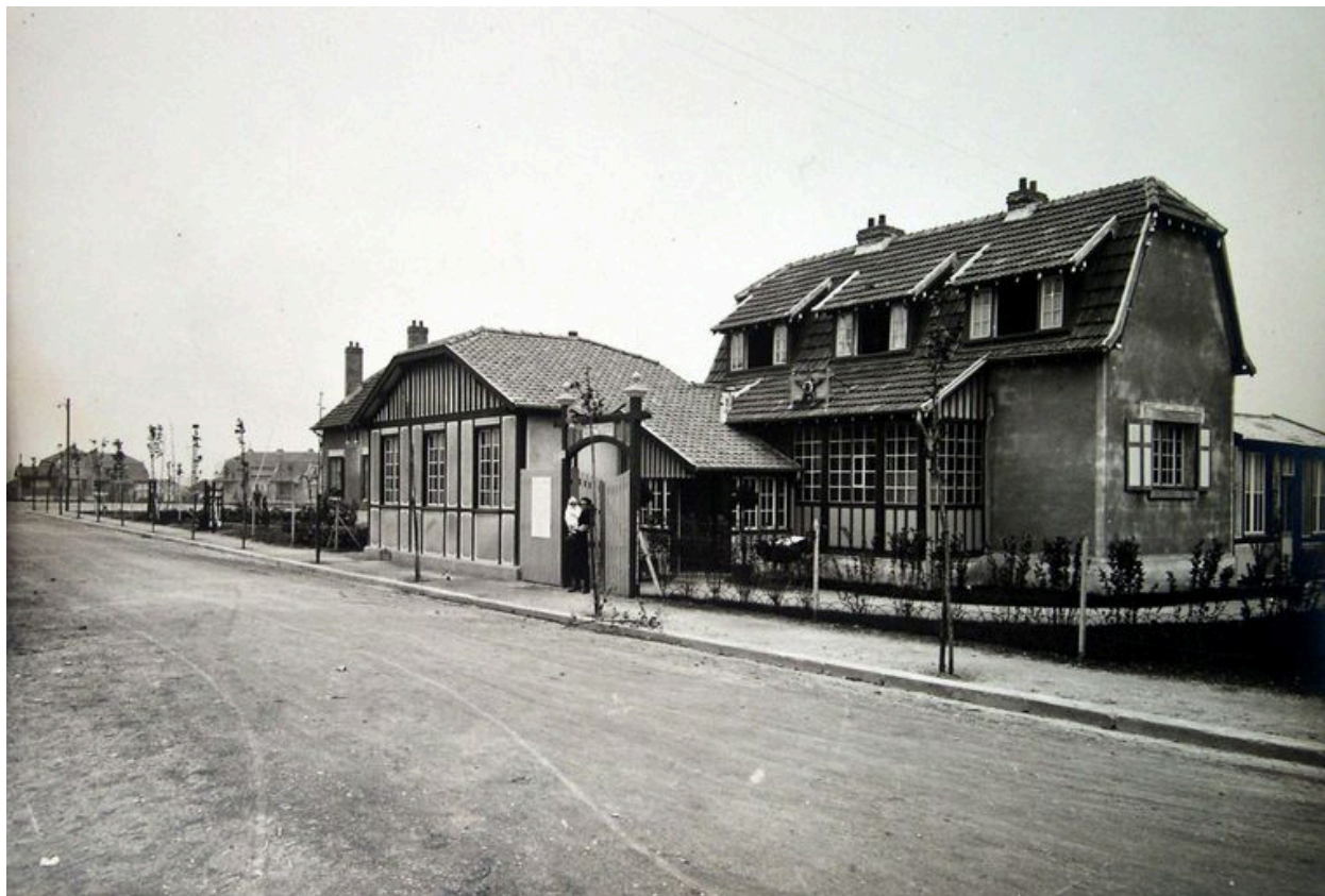
Longueau. Centre d'hygiène infantile, photographie, s. d. (C. A. M. T. ; 202 AQ 1189).