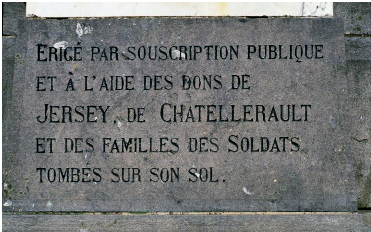
Détail de la plaque avec l'inscription.