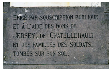
Détail de la plaque avec l'inscription.