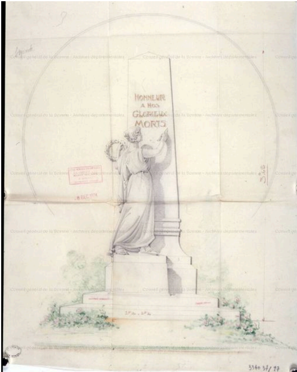
Projet de Rombaux-Roland, 1924 (AD Somme).