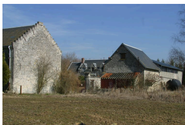
Vue générale. IVR22_20050200712NUCA