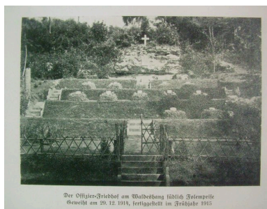
Vue du cimetière provisoire allemand sur le territoire de la ferme de Folemprise (coll. part).