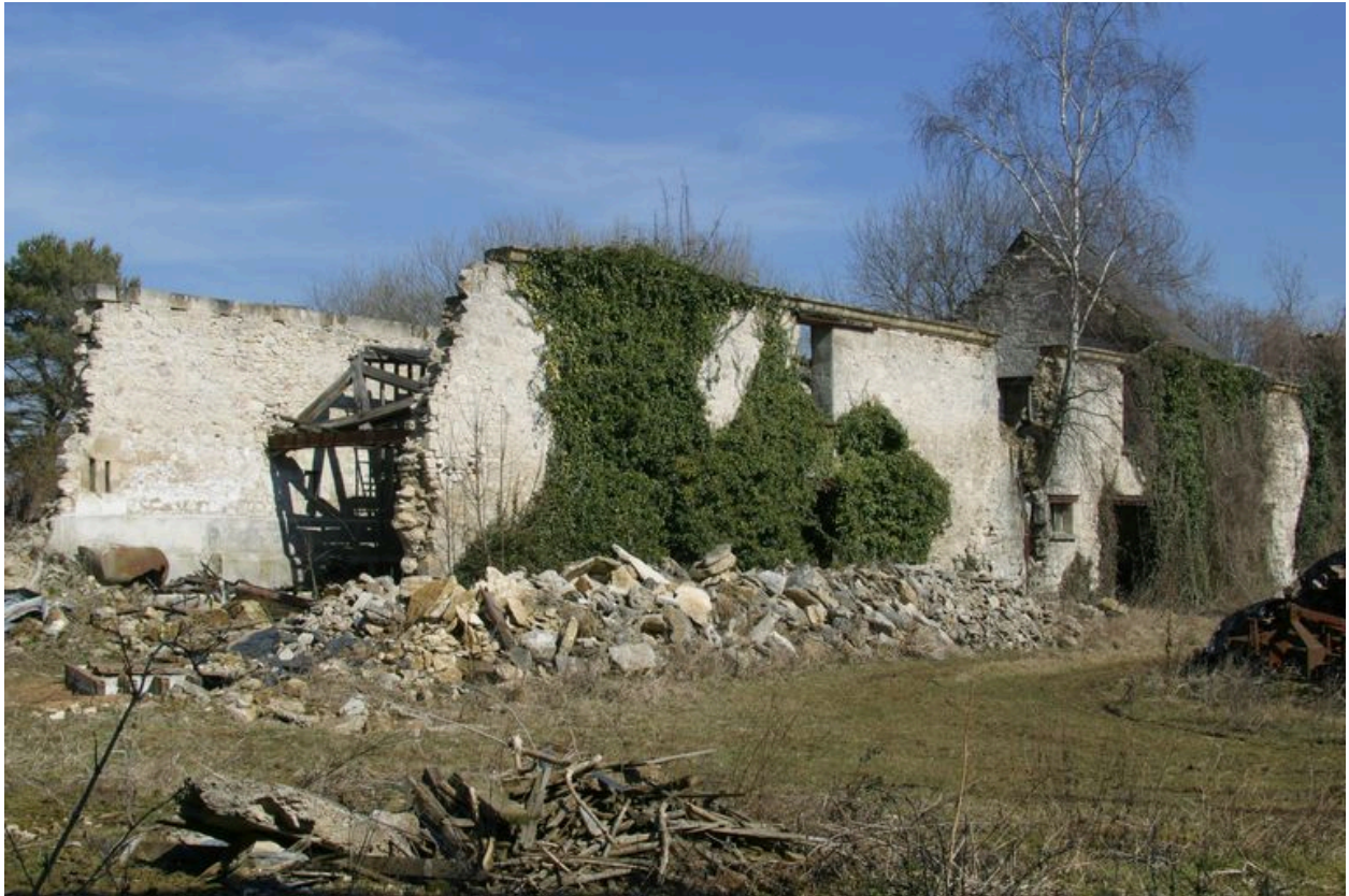
Etat actuel de la grange en ruines.