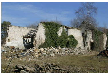
Etat actuel de la grange en ruines.