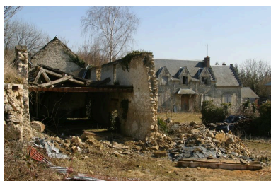
Vue des bâtiments agricoles actuellement en ruines.