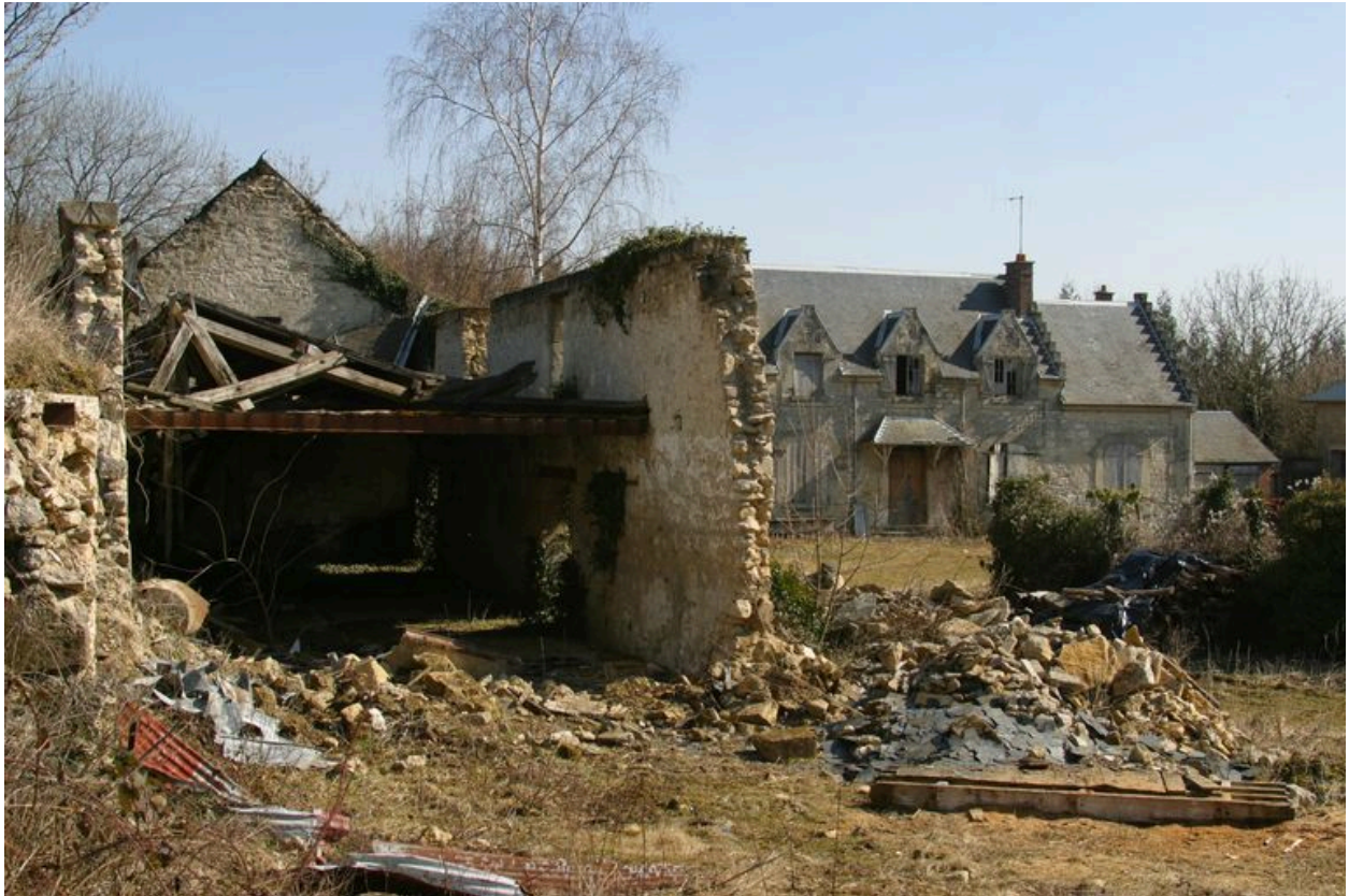
Vue des bâtiments agricoles actuellement en ruines.