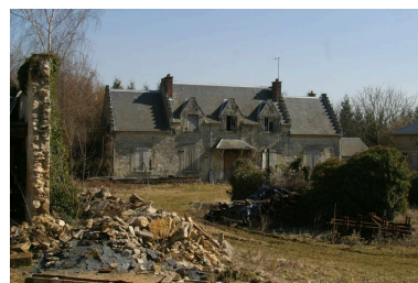
Vue du logis. IVR22_20050200713NUCA