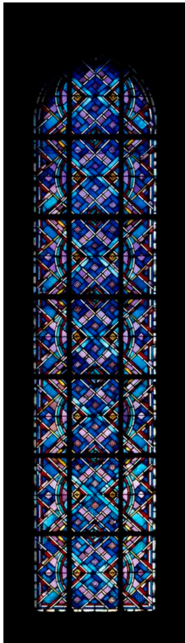
Vue générale de la verrière de la baie 4. IVR22_20090200129XA