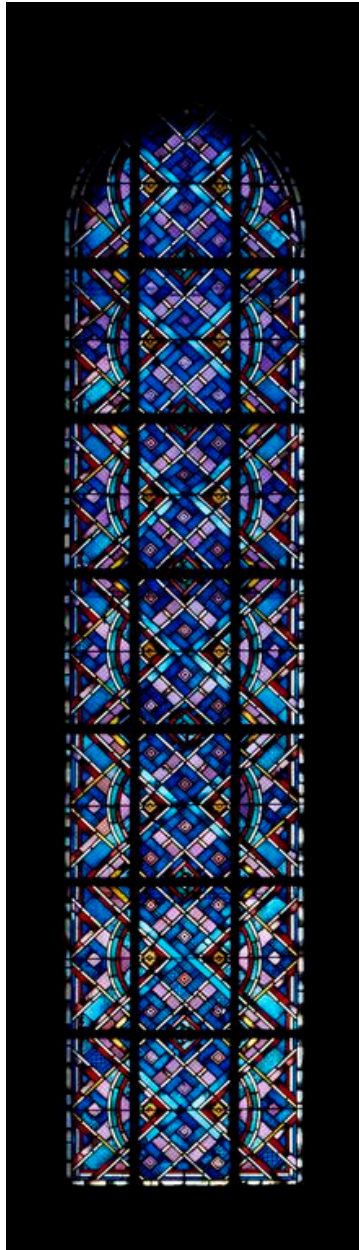
Vue générale de la verrière de la baie 4.