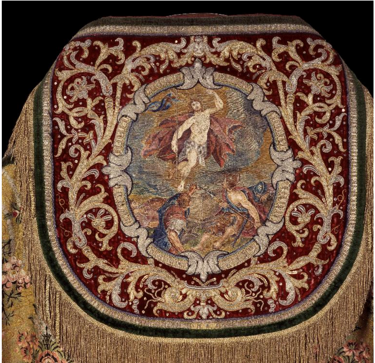
Détail du chaperon avec broderie représentant la Résurrection.