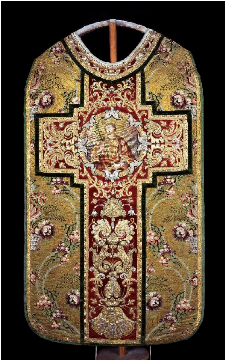
Vue du dos de la chasuble.