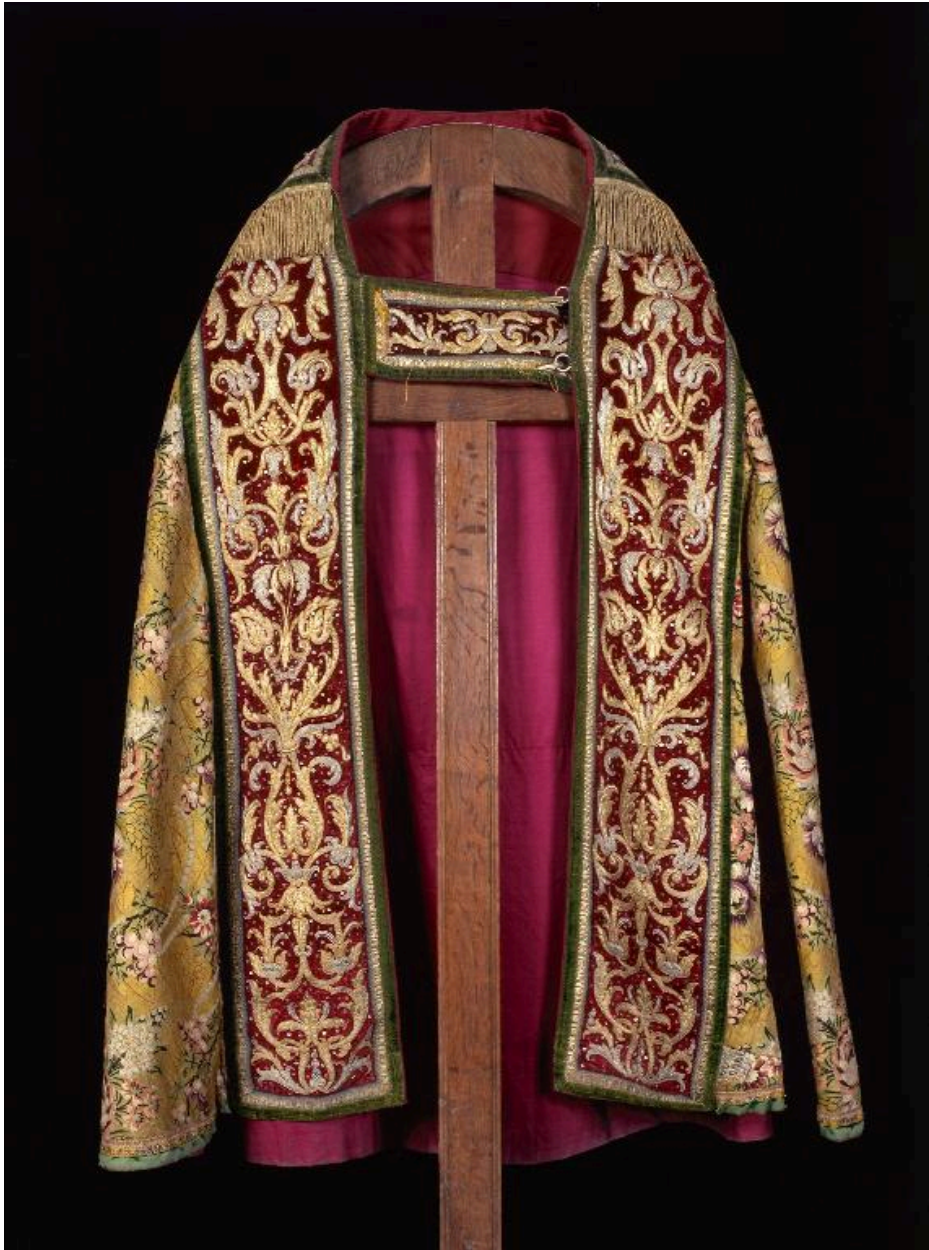
Vue du devant d'une des trois chapes.