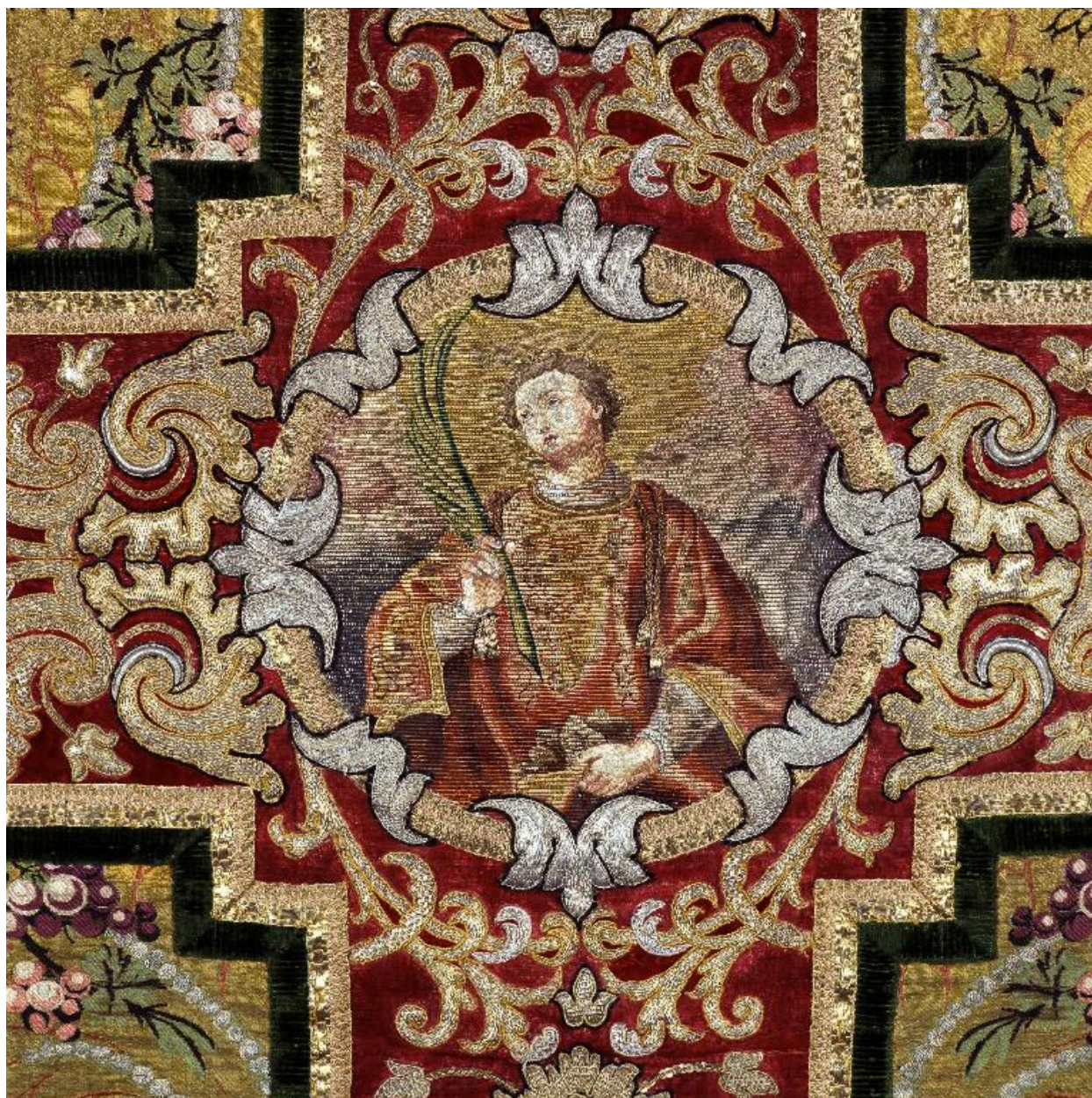
Détail du dos de la chasuble : saint Etienne dans un médaillon.