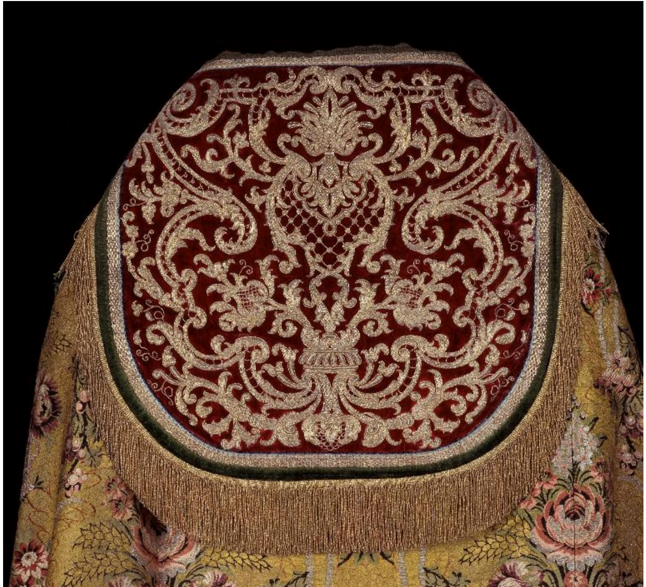
Détail du chaperon à rinceaux.