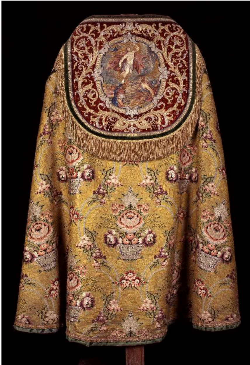
Vue du dos de la chape avec le chaperon illustrant la Résurrection.