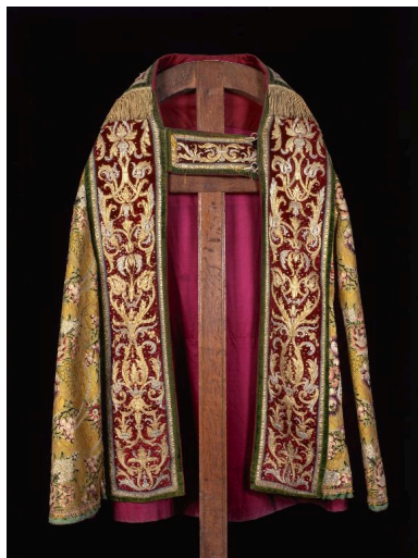
Vue du devant d'une des trois chapes.