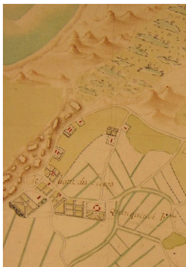
Extrait d'une carte du 18e siècle présentant la physionomie du hameau .