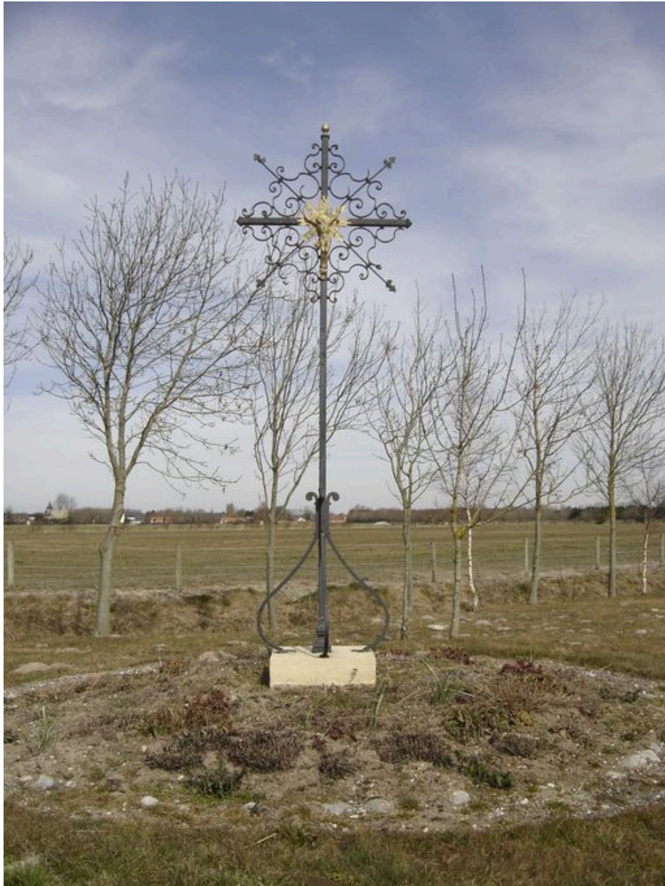
Vue générale du calvaire du hameau.