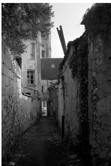
Ruelle Boyot, en face de l'église Saint-Crépin ; vue à partir du fond. IVR22_19950203249X