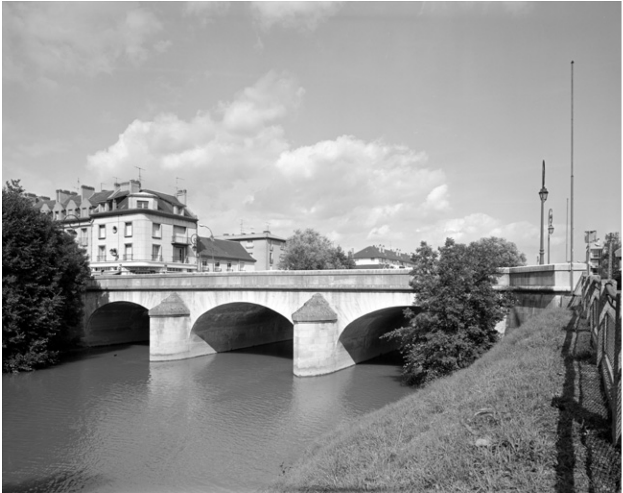
Le pont sur la fausse Marne, vu de côté.