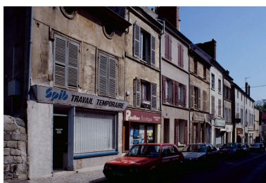
Rive nord de la rue Saint-Crépin.