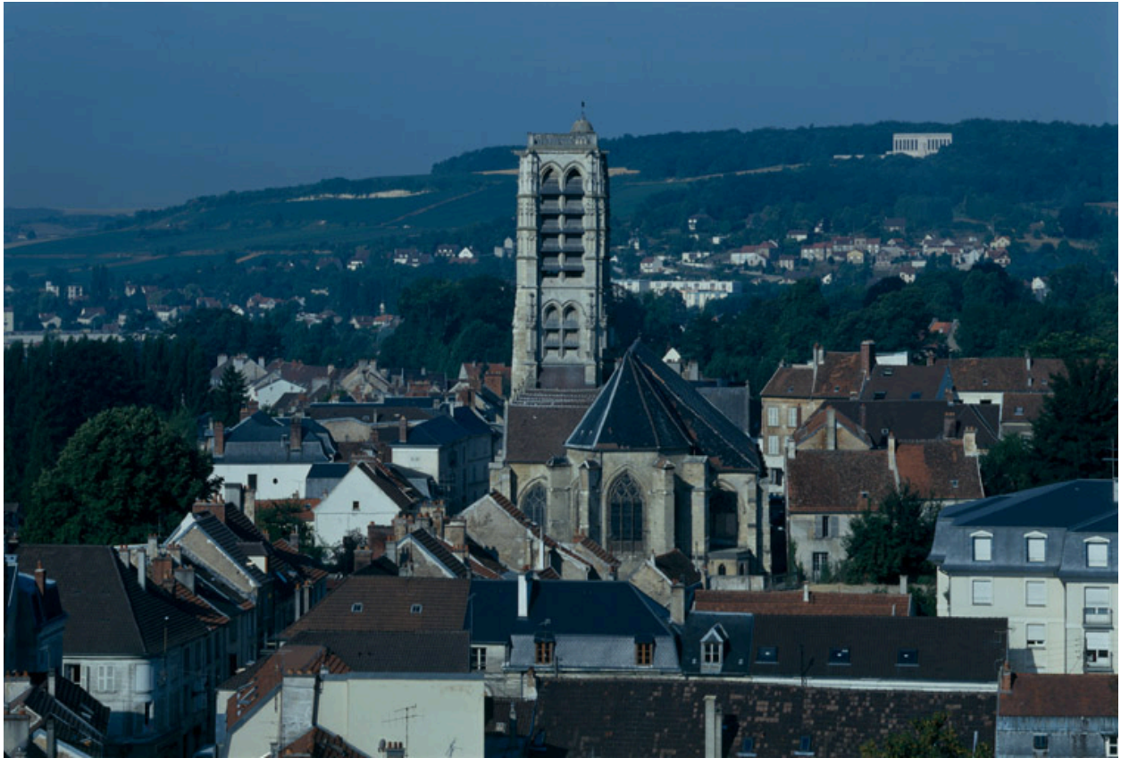
Vue générale du quartier de l'église Saint-Crépin avec le clocher ; vue depuis la plateforme du château.