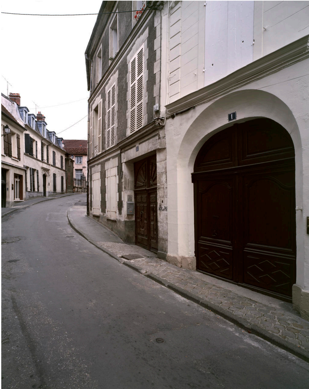
Rue Jean-de-La Fontaine.