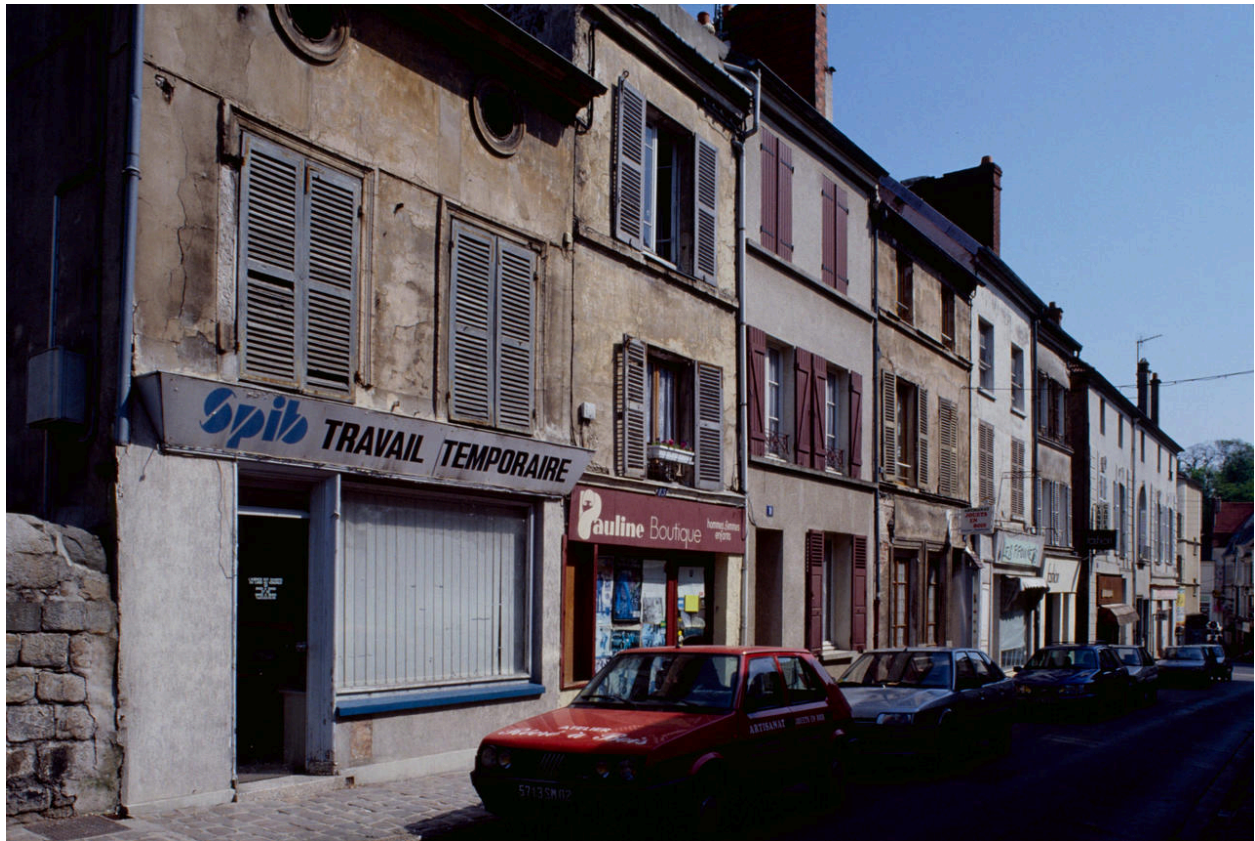
Rive nord de la rue Saint-Crépin.