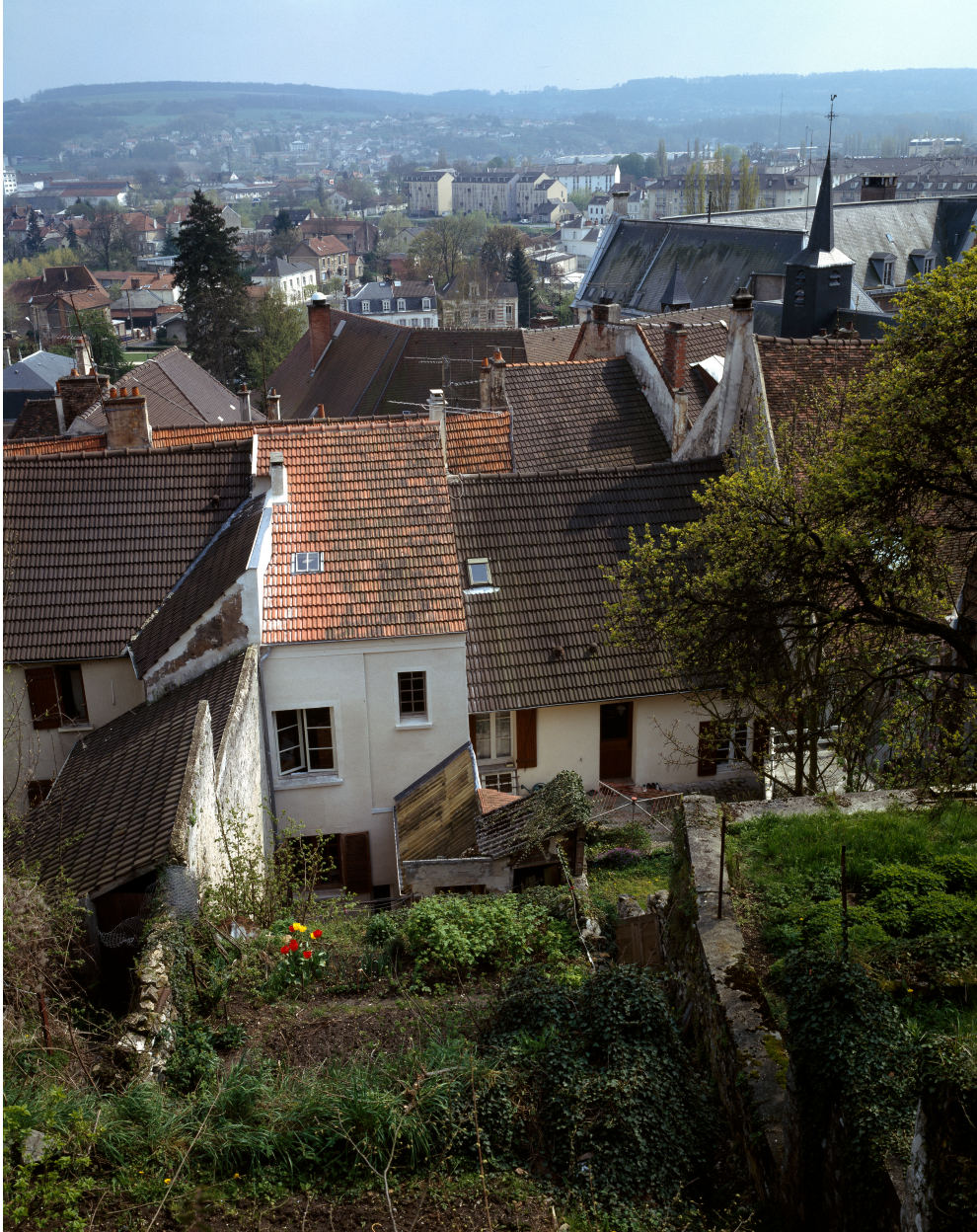
La face arrière d'une des maisons de la rue du château depuis le jardin en terrasse, avec la vue de la ville vers le sud.