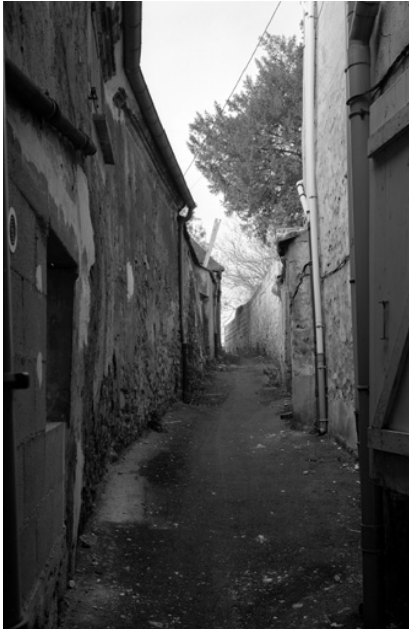
Ruelle Boyot, en face de l'église Saint-Crépin ; vue prise à son départ.