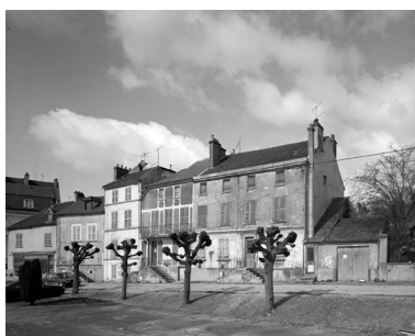
Maisons sur le côté nord de l'avenue Joussaume-Latour.