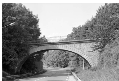
Pont au-dessus de l'ancienne ligne de chemin de fer vers La Ferté Milon (actuelle rocade). IVR22_19950200389X