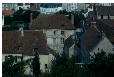
Les maisons de la rue Jean de La Fontaine depuis la plateforme du château.