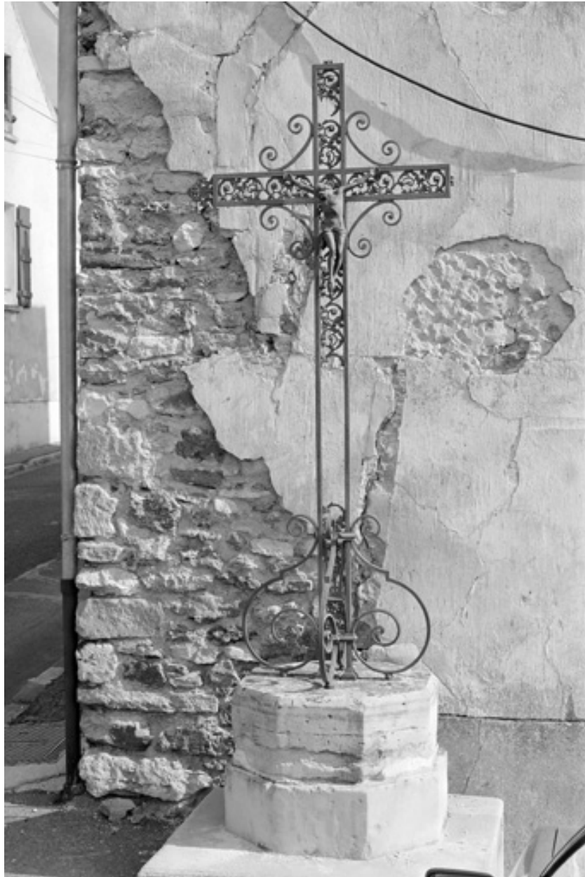
Croix de chemin, à l'angle de la rue Pasteur et de la rue Charles-Martel.