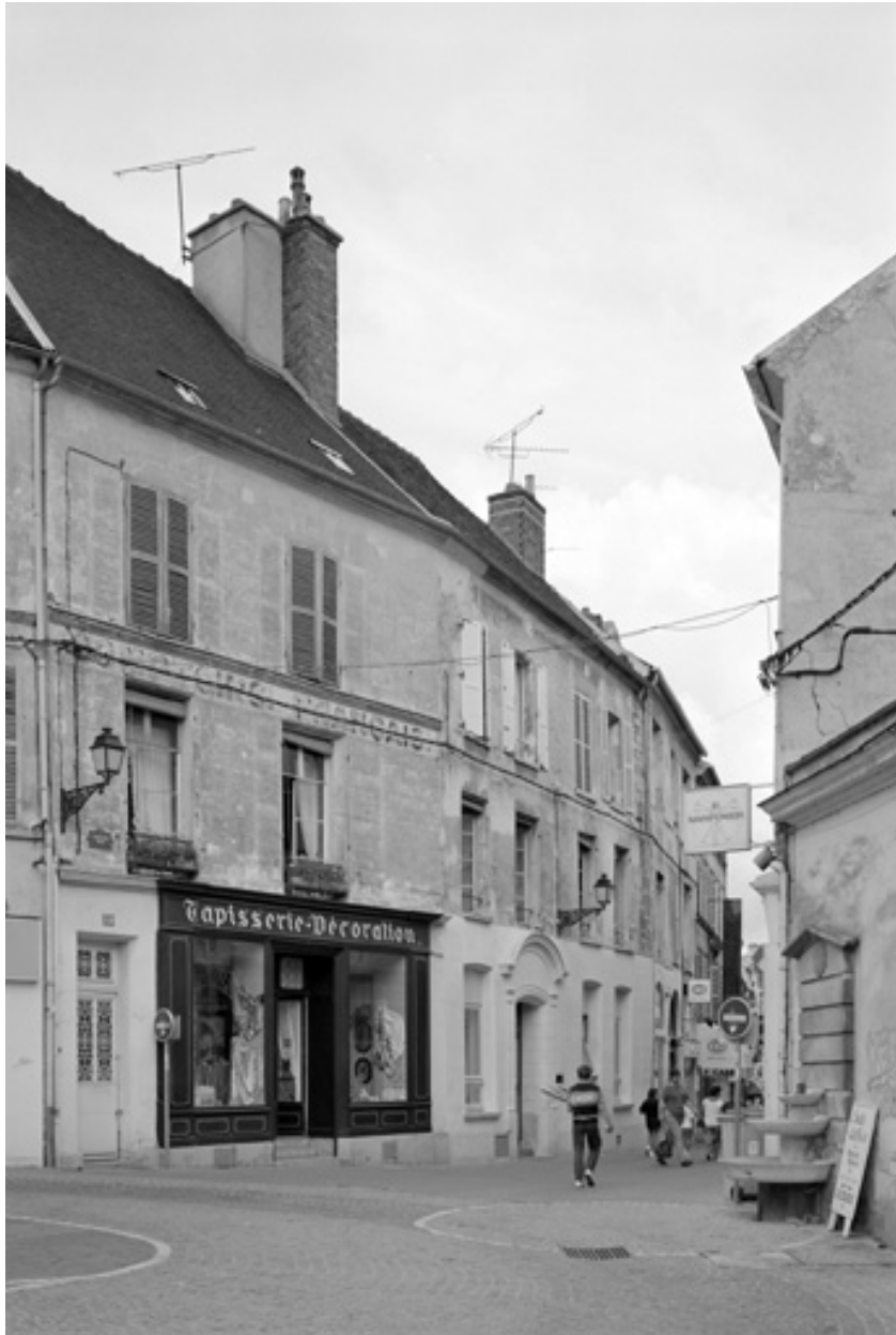
La Grande Rue, au niveau du carrefour avec la rue La Fontaine.