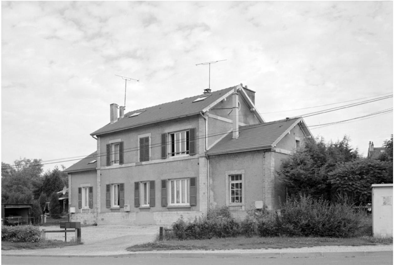
Ancienne gare de la ligne de Château-Thierry à La Ferté-Milon, actuellement maison d'habitation rue Léon-Lhermitte.