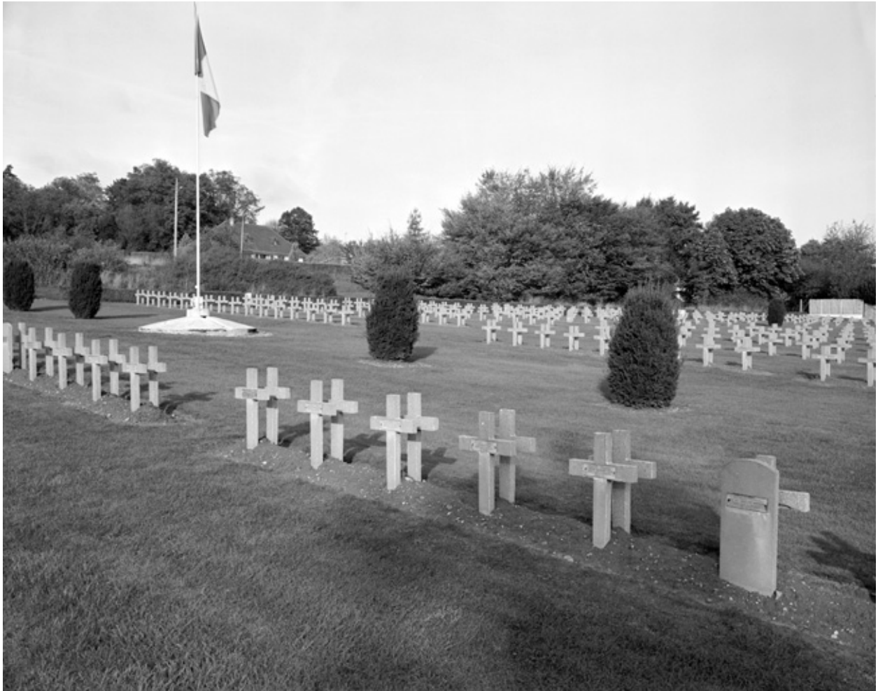
Le cimetière franco-anglais.