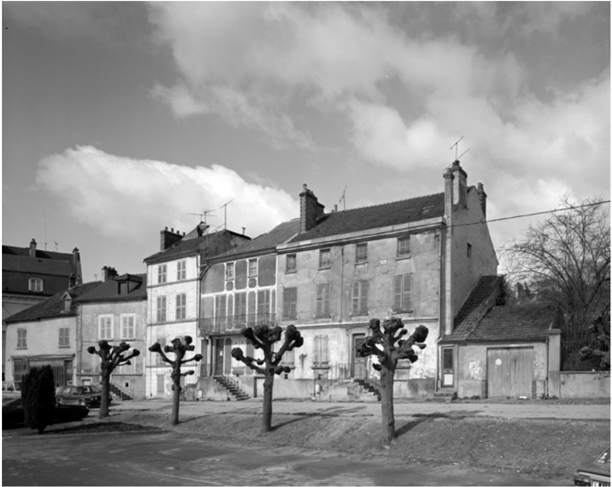
Maisons sur le côté nord de l'avenue Jousaume-Latour.