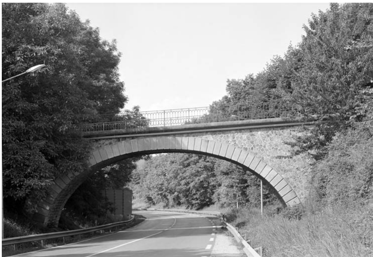
Pont au-dessus de l'ancienne ligne de chemin de fer vers La Ferté Milon (actuelle rocade).