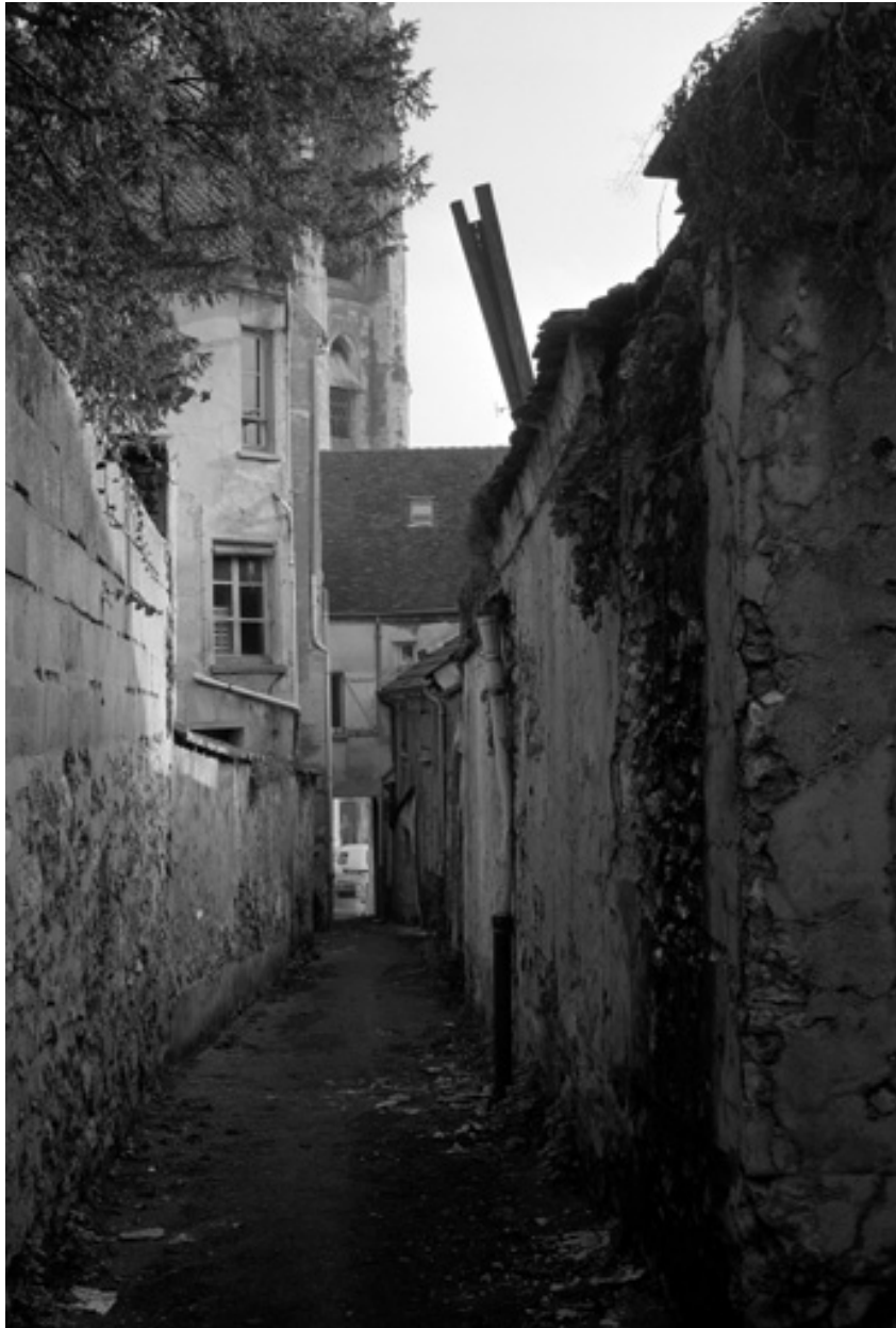
Ruelle Boyot, en face de l'église Saint-Crépin ; vue à partir du fond.