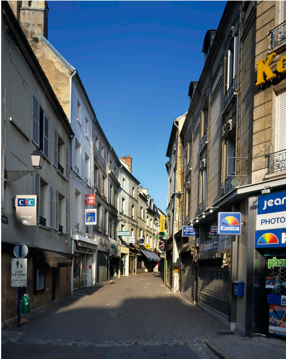
La Grande rue.