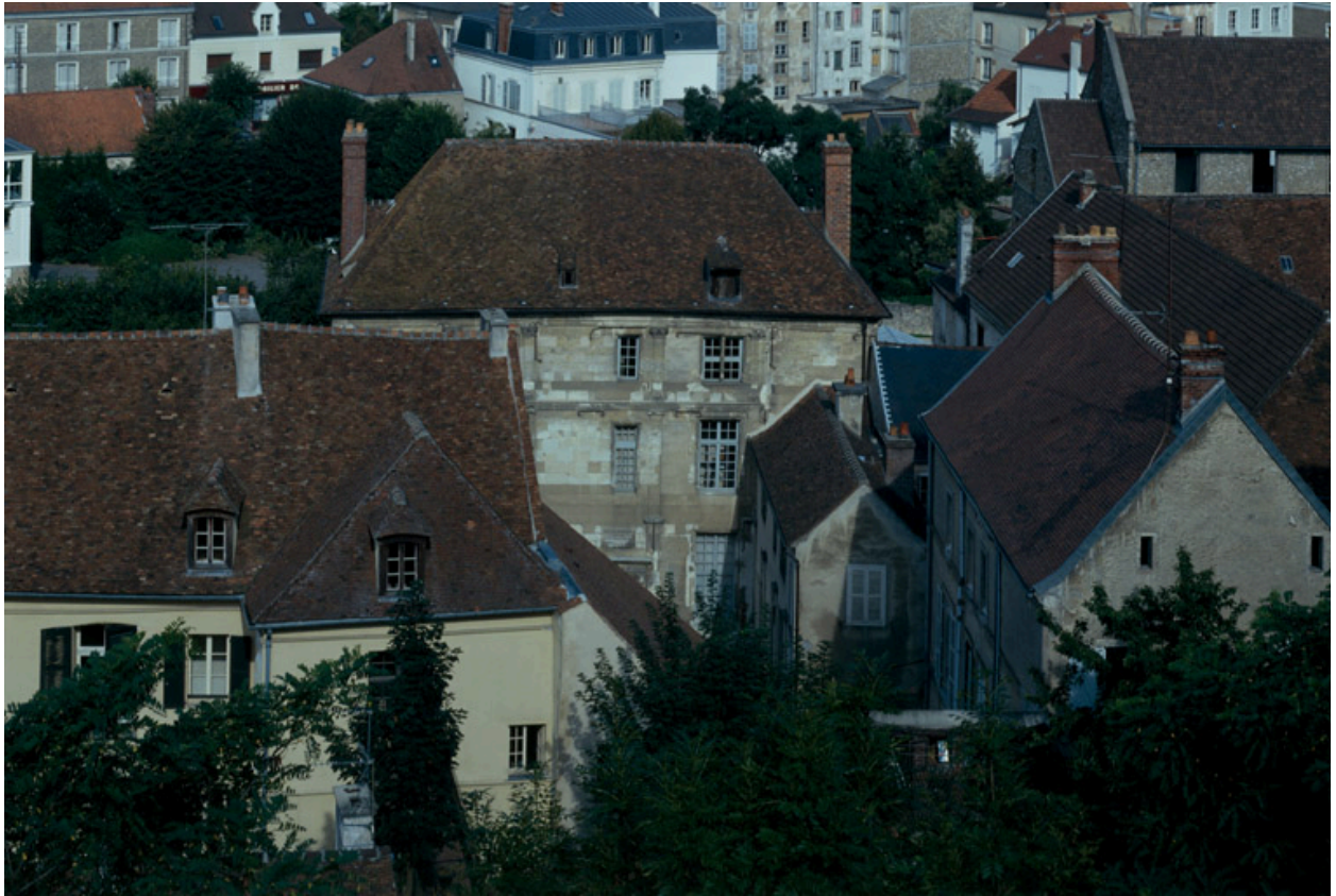
Les maisons de la rue Jean de La Fontaine depuis la plateforme du château.