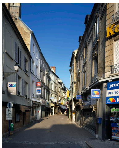
La Grande rue.