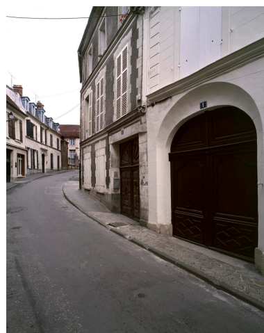
Rue Jean-de-La Fontaine.