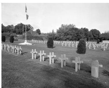
Le cimetière franco-anglais.