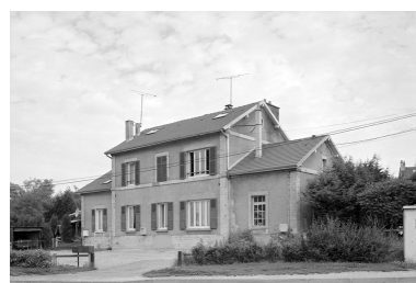
Ancienne gare de la ligne de Château-Thierry à La Ferté- Milon, actuellement maison d'habitation rue Léon-Lhermitte.