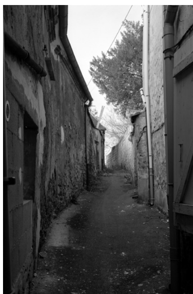
Ruelle Boyot, en face de l'église Saint-Crépin ; vue prise à son départ. IVR22_19950203247X