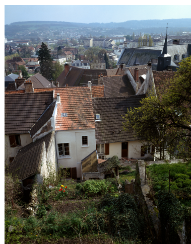
La face arrière d'une des maisons de la rue du château depuis le jardin en terrasse, avec la vue de la ville vers le sud. IVR22_19940200337VA