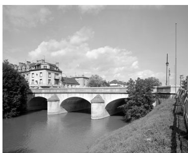
Le pont sur la fausse Marne, vu de côté.