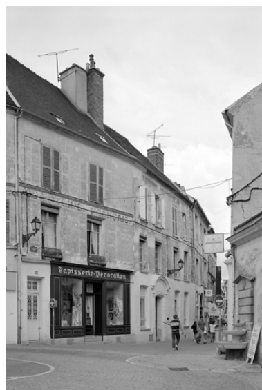
La Grande Rue, au niveau du carrefour avec la rue La Fontaine.