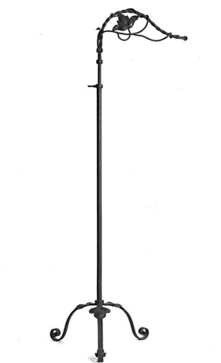
Vue générale. IVR22_19990205403X