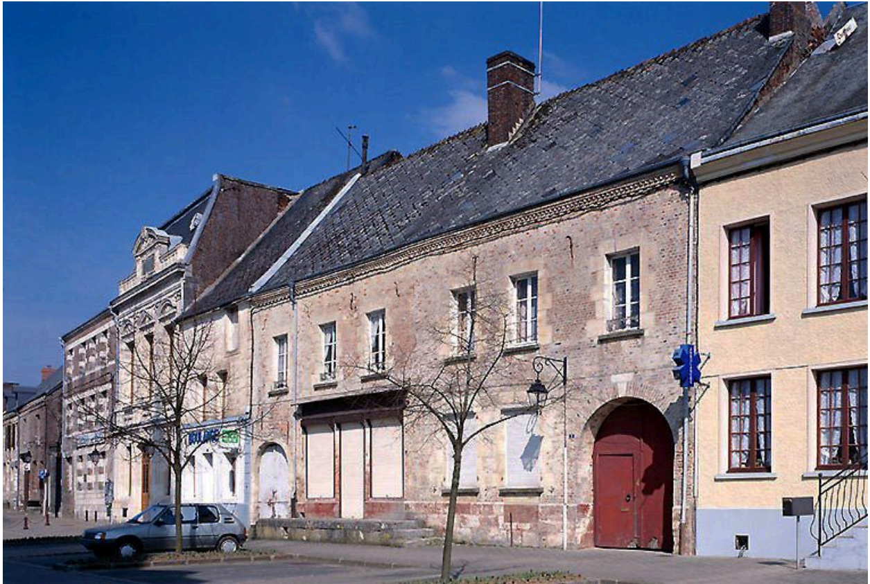
Vue depuis le sud-est.