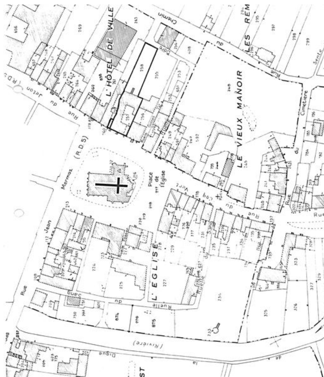
Plan de situation. Extrait du plan cadastral de 1986, section B.