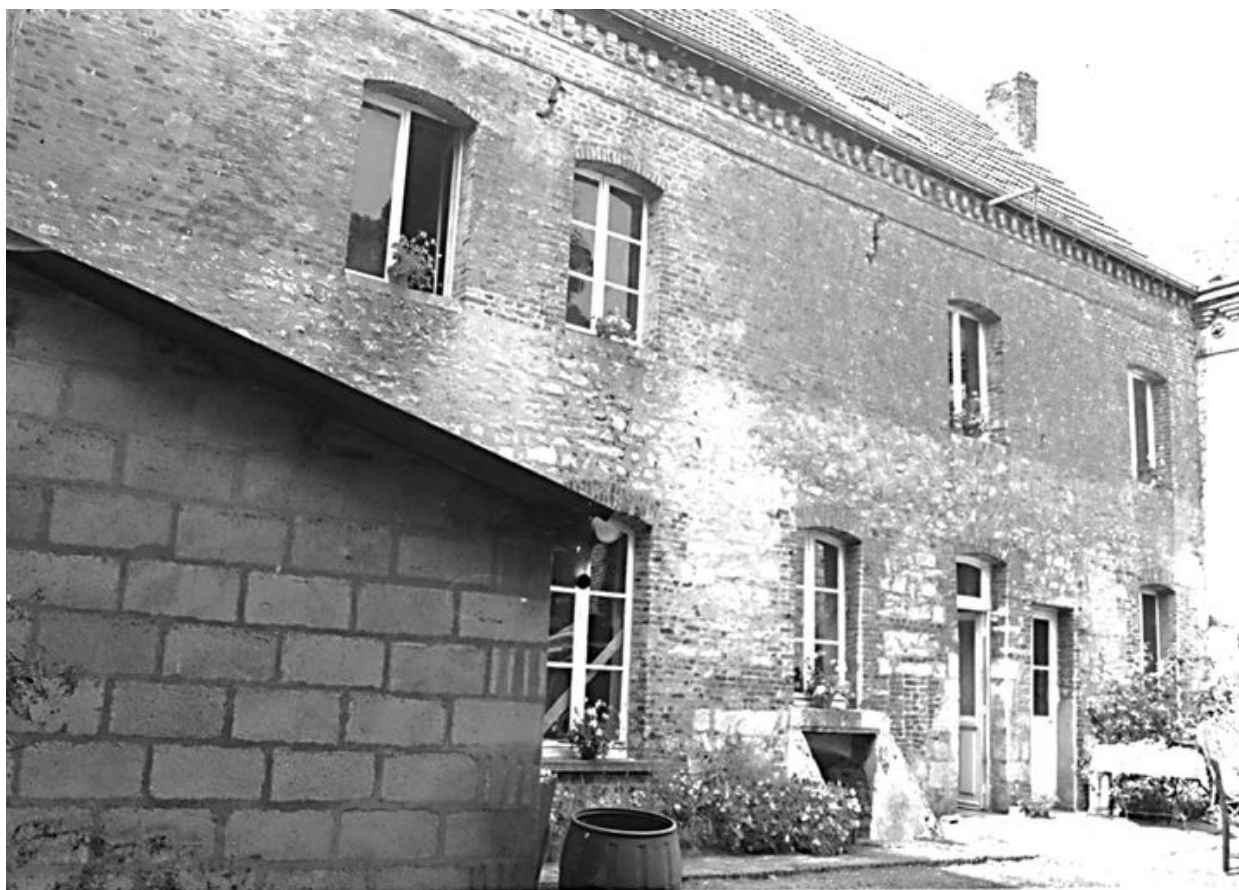
Vue de la façade sur cour de l'aile principale.