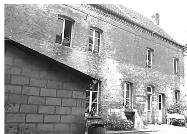
Vue de la façade sur cour de l'aile principale. IVR22_19980203127Z