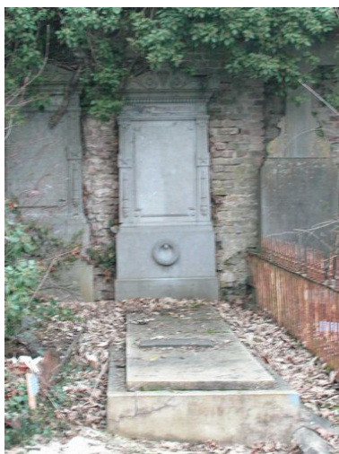
Vue générale. IVR22_20048001335NUCA