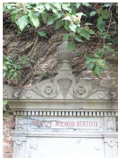
Vue du fronton.