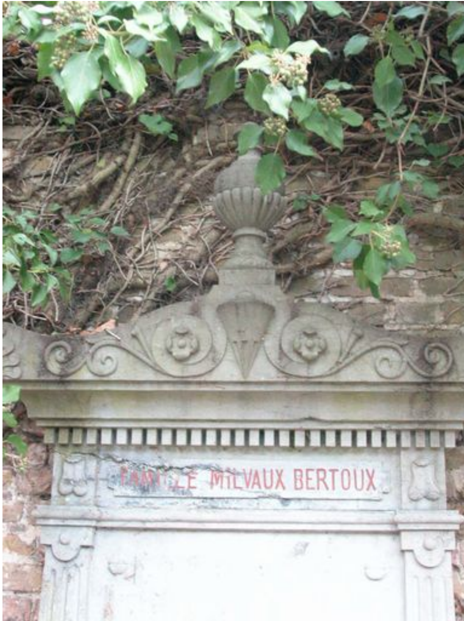
Vue du fronton.