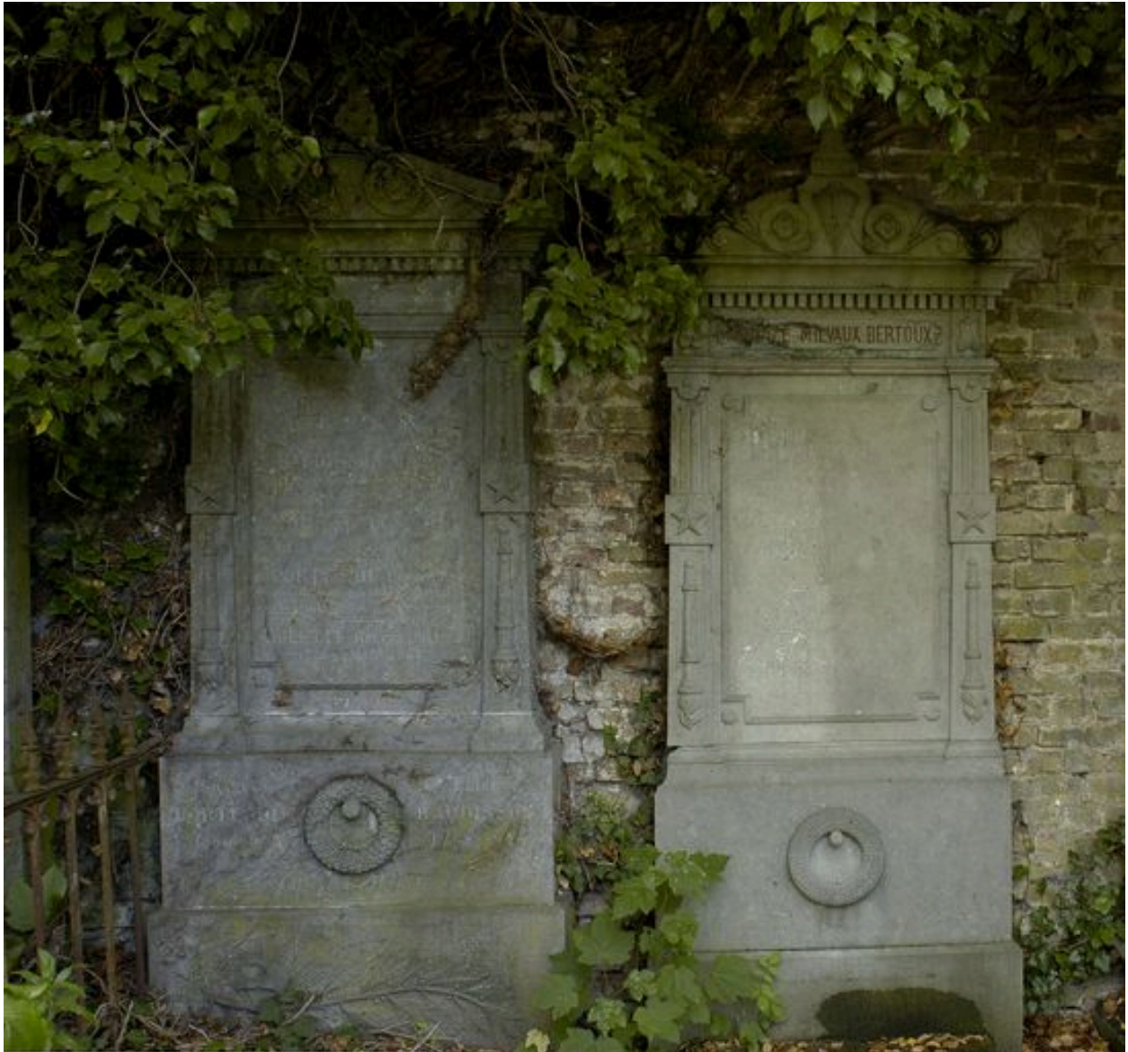
Vue de situation : tombeau à droite de l'image.