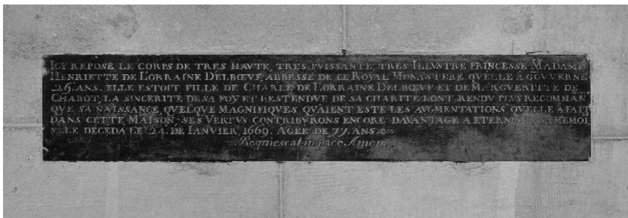
Vue générale de la plaque funéraire.