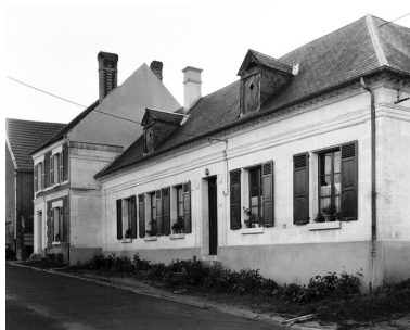
Logis. Elévation antérieure. IVR22_19846001400V

Plan de situation. Extrait du plan cadastral de 1982, section A3 512. IVR22_20096000061NUCA