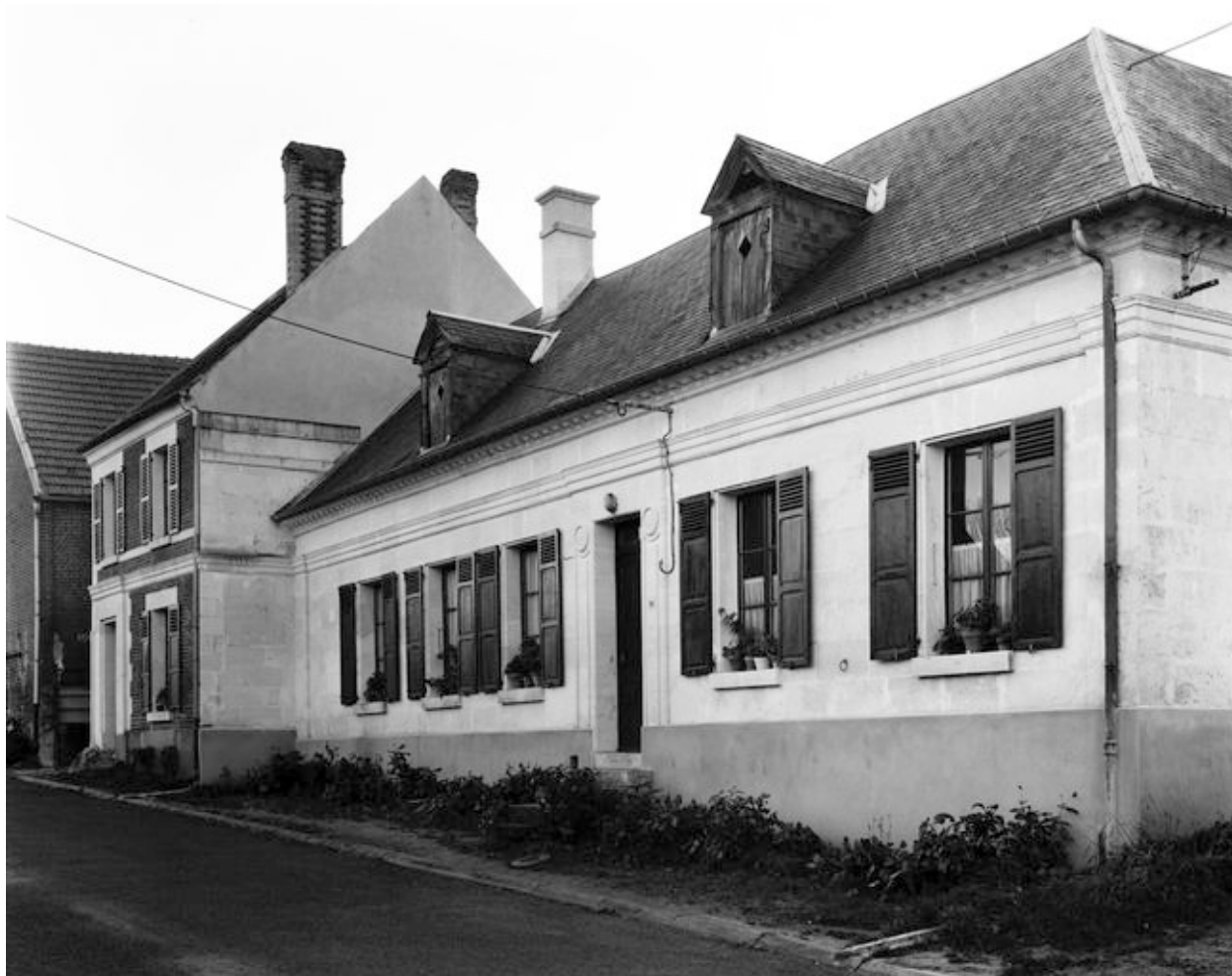
Logis. Elévation antérieure.