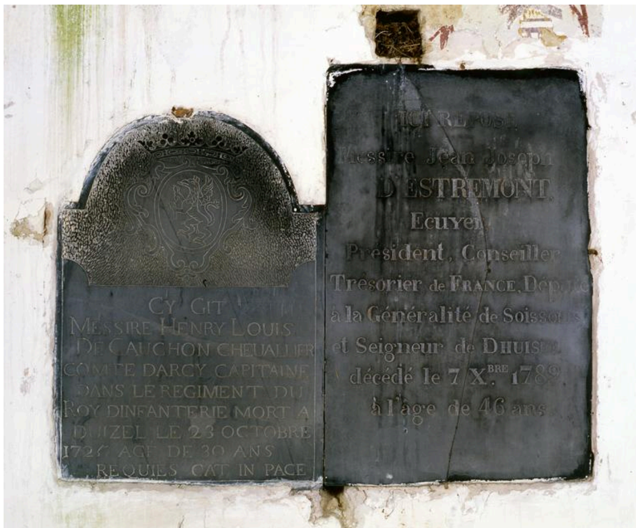
Vue de 2 plaques funéraires : Henri-Louis de Cauchon et Jean-Joseph d'Estremont.