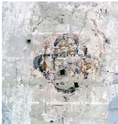
Vue d'une litre funéraire.