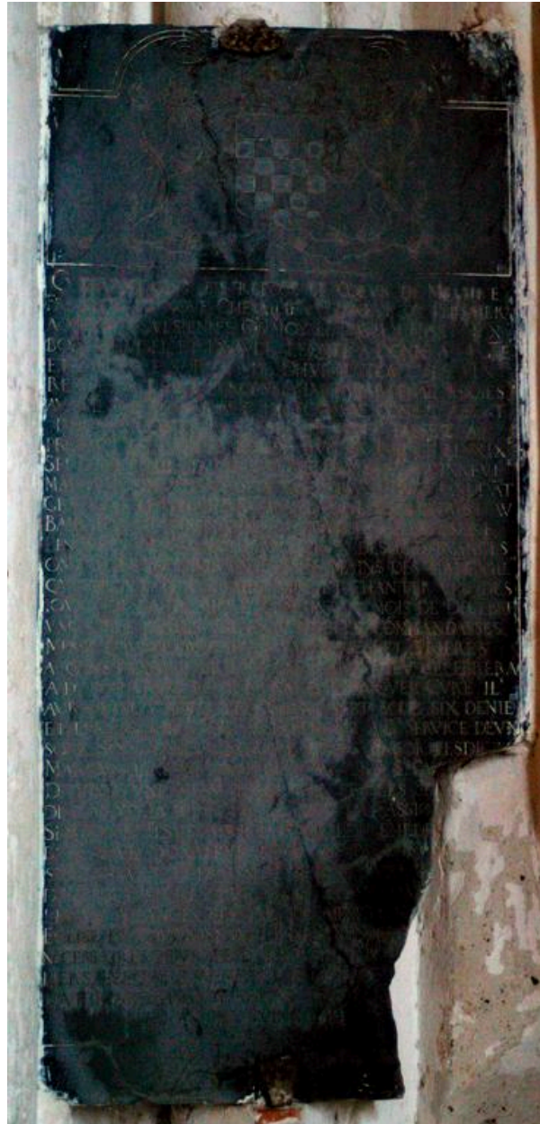
Vue de la plaque funéraire de François de Noue.