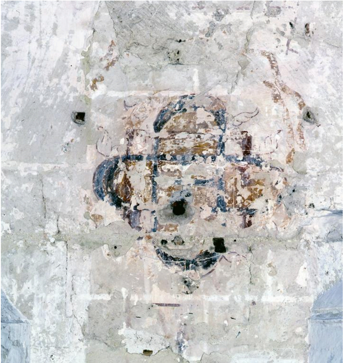
Vue d'une litre funéraire.