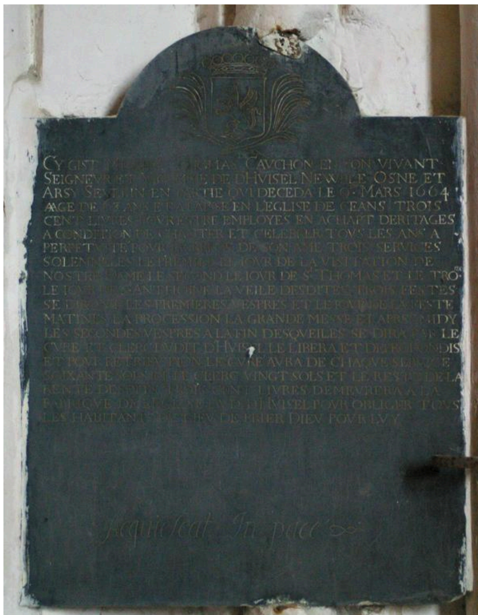
Vue de la plaque funéraire de Thomas Cauchon.