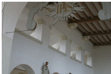
Vue de la tribune. IVR22_20030202721NUCA