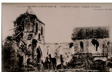
Vue de l'église en ruines.