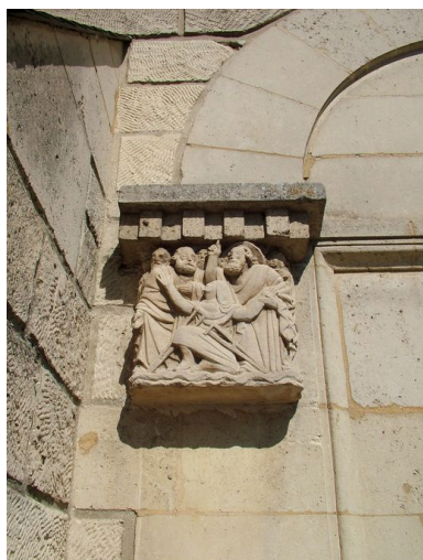
Vue du chapiteau de la porte sud présentant saint Pierre rendant miraculeusement la santé à une paralytique.