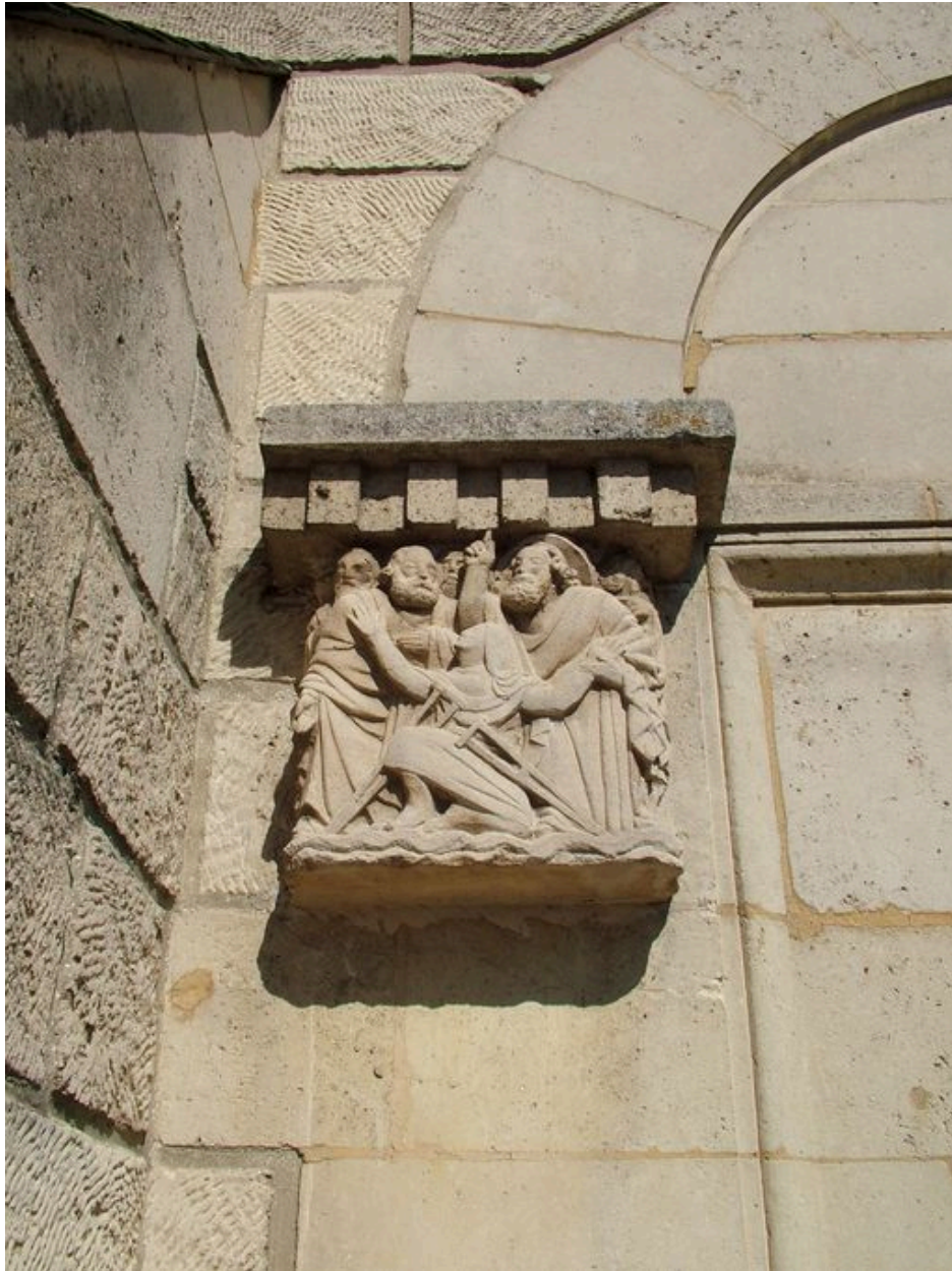
Vue du chapiteau de la porte sud présentant saint Pierre rendant miraculeusement la santé à une paralytique.