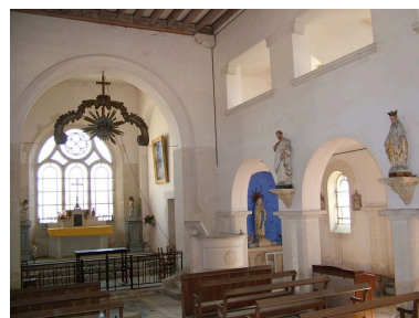
Vue intérieure. IVR22_20030202723NUCA