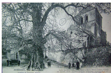
Vue de l'église avant sa destruction (coll. part).