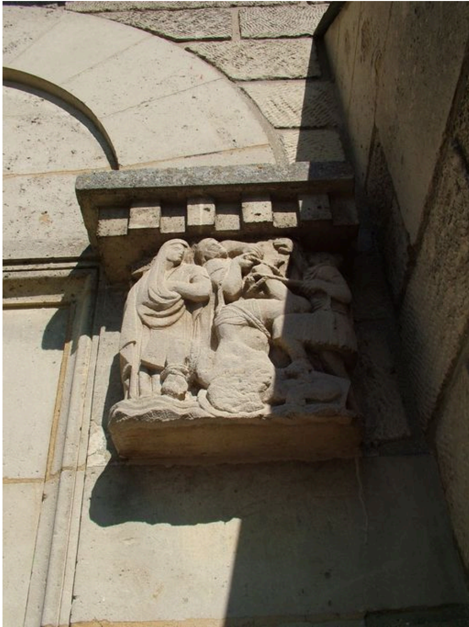
Vue du chapiteau présentant la crucifixion de saint Pierre.