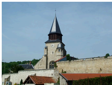
Vue du chevet. IVR22_20030202724NUCA