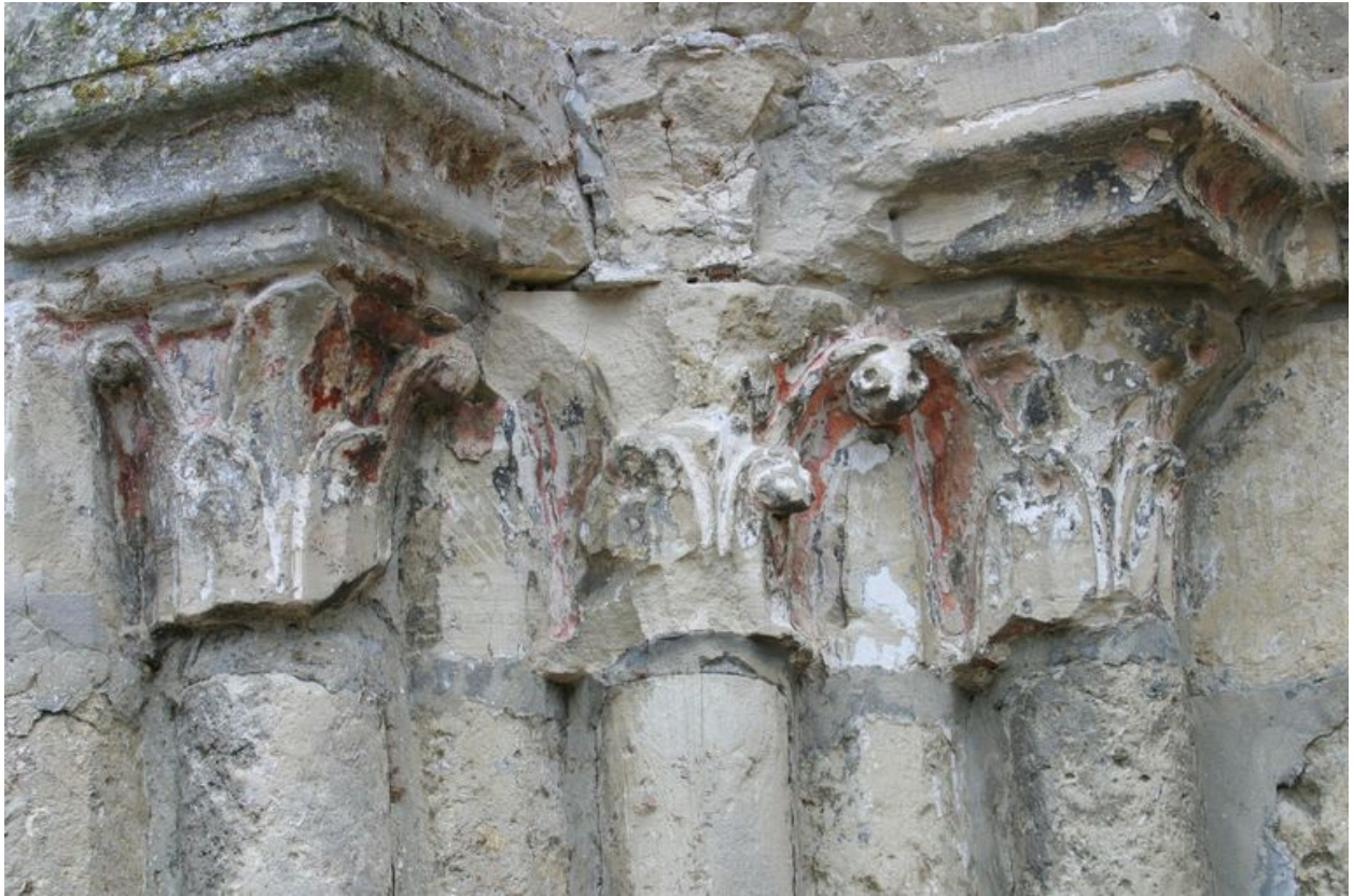
Détail des chapiteaux avec restes de polychromie.