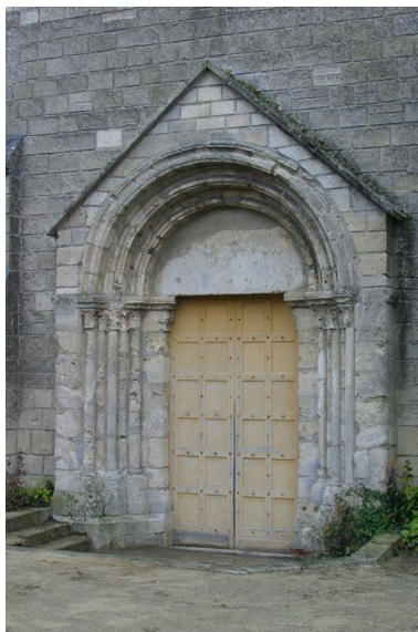
Vue d'ensemble du portail ouest. IVR22_20030202719NUCA