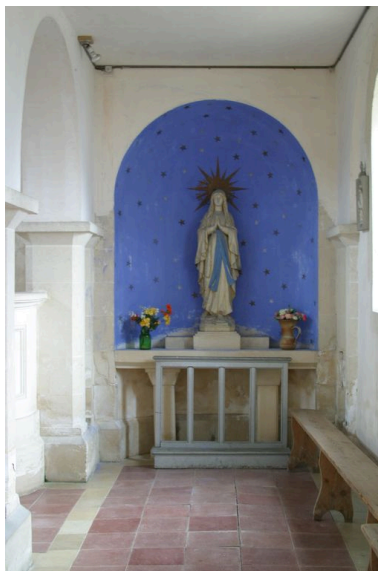
Vue de la chapelle axiale sud.