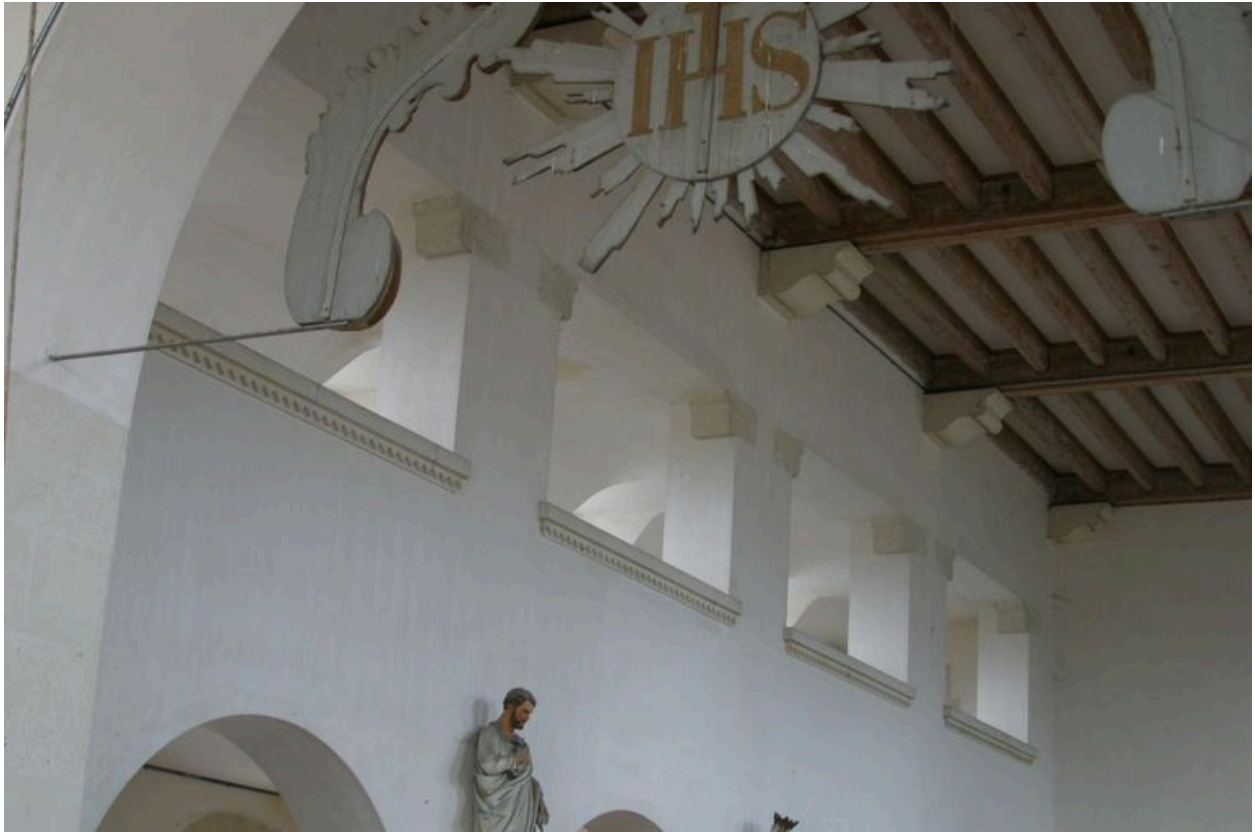
Vue de la tribune.