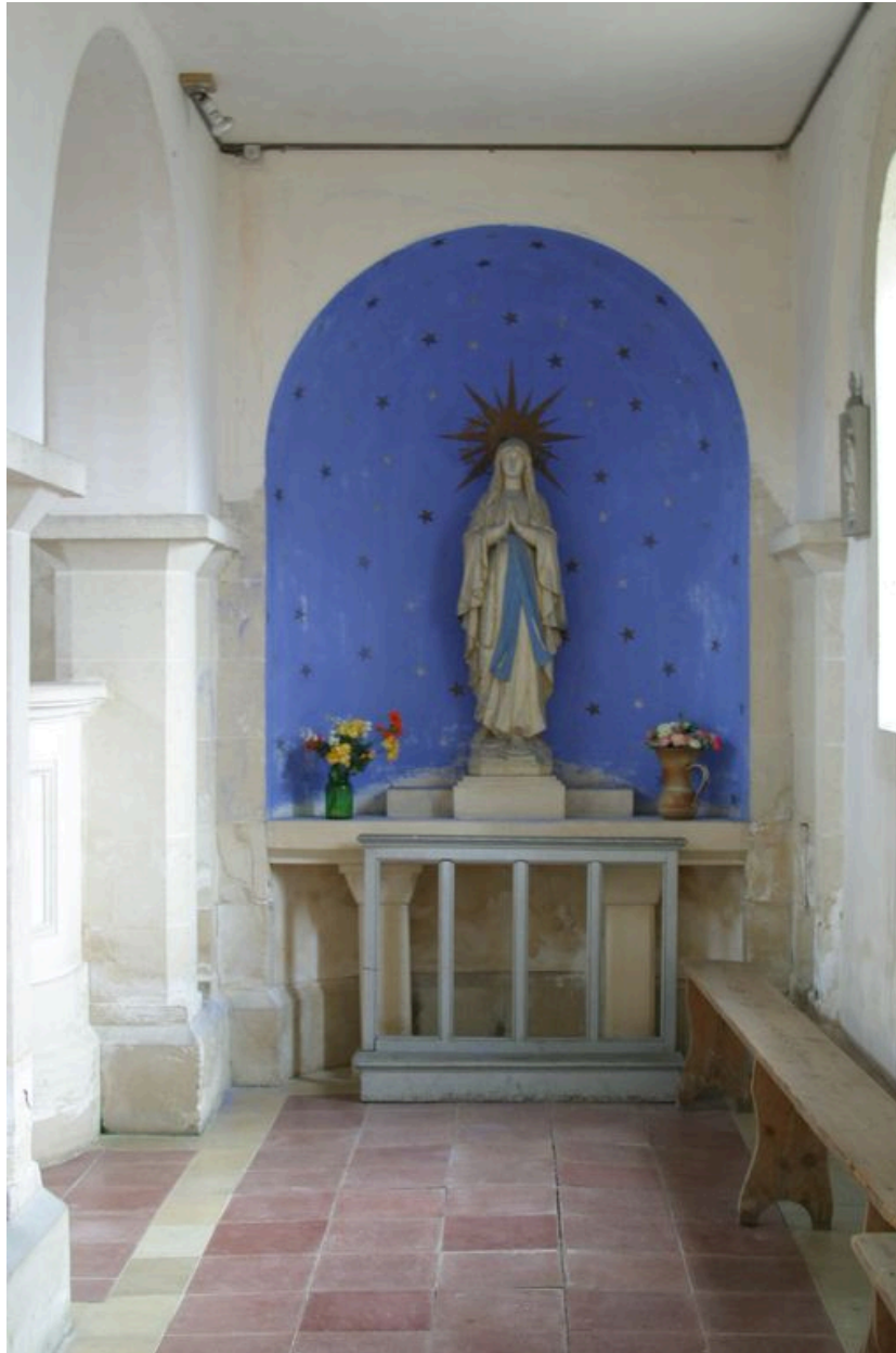
Vue de la chapelle axiale sud.