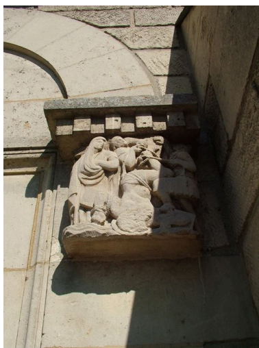
Vue du chapiteau présentant la crucifixion de saint Pierre. IVR22_20050200938NUCA