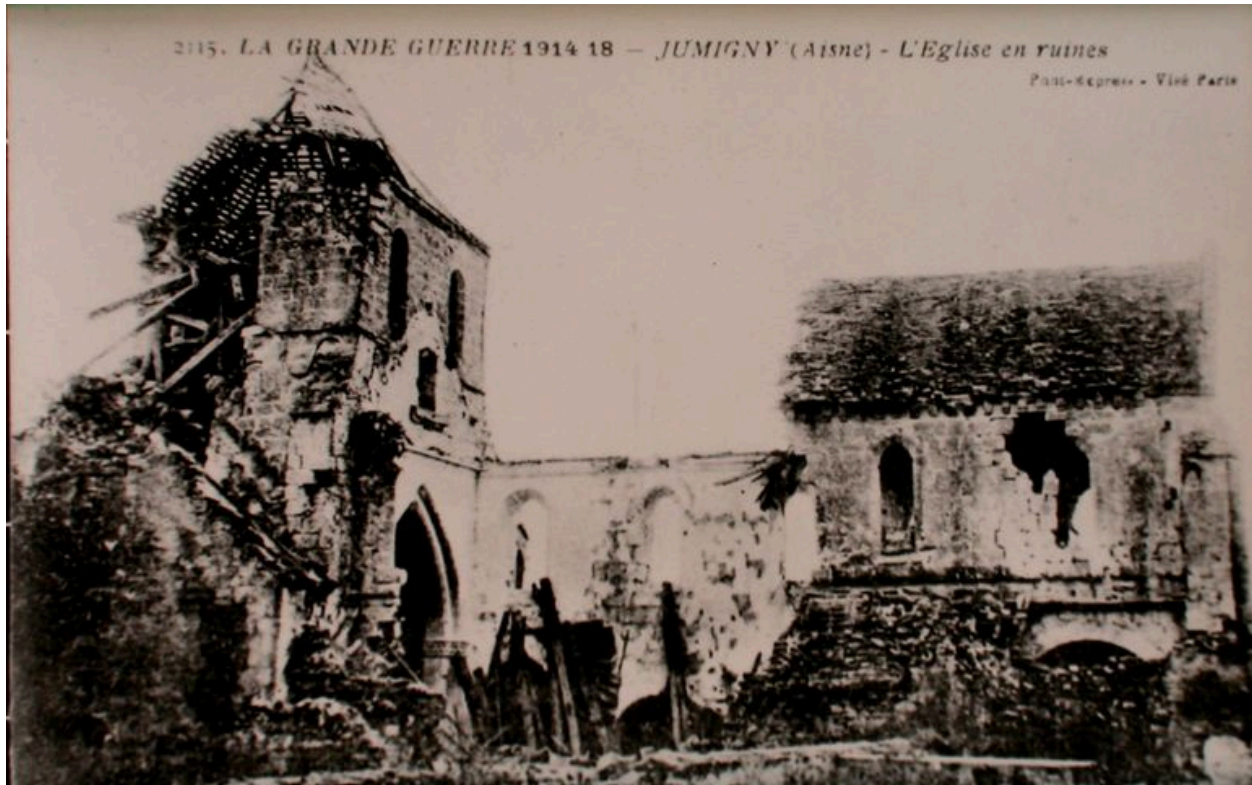
Vue de l'église en ruines (AD Aisne : 2 Fi Jumigny 3).