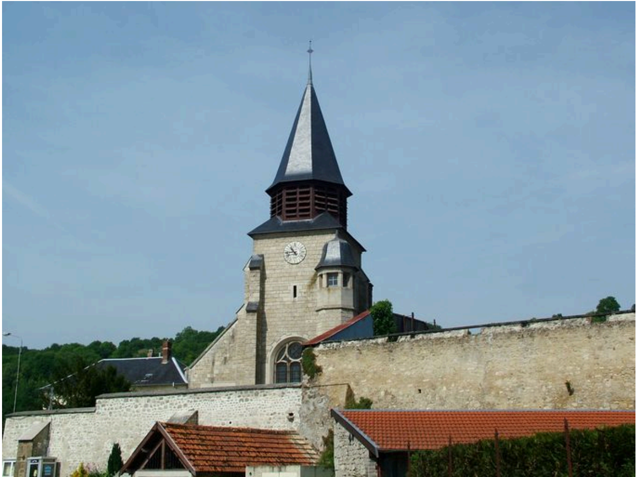
Vue du chevet.