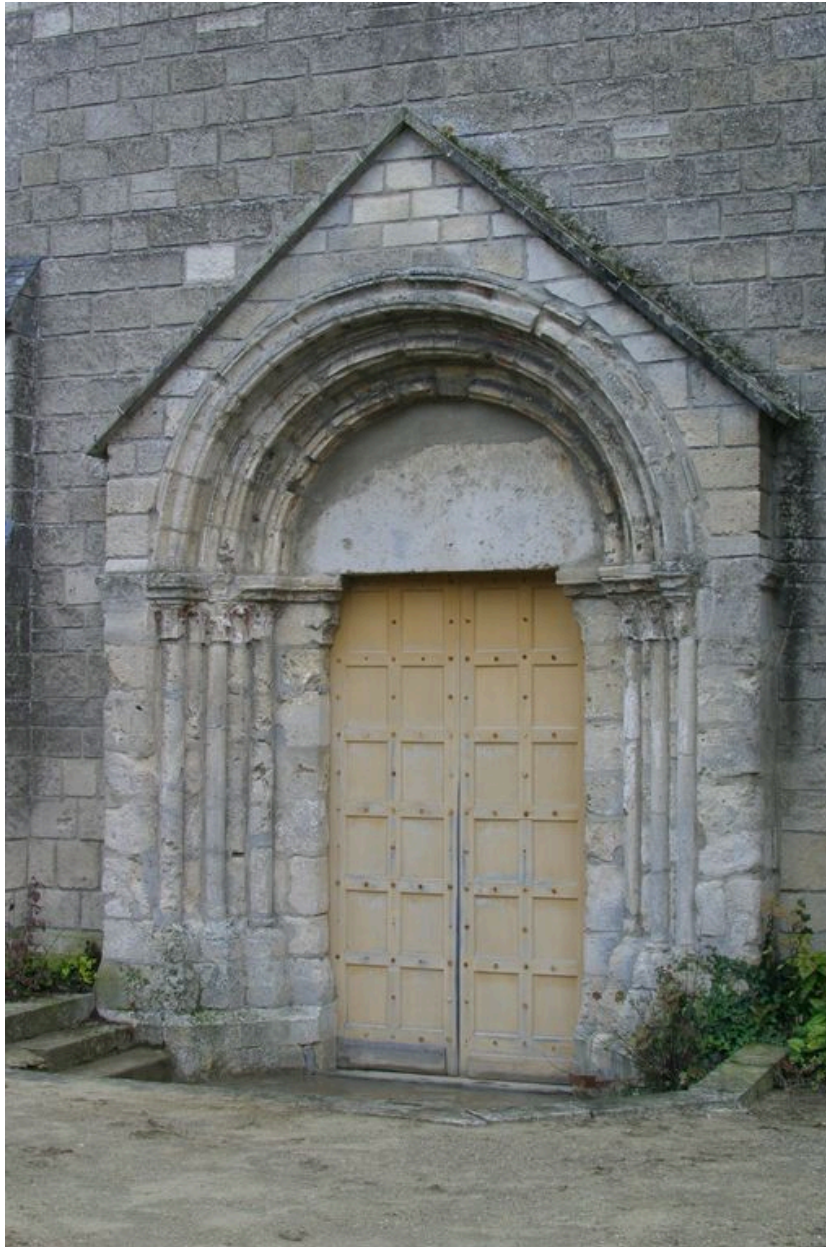
Vue d'ensemble du portail ouest.