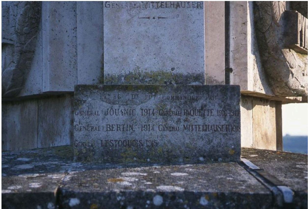
Autre détail de la dédicace.