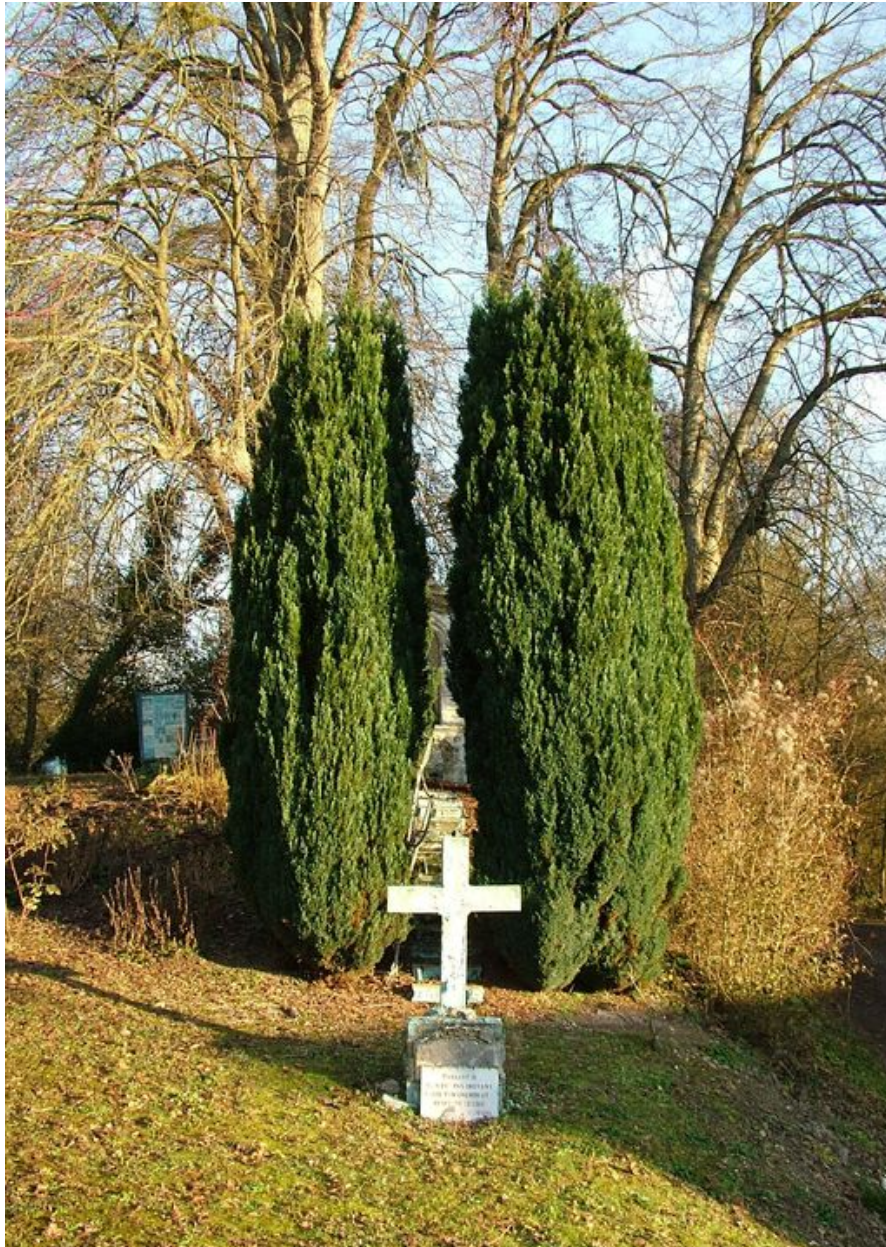
Vue générale du site.