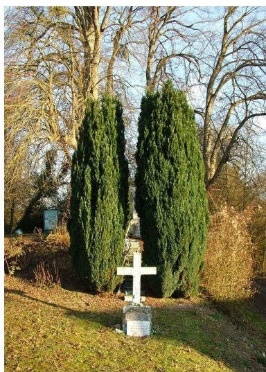
Vue générale du site. IVR22_20108002095NUCA