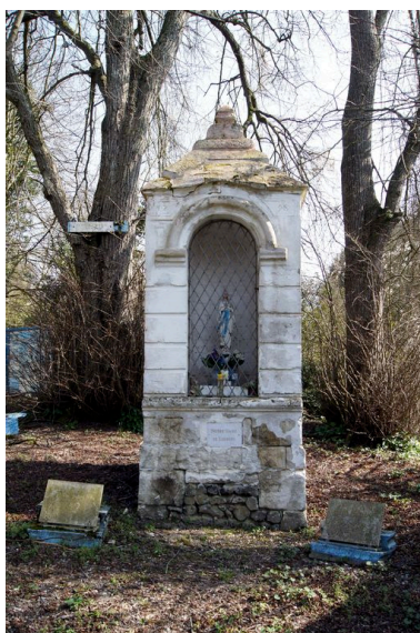
Vue générale de l'édicule.