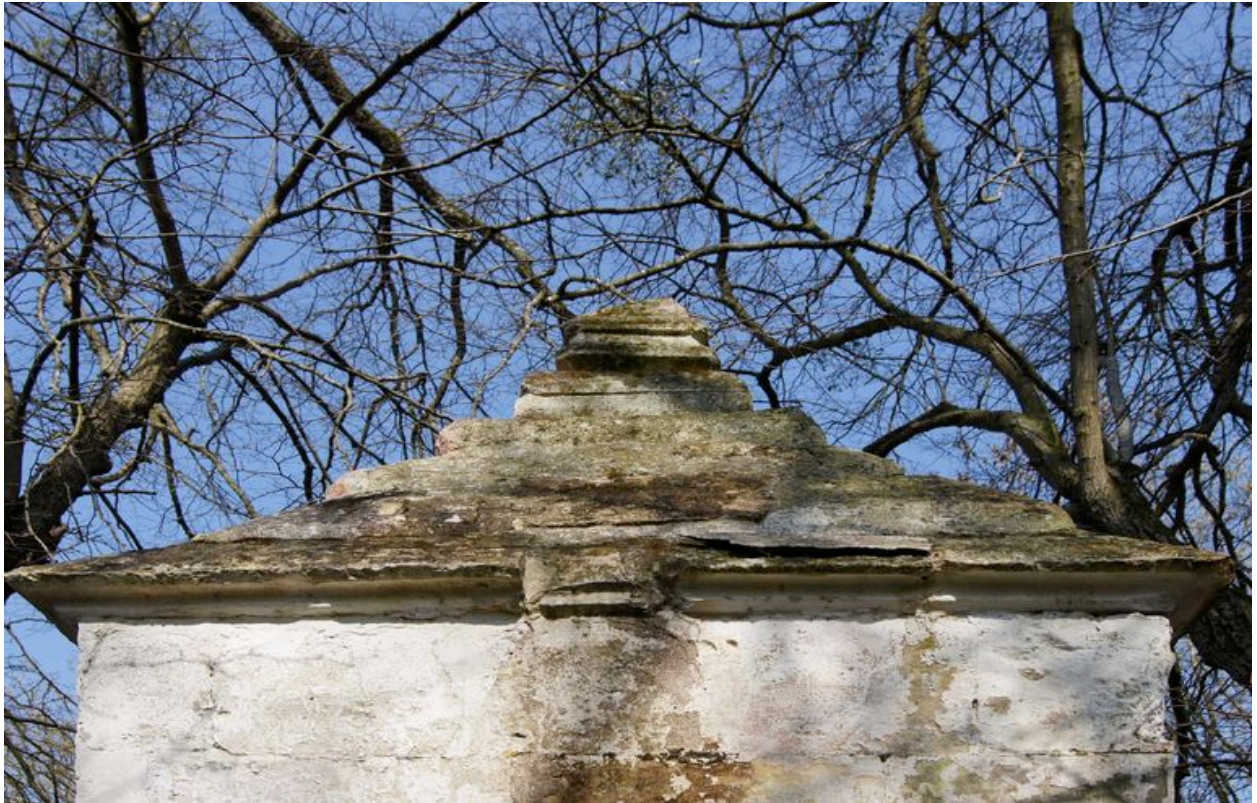
Partie supérieure de l'élévation postérieure.