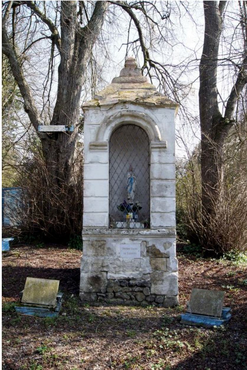
Vue générale de l'édicule.