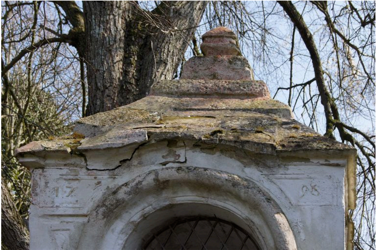
Détail de la partie supérieure de l'édicule portant la date : 1798.