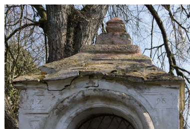
Détail de la partie supérieure de l'édicule portant la date : 1798. IVR22_20118000018NUCA