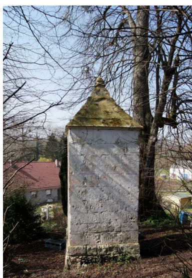
Elévation postérieure. IVR22_20118000017NUCA