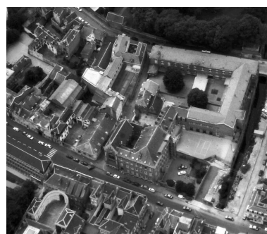
Vue aérienne, flanc est. IVR22_20098000115NUC2A