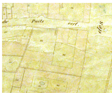
Extrait du cadastre de 1851 (DGI). IVR22_20048011011NUCA