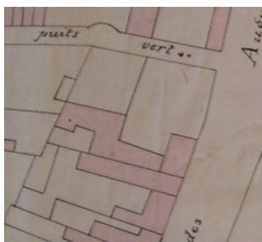
Extrait du cadastre de 1812 (BM Amiens). IVR22_20048011012NUCA