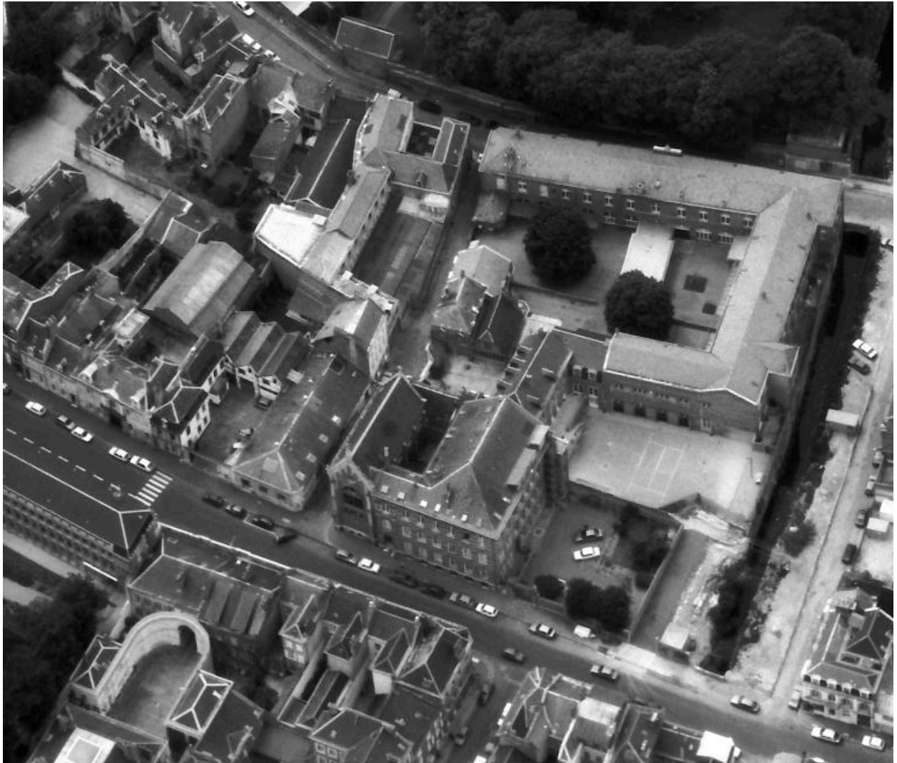
Vue aérienne, flanc est.