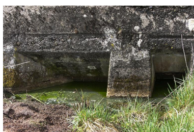
IVR31_20145904425NUCA