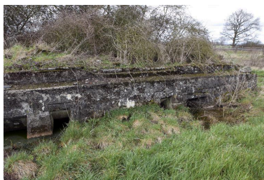
Elévation antérieure, Vers le nord. IVR31_20145904423NUCA