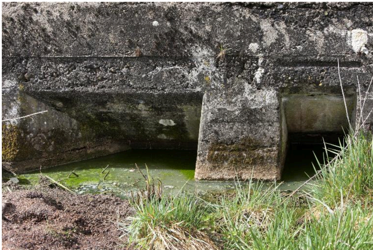
Elévation antérieure, entrée et resserre à mitrailleuse