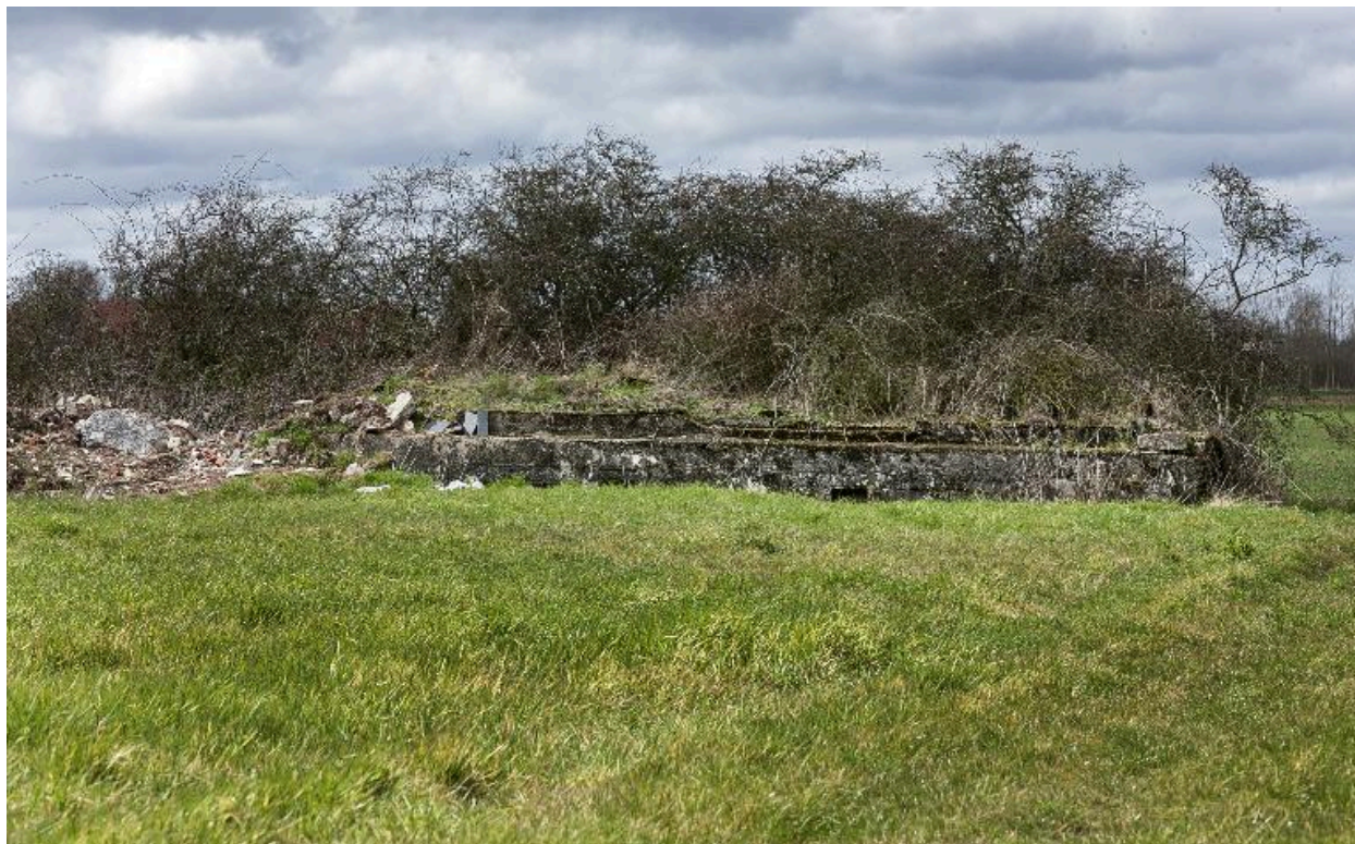
Elévation antérieure, vers l'ouest