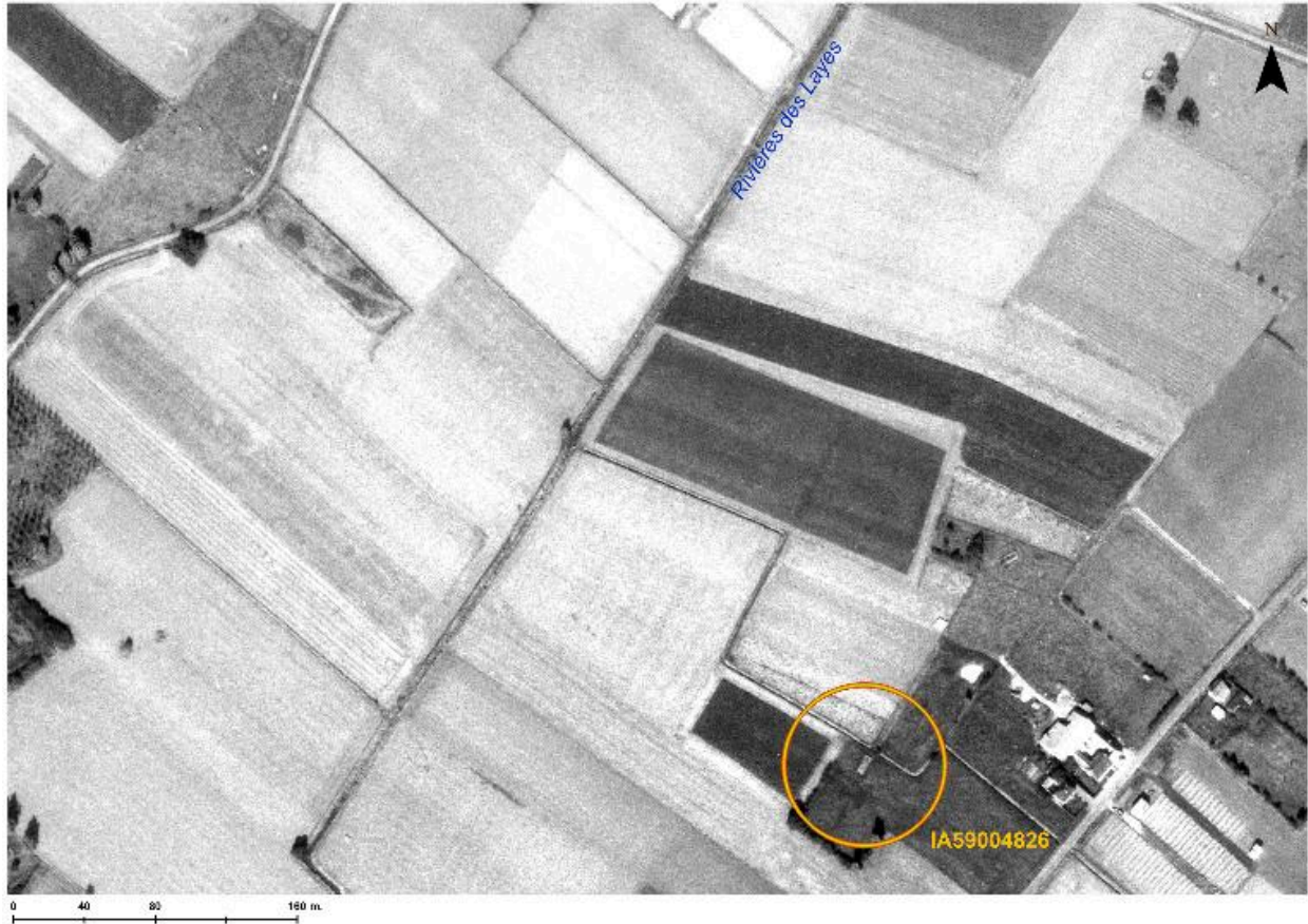
Position de l'édifice en 1978 (cercle jaune) sur une ortho photographie de 1978 (IGN, Geoportail).