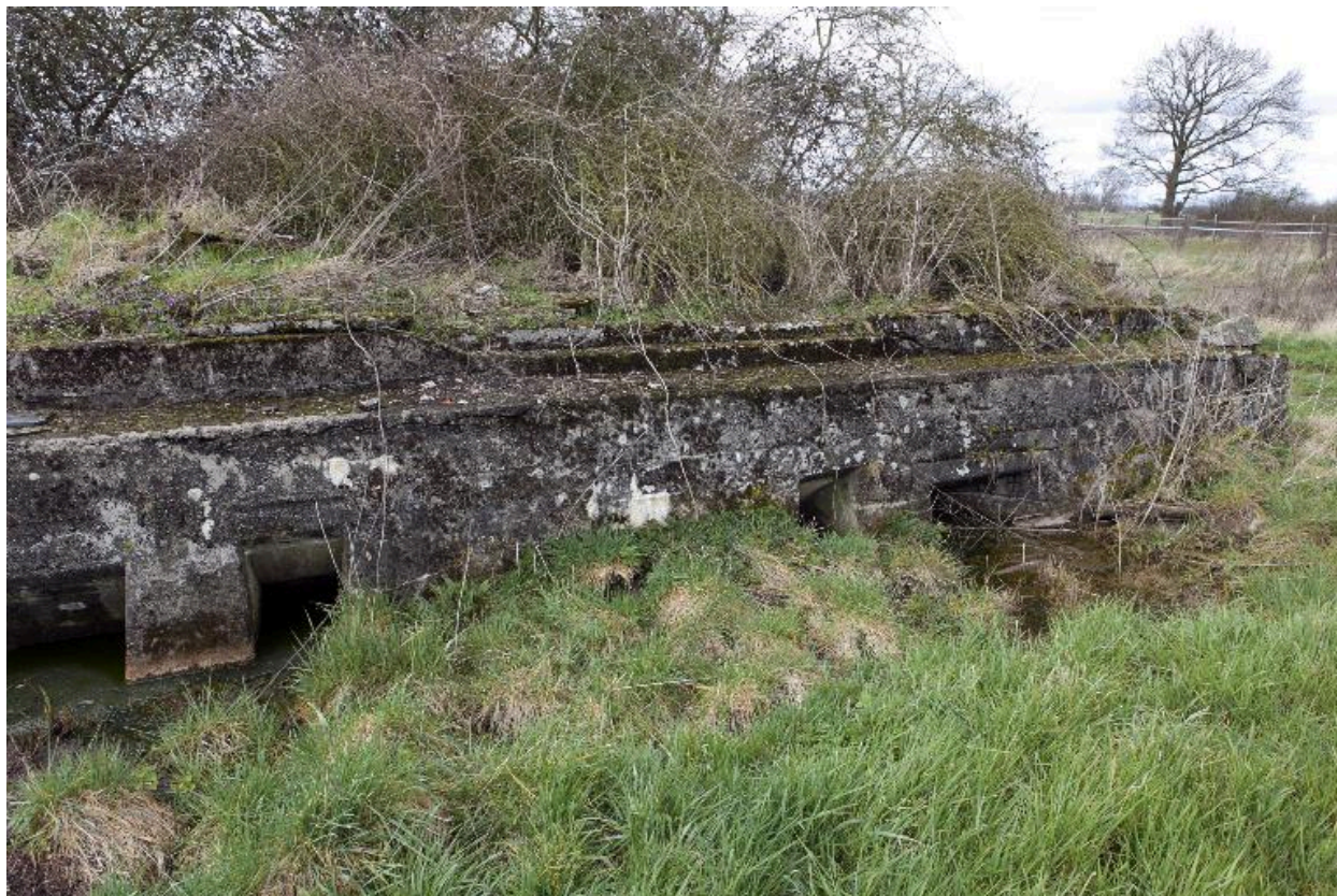
Elévation antérieure, Vers le nord.