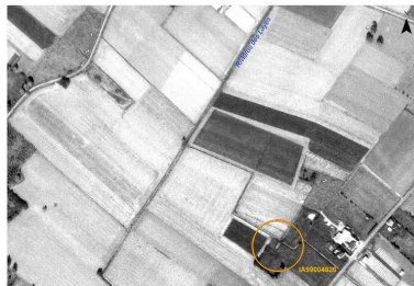
Position de l'édifice en 1978 (cercle jaune) sur une ortho photographie de 1978. IVR32_20175900165NUCA