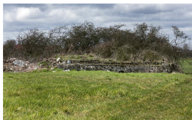
Elévation antérieure, vers l'ouest