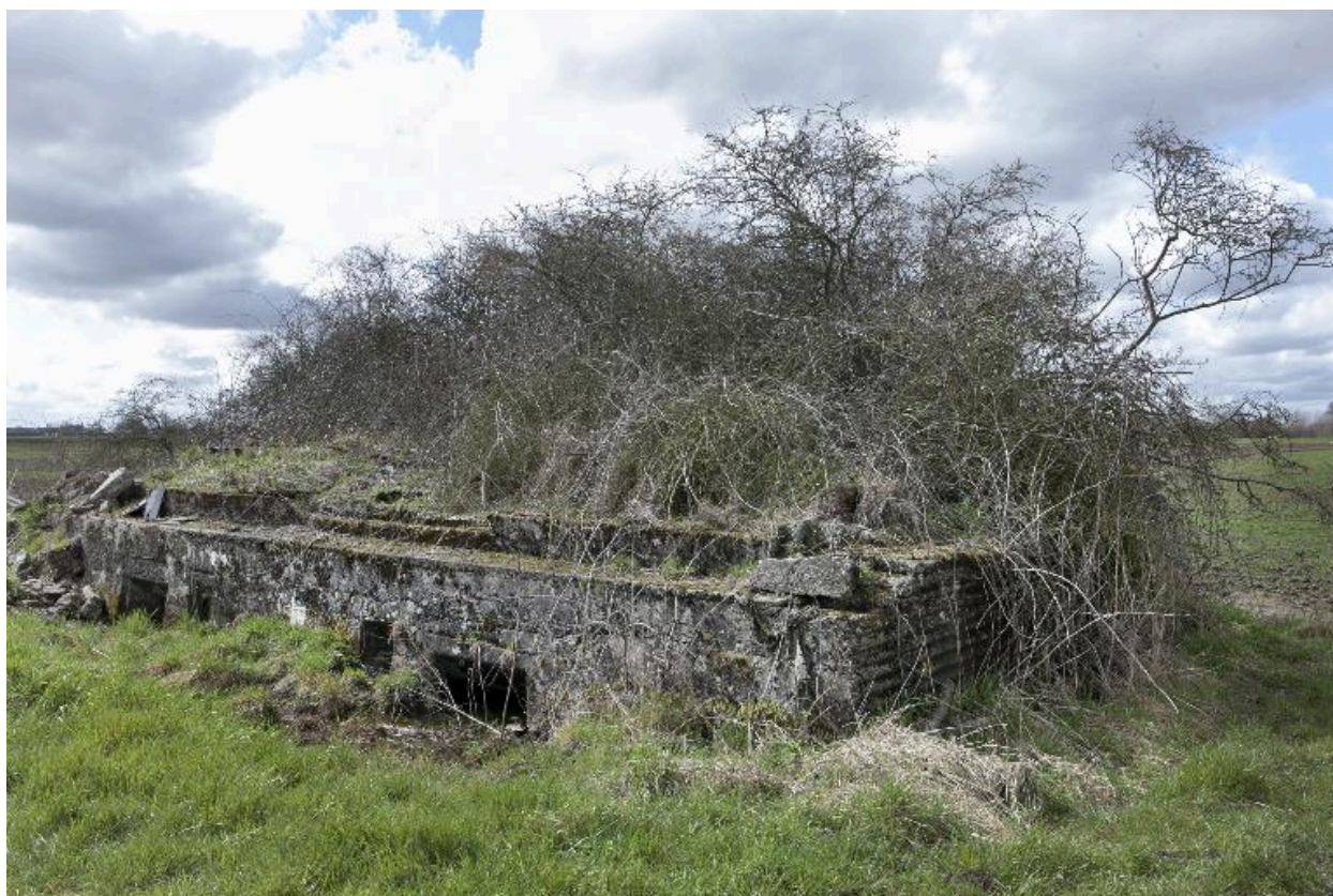
Elévation antérieure, vers le sud-ouest