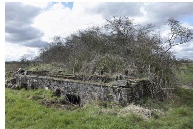
Elévation antérieure, vers le sud-ouest IVR31_20145904424NUCA