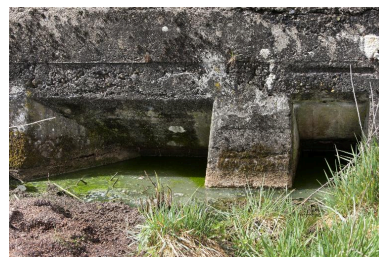
Elévation antérieure, entrée et resserre à mitrailleuse