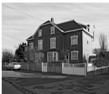
Vue générale des maisons d'ingénieur.