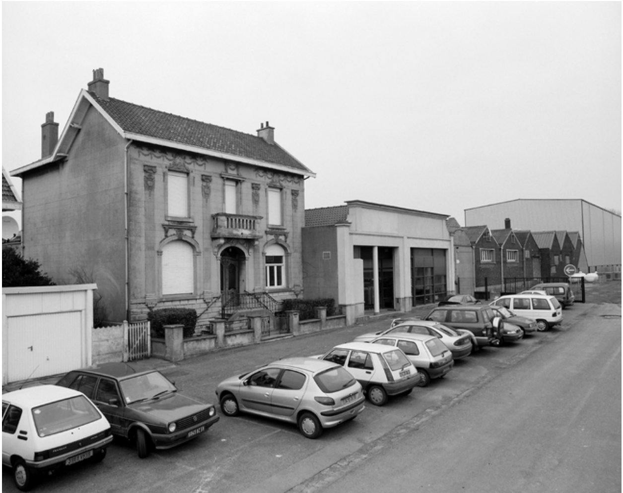
Vue générale de l'usine et de la maison patronale.