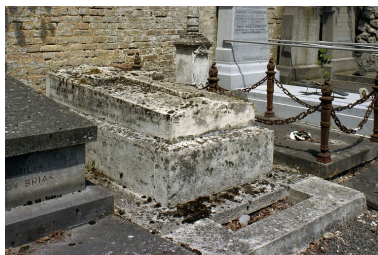
Vue de trois-quarts présentant les épitaphes disposées sur le côté du sarcophage. IVR22_20058001268NUCA