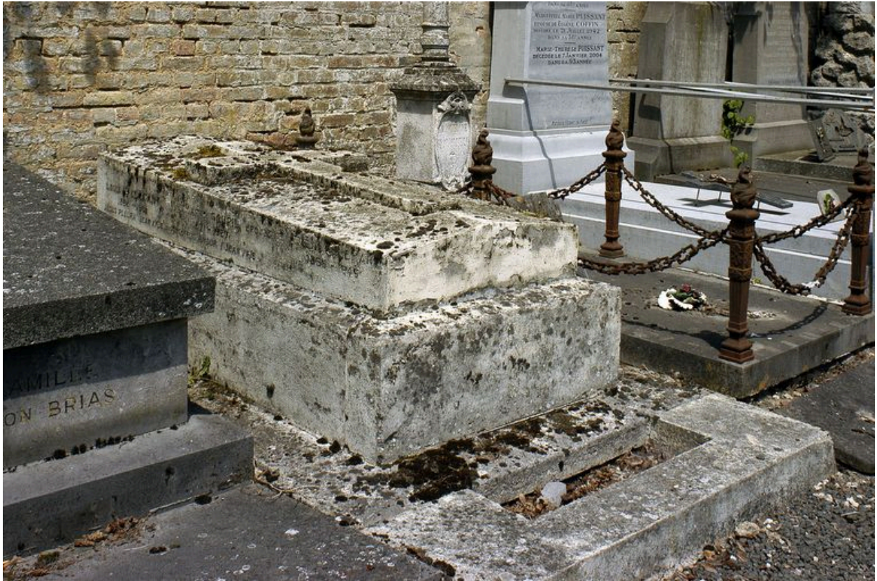
Vue de trois-quarts présentant les épitaphes disposées sur le côté du sarcophage.