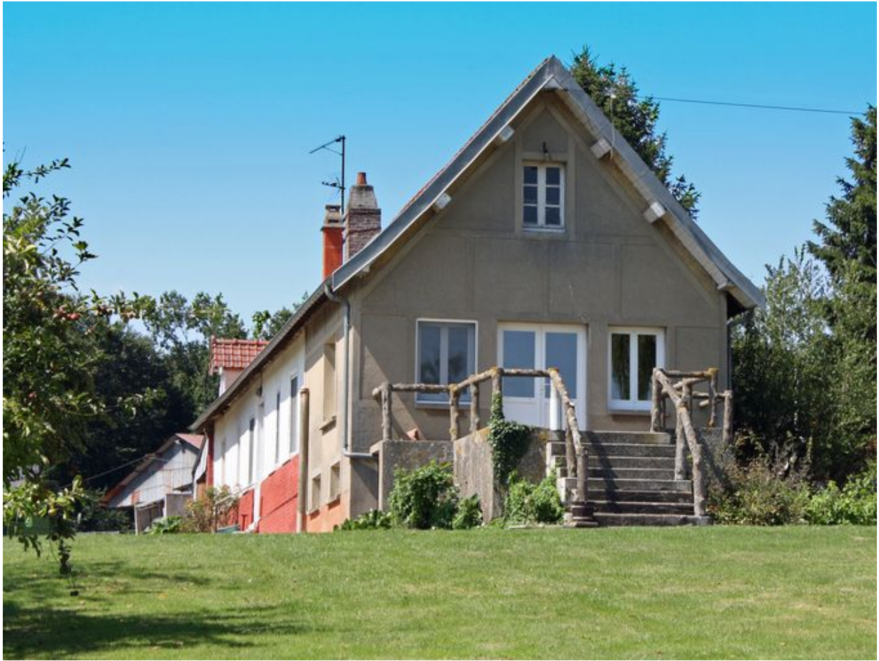
Le logement, vue de l'entrée sur le pignon.