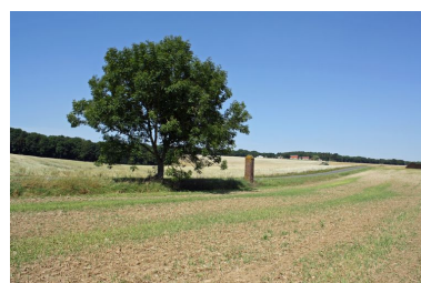
Borne de limite de domaine avec la ferme de Réderie à l'arrière plan.

IVR22_20098005149NUCA