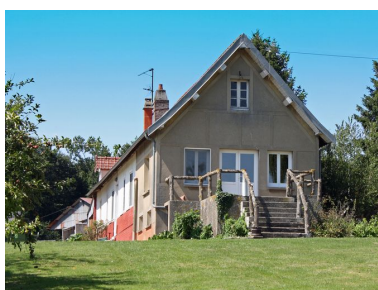
Le logement, vue de l'entrée sur le pignon.

Phot. Bertrand Fournier IVR22_20098005147NUCA