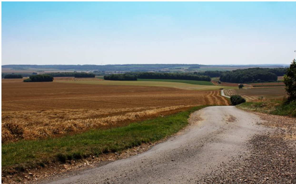
Vue du plateau de Ville-le-Marcelet, depuis la ferme de Réderie.