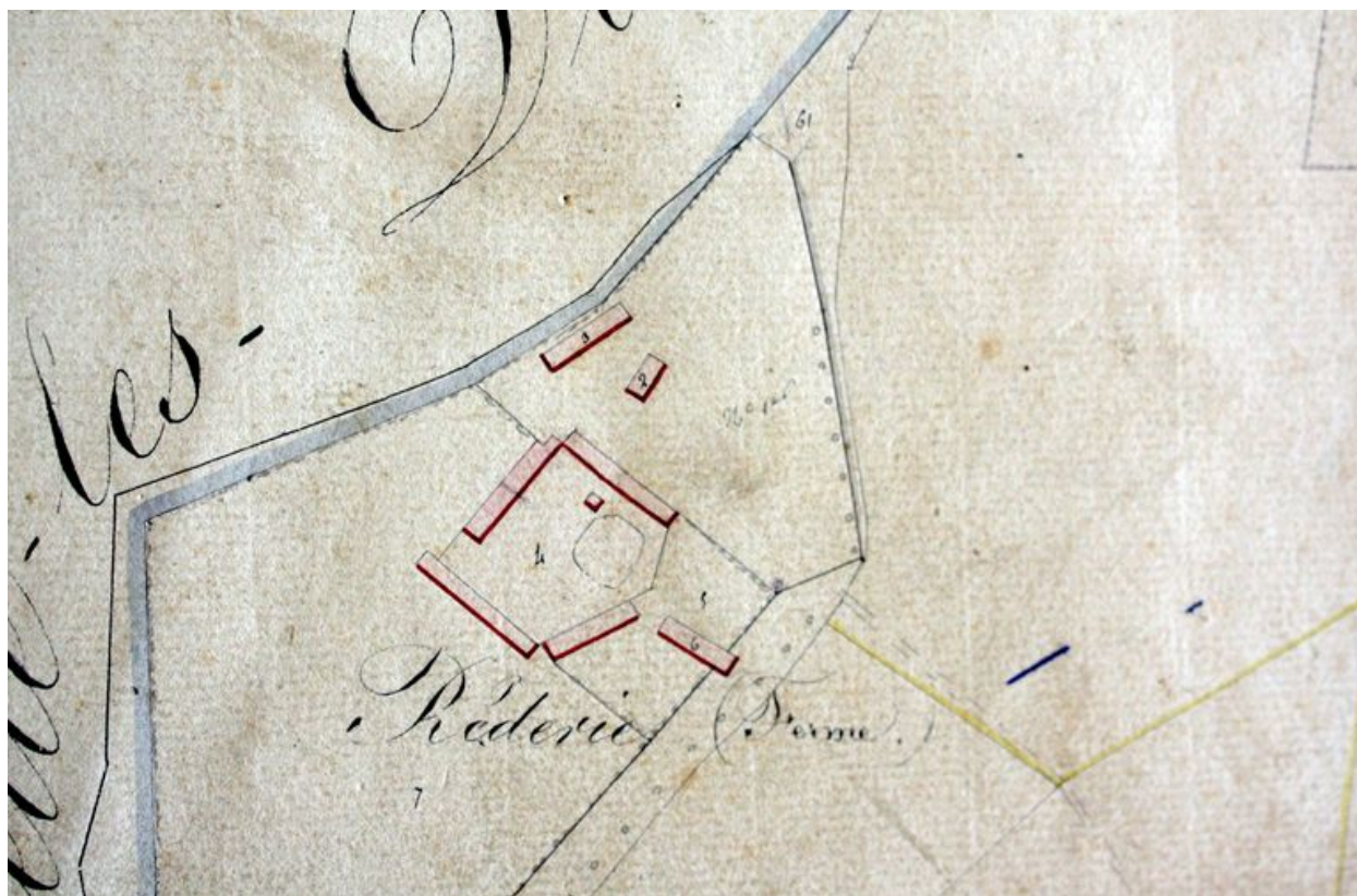
Extrait du plan cadastral, section A, 1834 (AD Somme ; 3 P 1772/1).