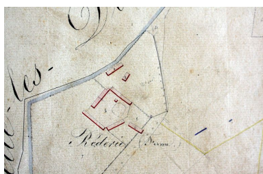
Extrait du plan cadastral, section A, 1834 (AD Somme ; 3 P 1772/1).

IVR22_20098005154NUCA