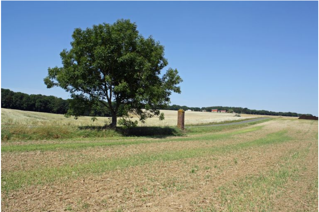
Borne de limite de domaine avec la ferme de Réderie à l'arrière plan.