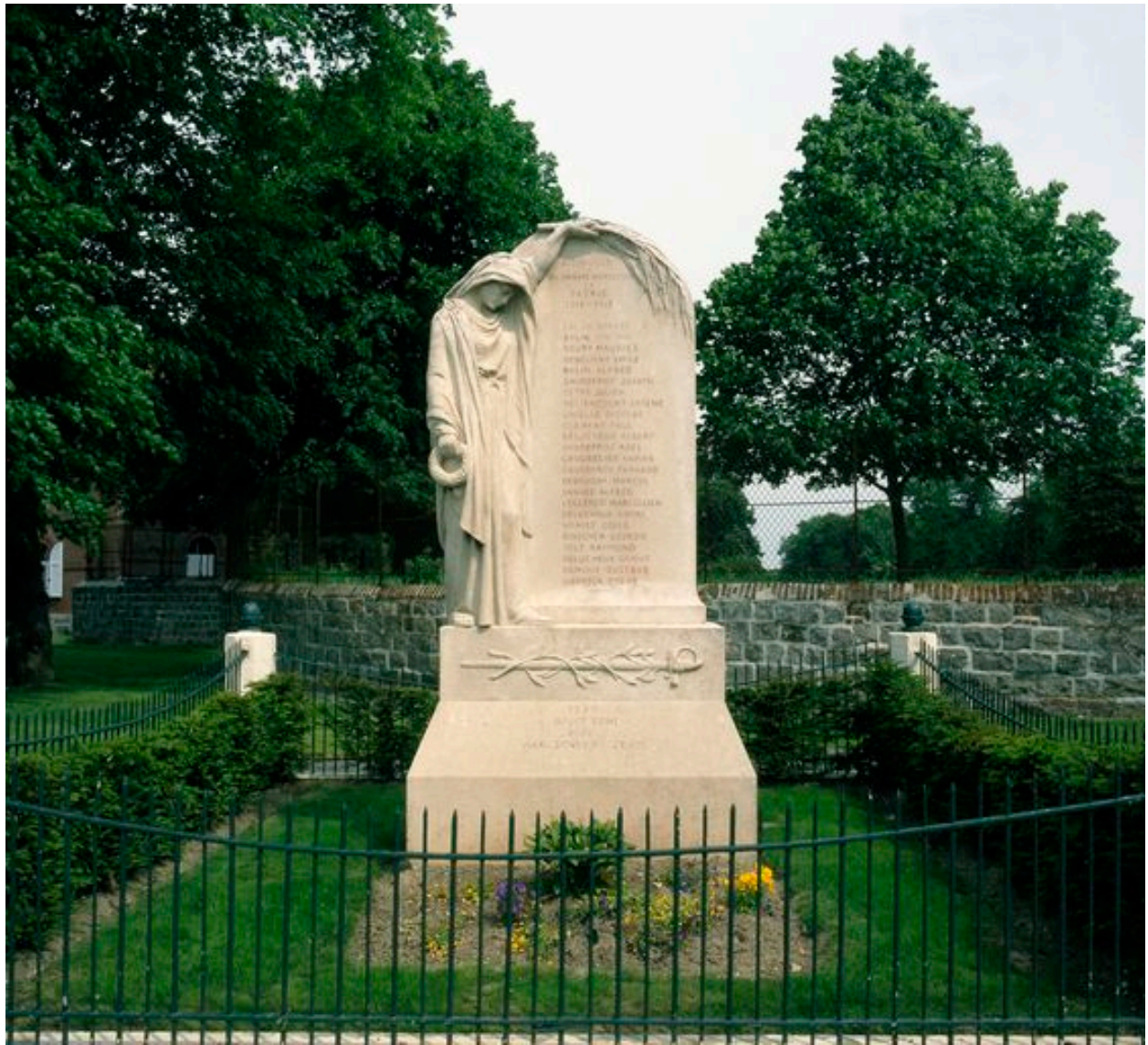
Vue de la stèle depuis le sud.