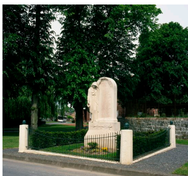
Vue générale depuis le sud-est. IVR22_20038000471XA