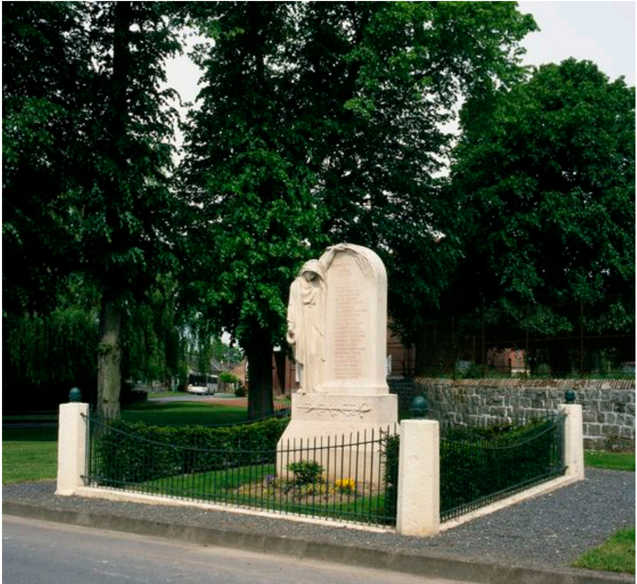
Vue générale depuis le sud-est.