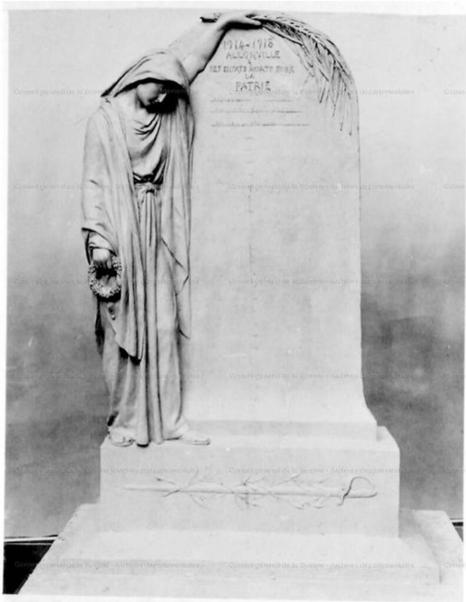
Maquette d'Athanase Fossé, vers 1920 (AD Somme).