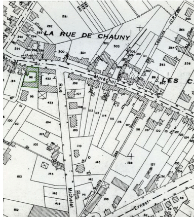
Plan de situation. Extrait du plan cadastral de 1974, section AM 98. IVR22_20096000505NUCA