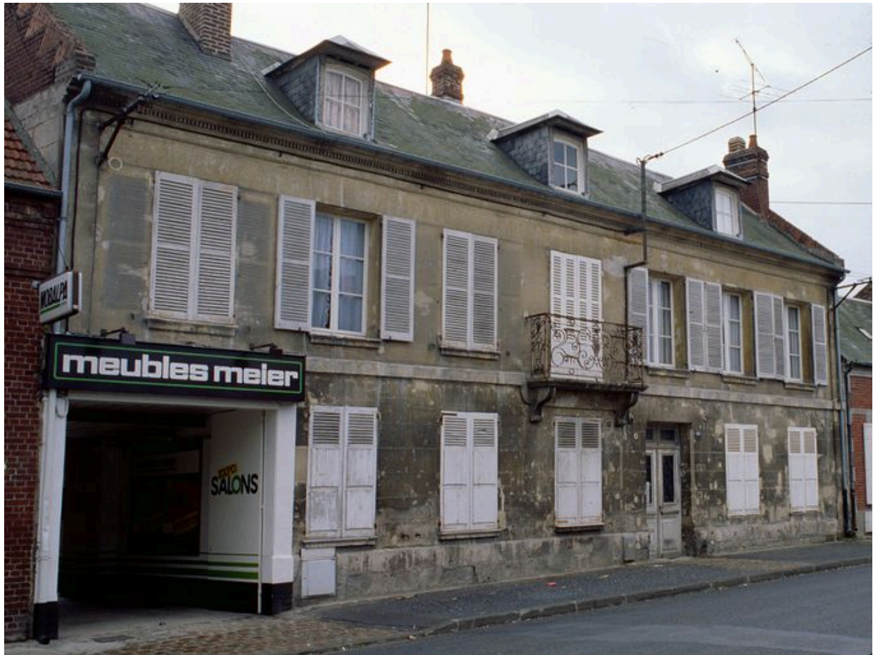
Elévation sur rue.