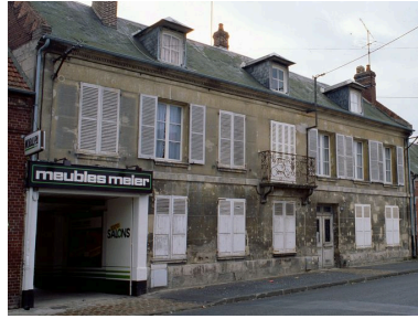
Élévation sur rue.