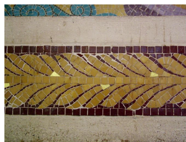
Détail du décor. IVR22_20030202133NUCA