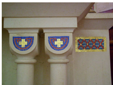
Détail du décor.