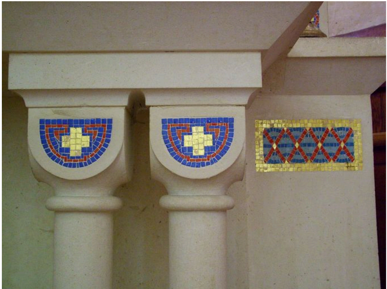
Détail du décor.