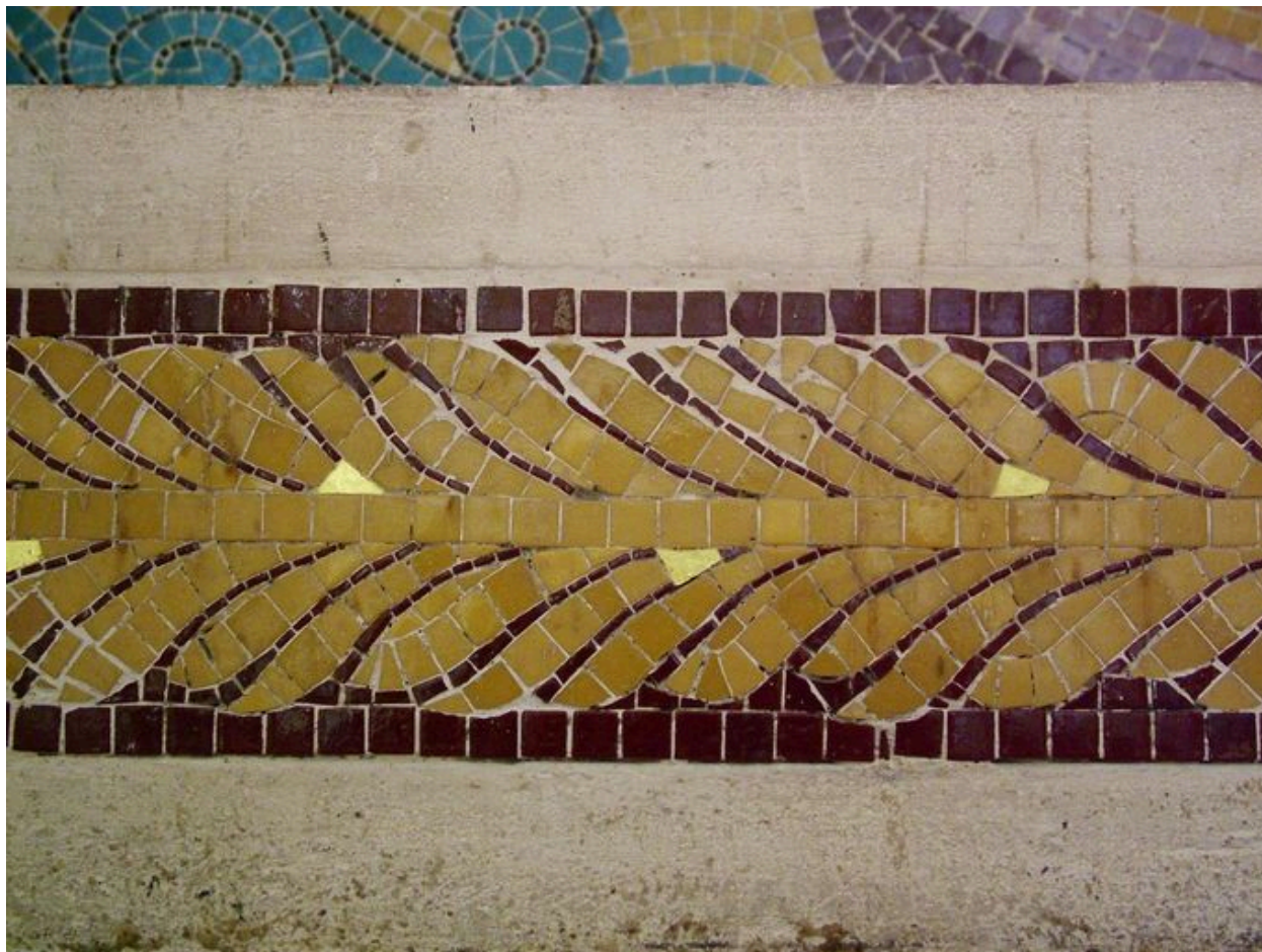
Détail du décor.