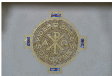
Détail du décor. IVR22_20030202136NUCA