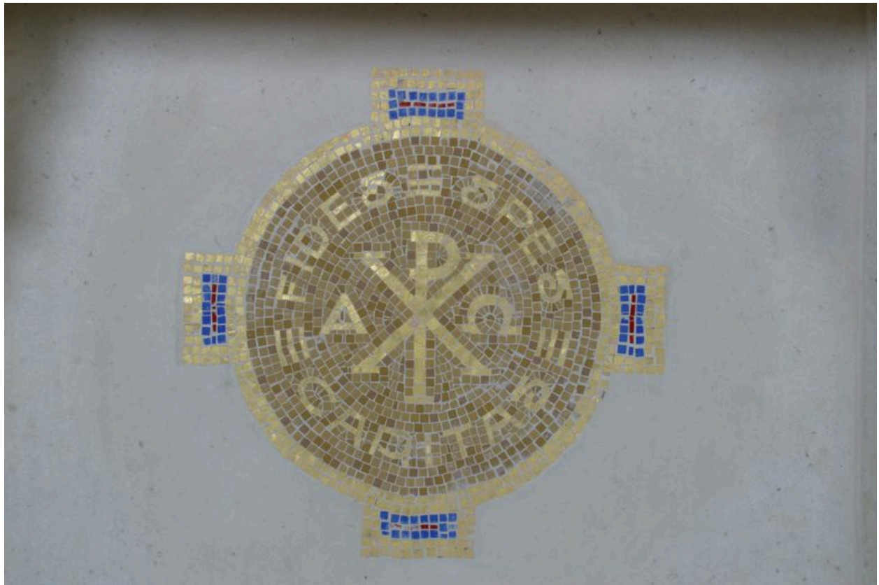
Détail du décor.