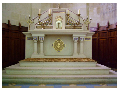
Vue générale. IVR22_20030202130NUCA