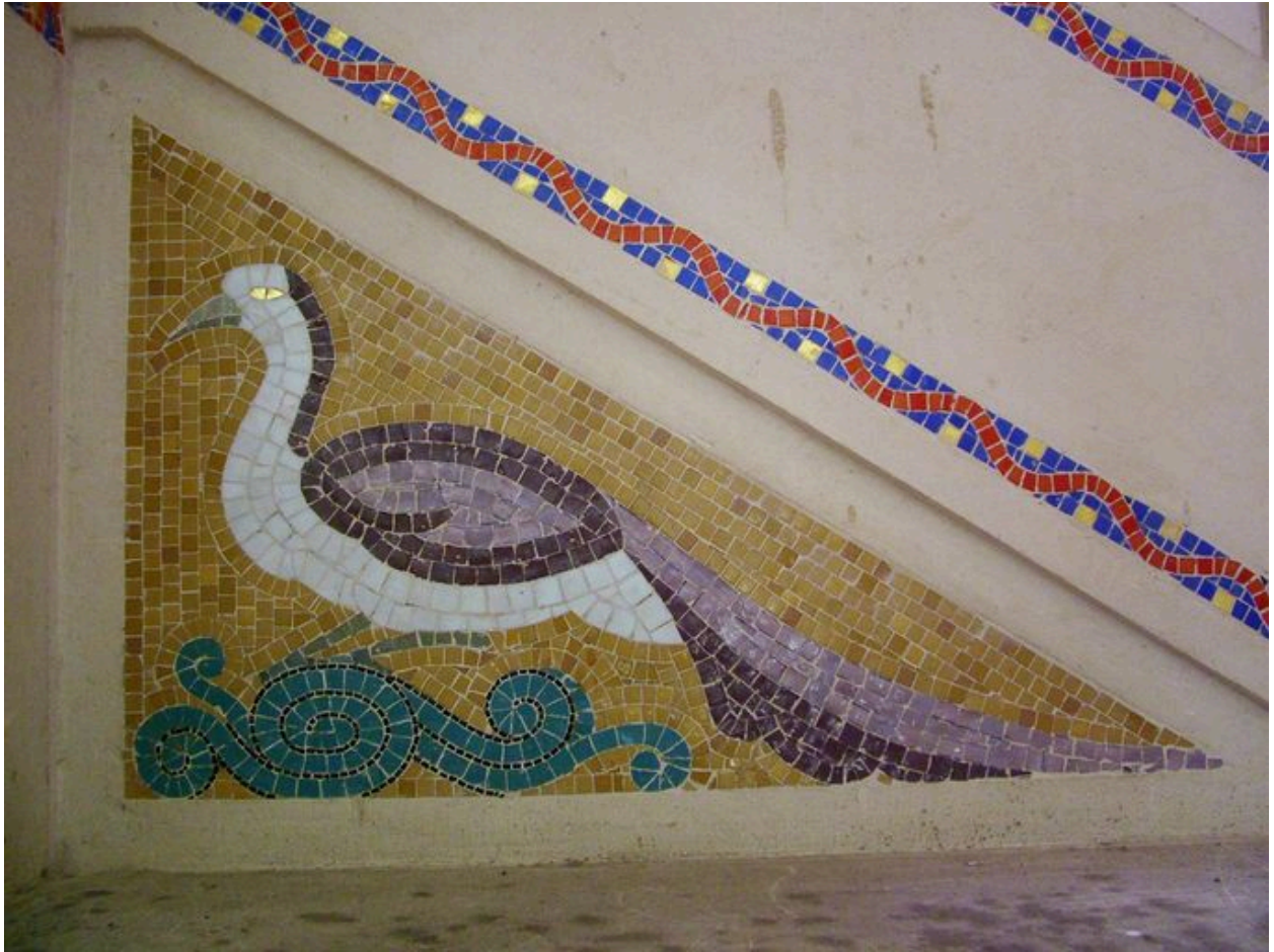
Détail du décor.