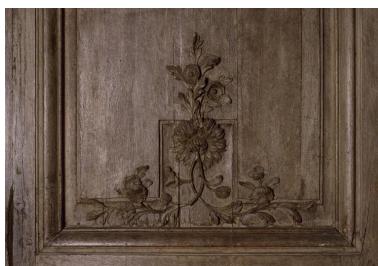
Détail du décor des lambris du mur nord. IVR22_20010202330ZA