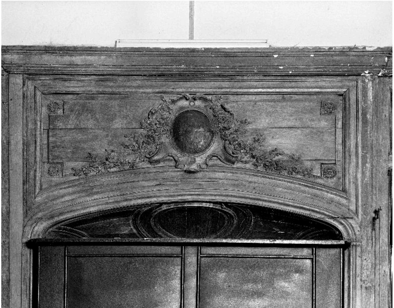
Détail du décor sculpté des lambris situés au-dessus de la grande porte.