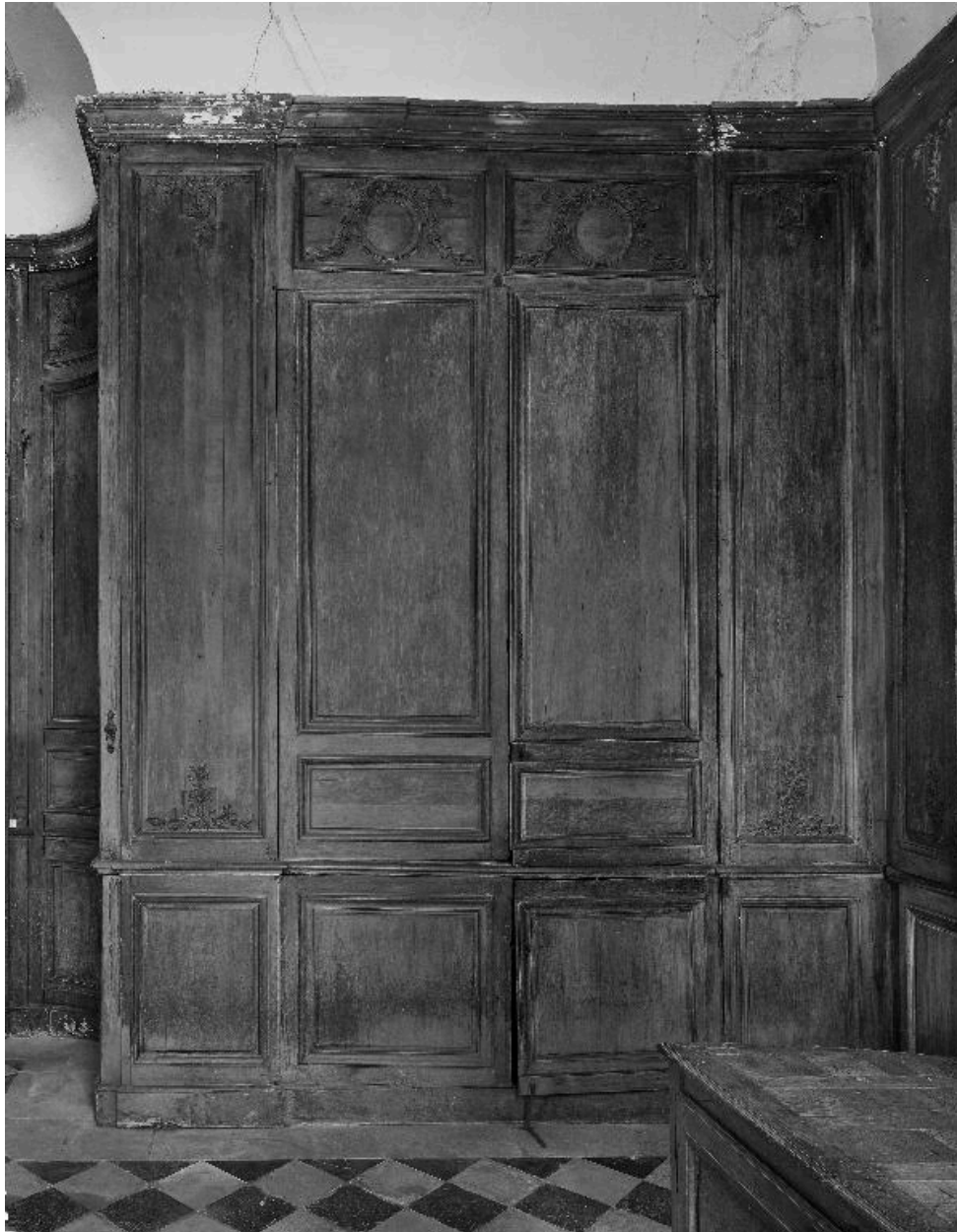
Vue des lambris du mur nord et des battants d'un placard encastré.