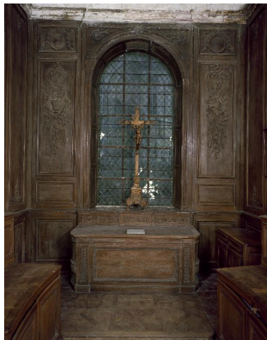
Vue générale de l'autel et de son environnement. IVR22_20010202523VA