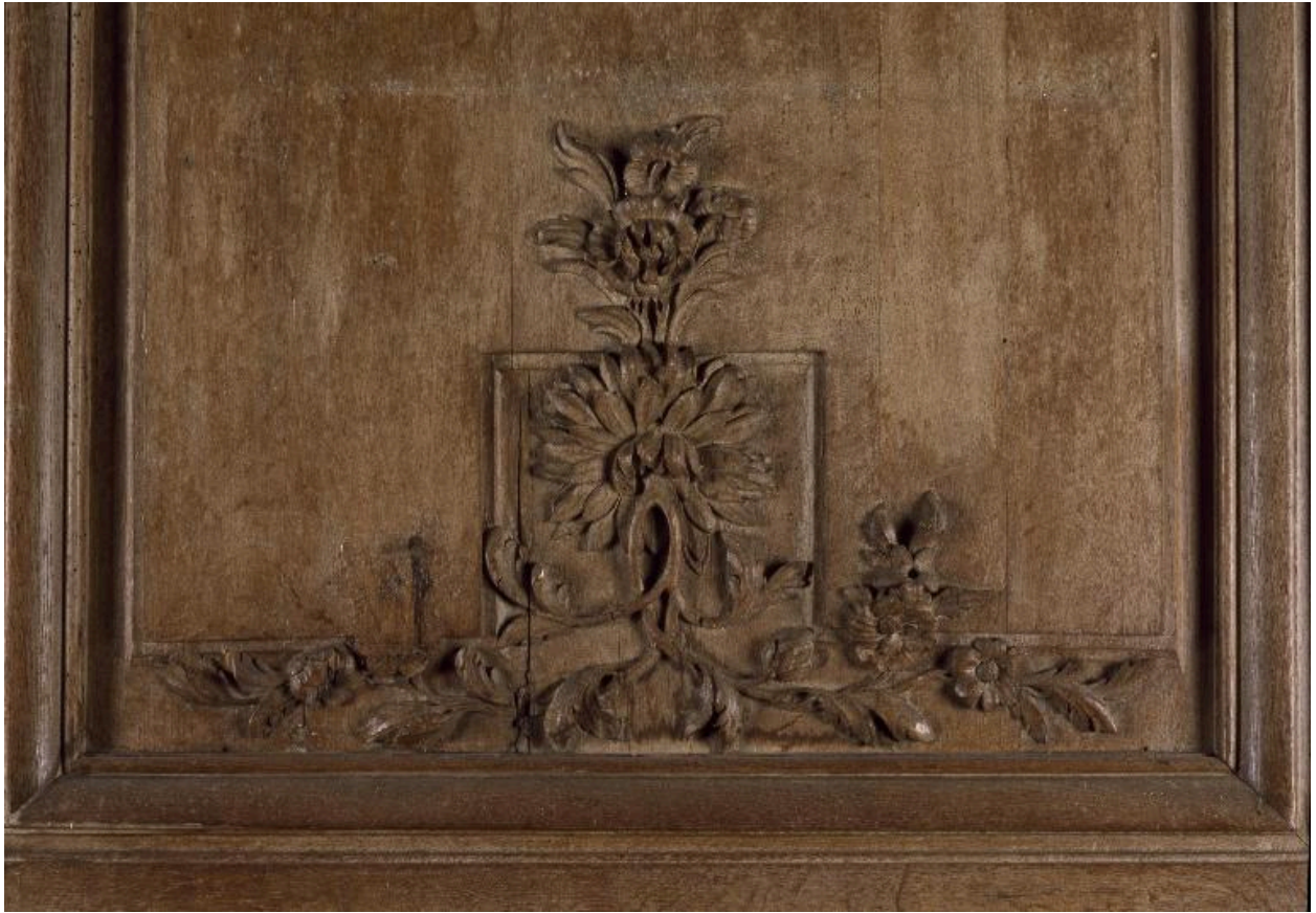
Détail du décor des lambris du mur nord.