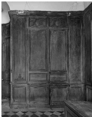
Vue des lambris du mur nord et des battants d'un placard encastré. IVR22_20010202407V