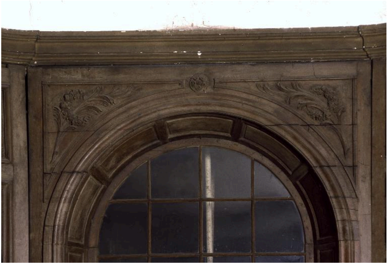
Détail du décor sculpté des lambris du mur oriental.