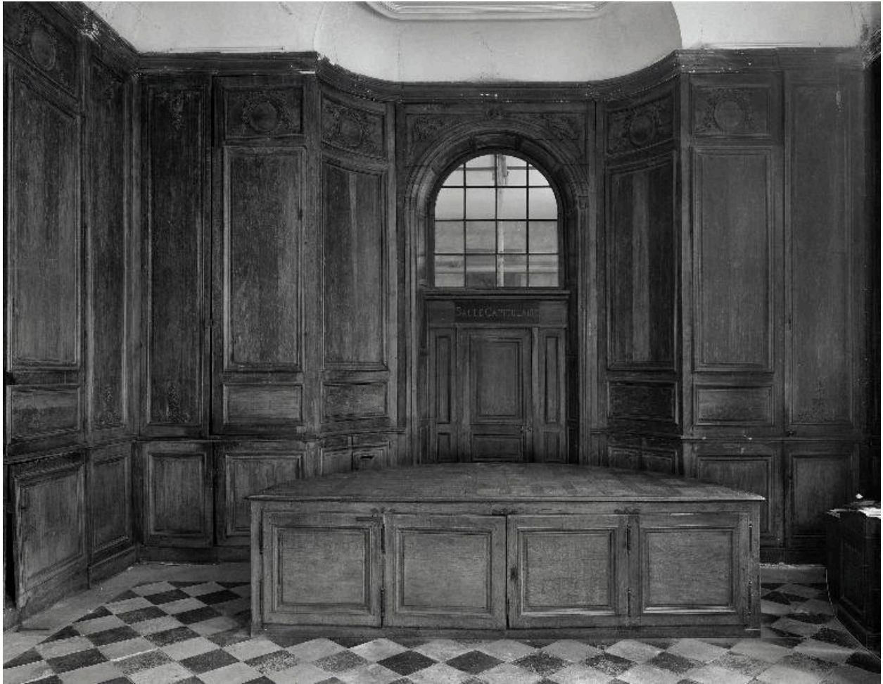
Vue de la partie orientale de la sacristie et de ses lambris.