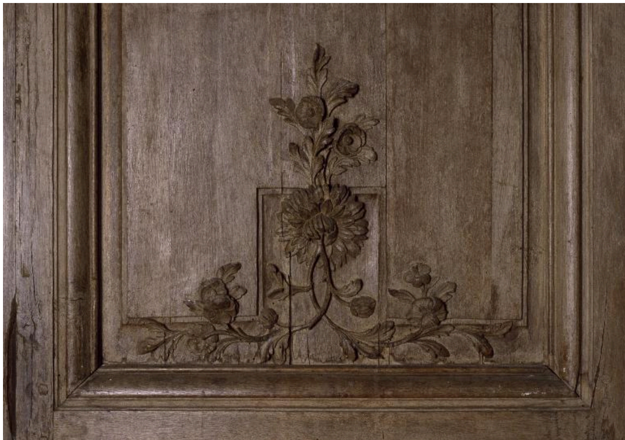
Détail du décor des lambris du mur nord.