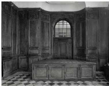
Vue de la partie orientale de la sacristie et de ses lambris.