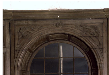
Détail du décor sculpté des lambris du mur oriental. IVR22_20010202331ZA