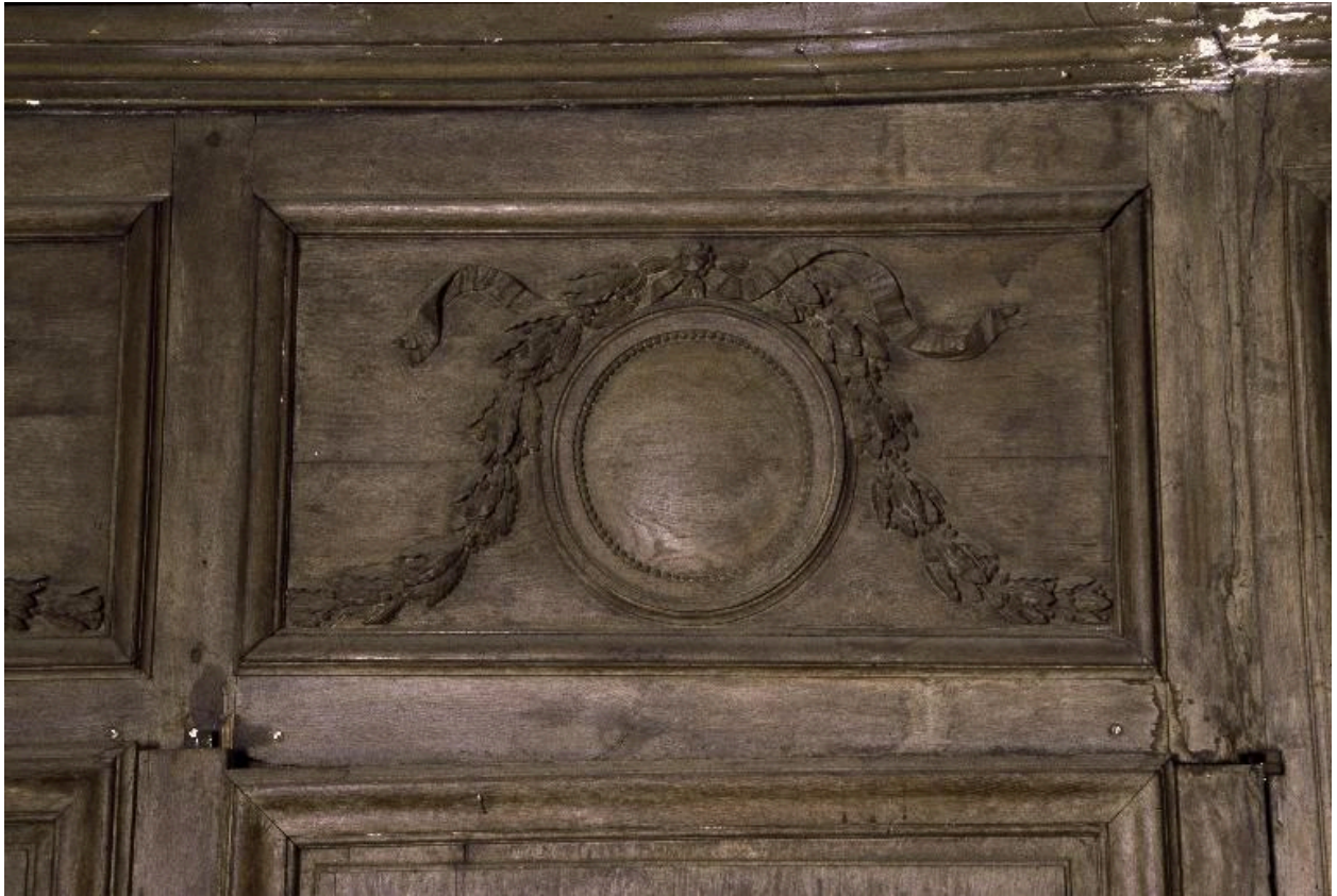
Détail du décor sculpté des lambris en chêne du mur nord.