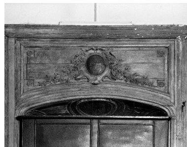
Détail du décor sculpté des lambris situés au-dessus de la grande porte.