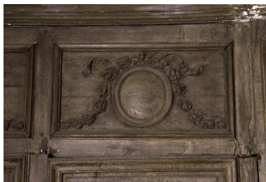
Détail du décor sculpté des lambris en chêne du mur nord.