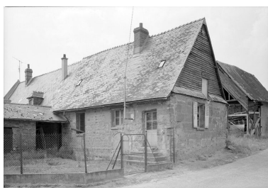
Elévation antérieure.

Plan de situation. Extrait du plan cadastral de 1982, section B2 414 et 413.