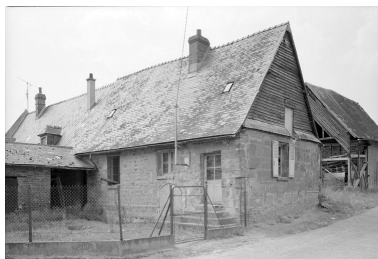
Elévation antérieure. IVR22_19846000986X

Plan de situation. Extrait du plan cadastral de 1982, section B2 414 et 413.