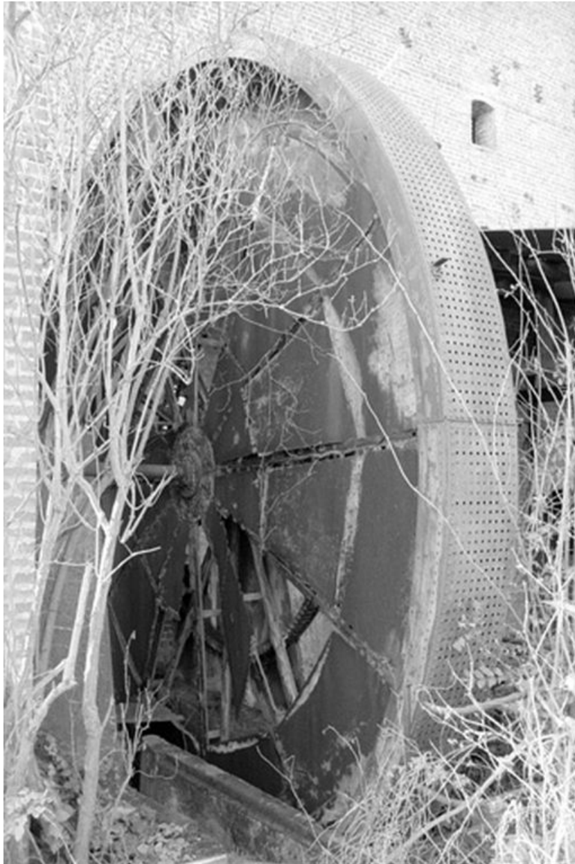
Roue de lavage.