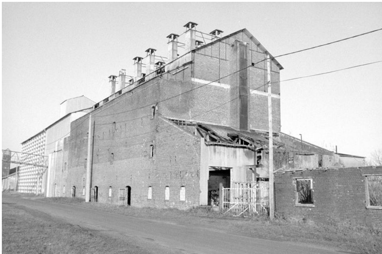
Atelier de fabrication, élévation antérieure.