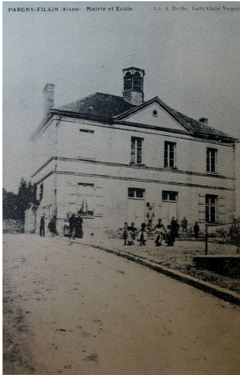
Vue de la mairie-école avant la guerre.