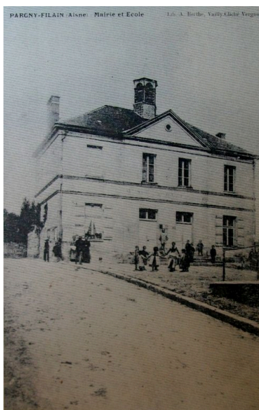
Vue de la mairie-école avant la guerre.