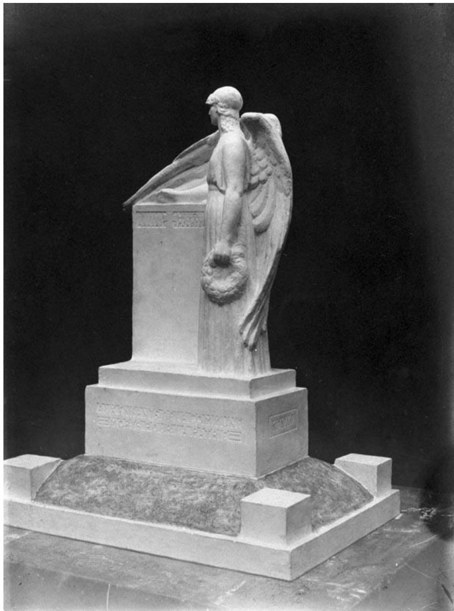
Photographie ancienne de la maquette du projet de monument aux morts : vue générale de trois quarts, l'arrière.