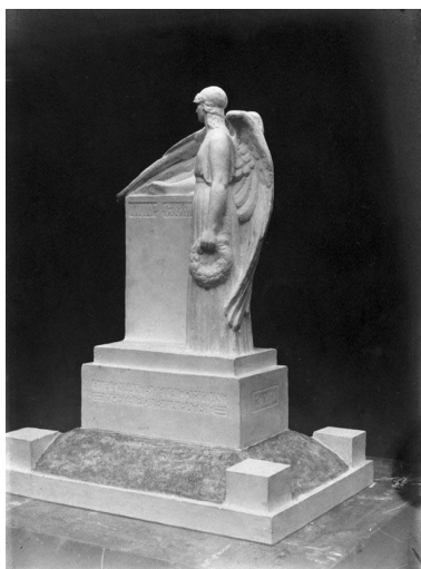
Photographie ancienne de la maquette du projet de monument aux morts : vue générale de trois quarts, l'arrière IVR31_20015901957XB