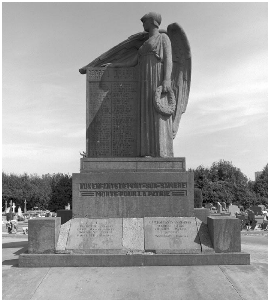
Vue générale sans le soubassement.