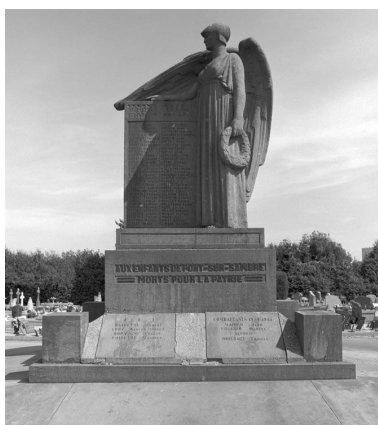
Vue générale sans le soubassement.