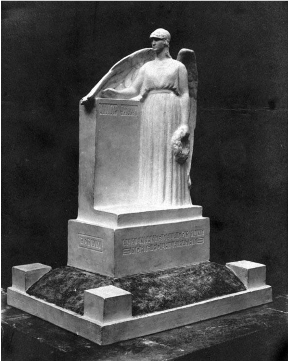
Photographie ancienne de la maquette du projet de monument aux morts : vue générale de trois quarts, devant (AD Nord ; O 468/15).