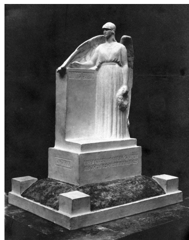
Photographie ancienne de la maquette du projet de monument aux morts : vue générale de trois quarts, devant (AD Nord ; O 468/15). IVR31_20015901959XB