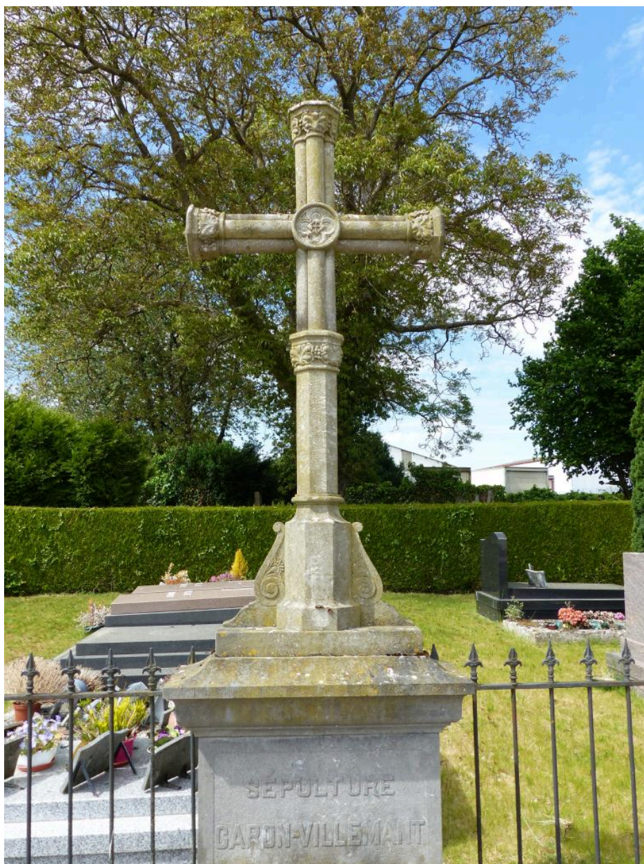
Vue de la croix funéraire.