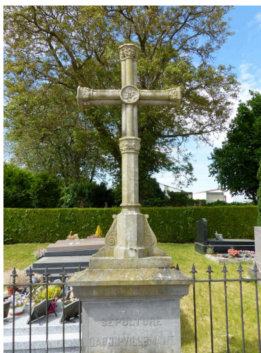
Vue de la croix funéraire.