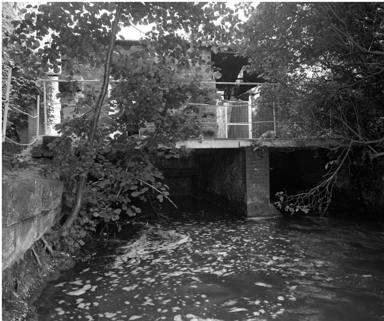
Le Thérain passant sous la salle des machines.