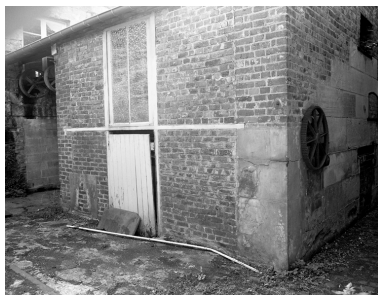
Façade nord de la salle des machines.