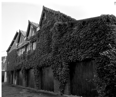
L'atelier de fabrication construit en 1932 : façade ouest à trois sheds.