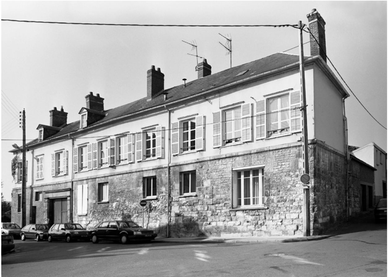
Le logement, côté rue de la Préfecture.