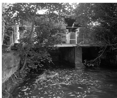
Le Thérain passant sous la salle des machines.