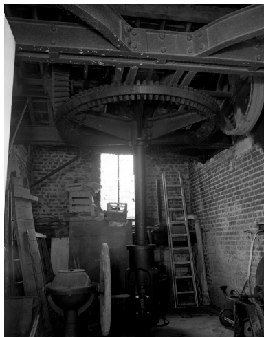
La turbine hydraulique installée en 1896. IVR22_19966002629X