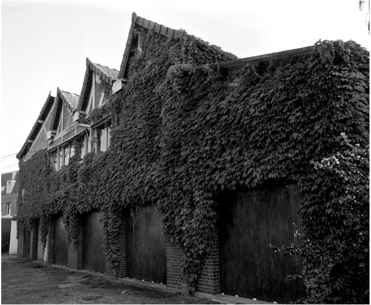
L'atelier de fabrication coustruit en 1932 : façade ouest à trois sheds.