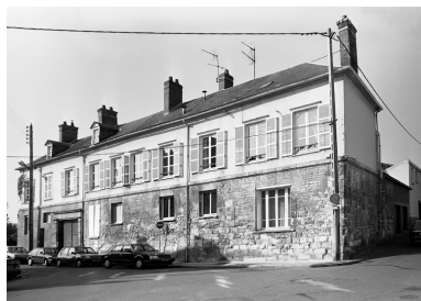
Le logement, côté rue de la Préfecture. IVR22_19966002624X