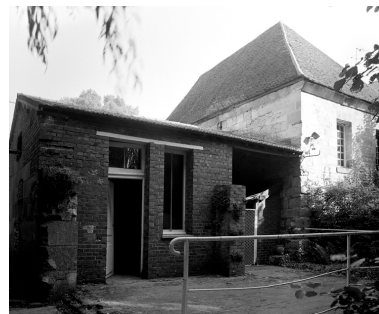
Façade sud de la salle des machines et de l'atelier de fabrication en pierre de taille.