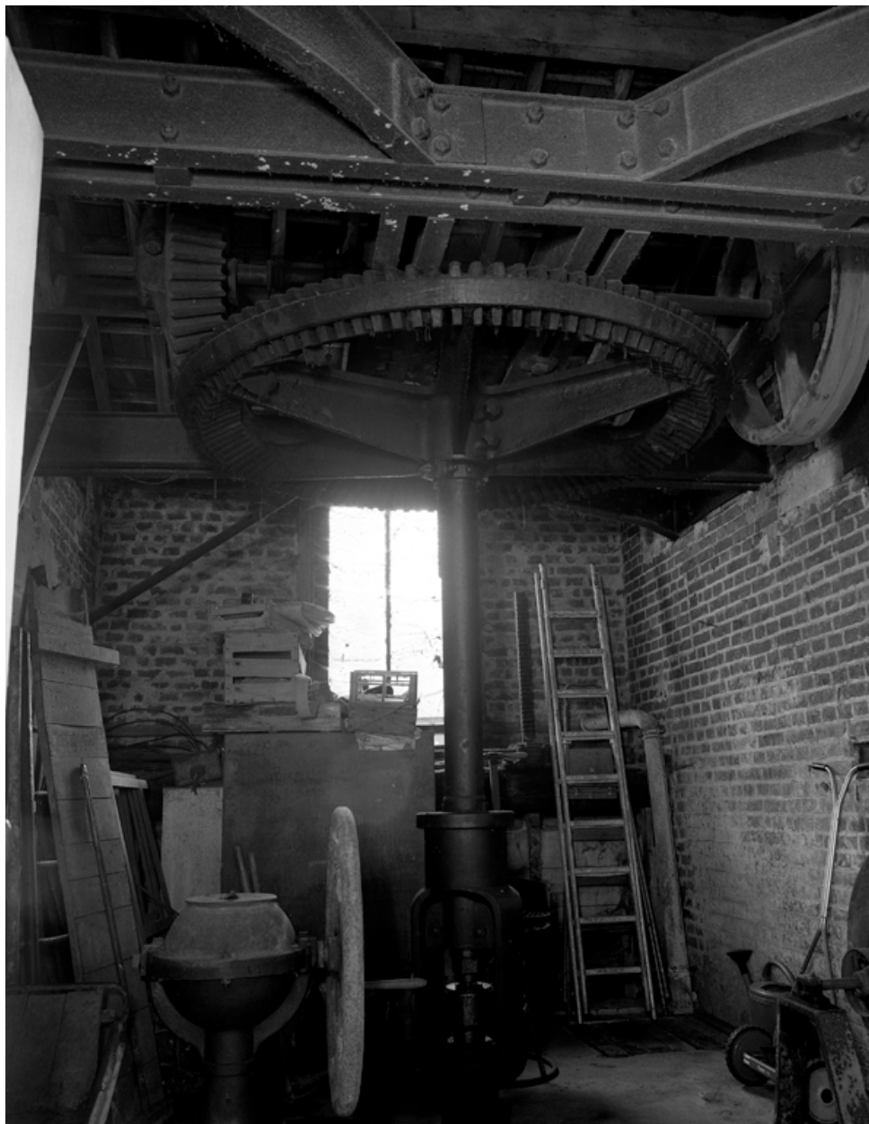
La turbine hydraulique installée en 1896.