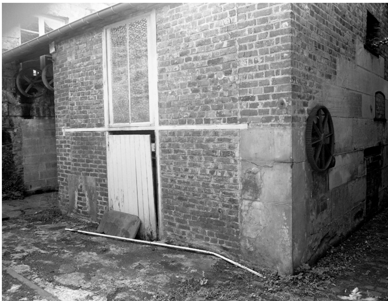
Façade nord de la salle des machines.