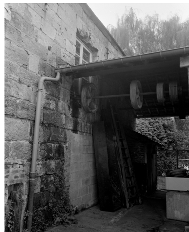
Système de poulies par courroies installé entre la salle des machines et l'atelier de fabrication en pierre de taille. IVR22_19966002635X