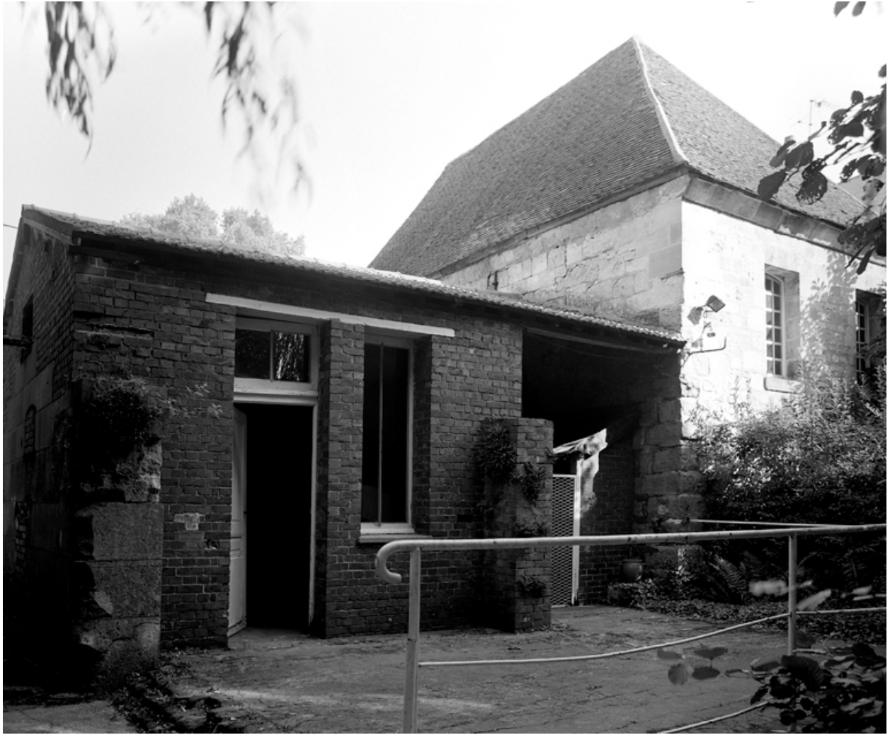
Façade sud de la salle des machines et de l'atelier de fabrication en pierre de taille.