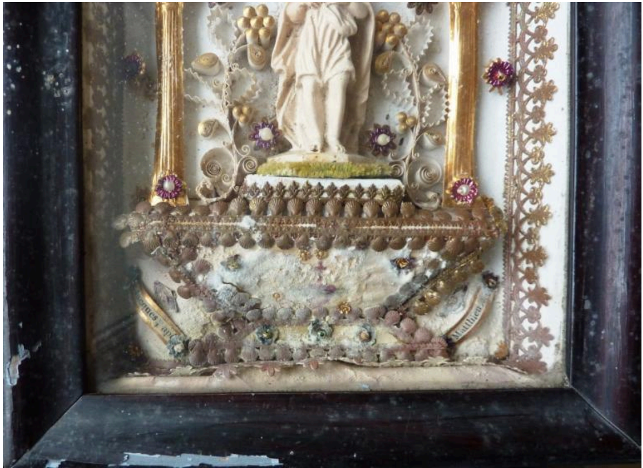
Détail de la partie inférieure.