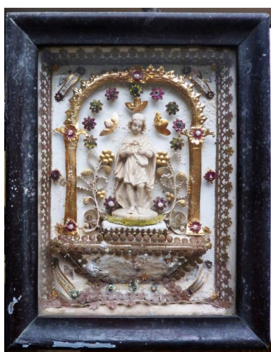
Vue générale. IVR32_20178000020NUCA