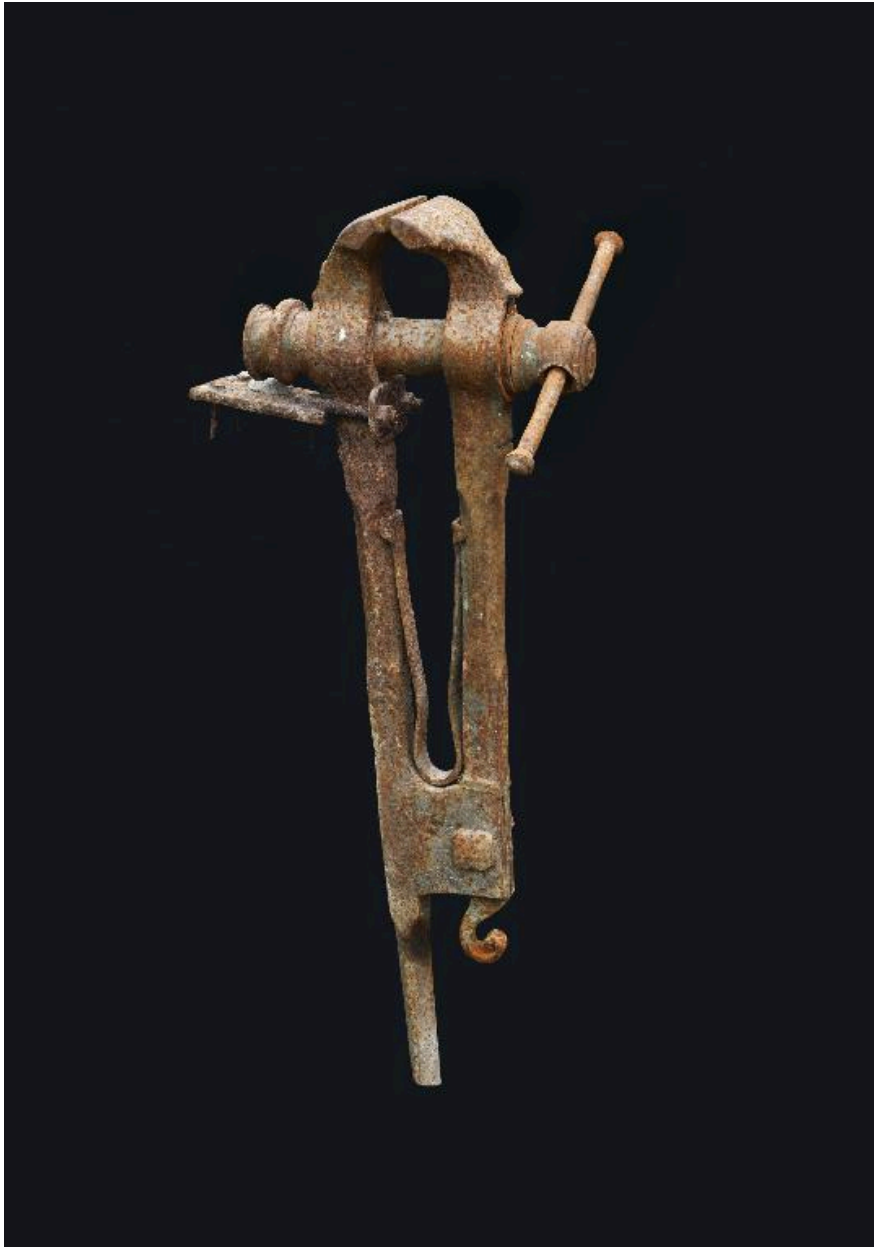
Etau de serrurier.