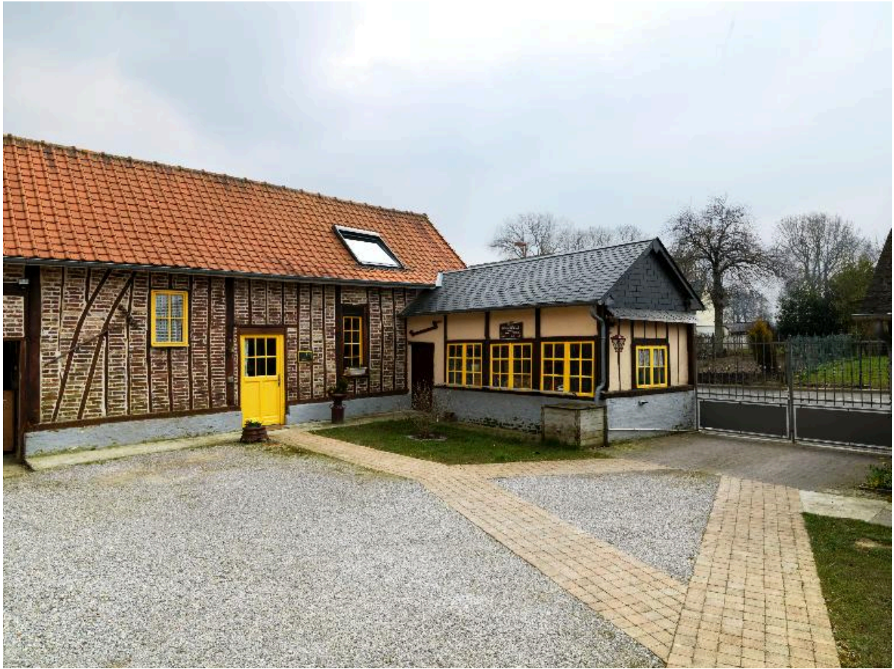
Vue générale depuis la cour.