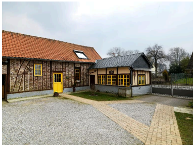
Vue générale depuis la cour. IVR22_20138000056NUC2A