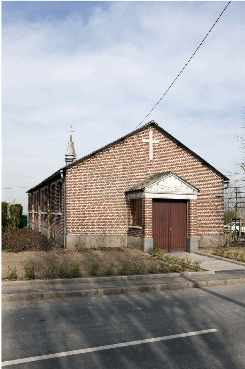
Élévation antérieure et flanc gauche.