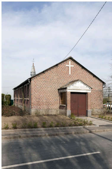
Élévation antérieure et flanc gauche.