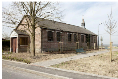
Élévation antérieure et flanc droit.