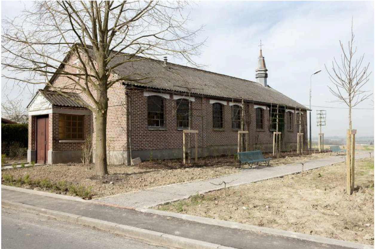
Élévation antérieure et flanc droit.